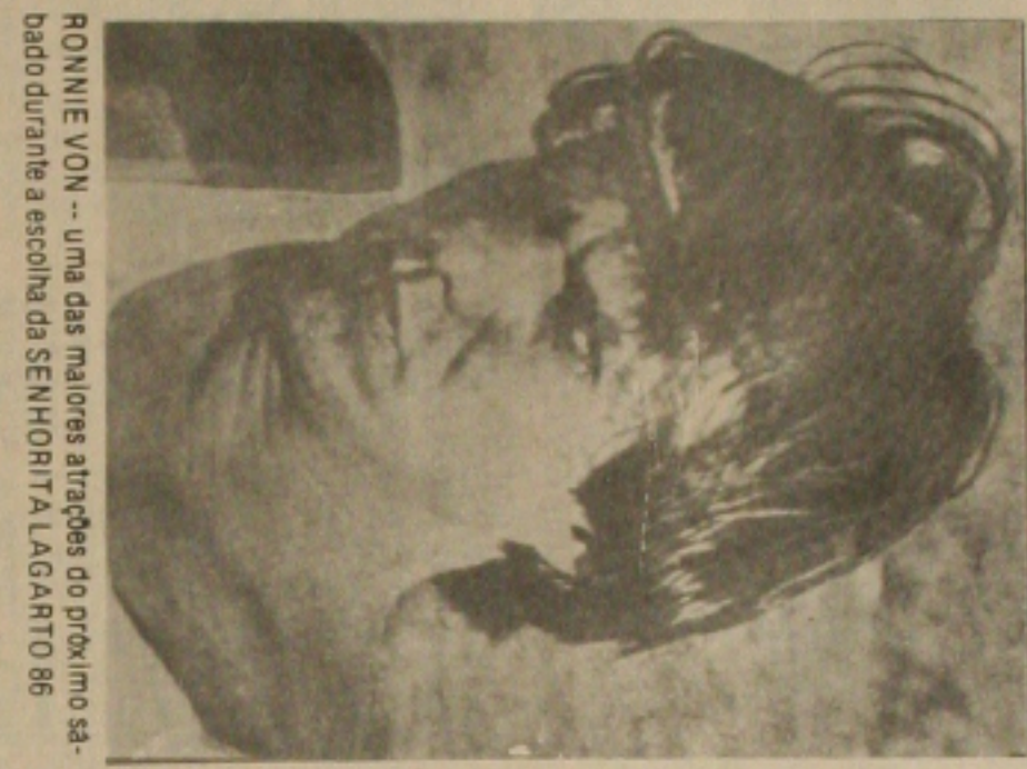
RONNIE VON -- uma das maiores atrações do próximo sábado durante a escolha da SENHORITA LAGARTO 86