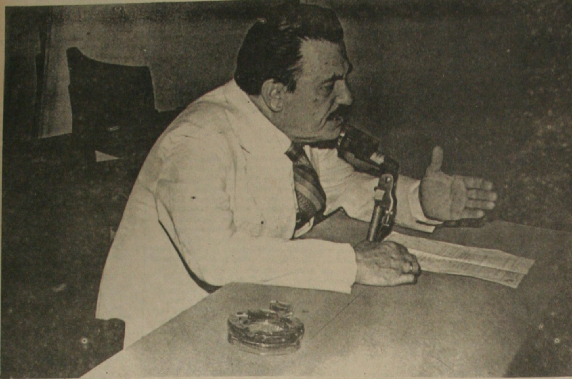
General Franz Ludwig Rode, diretor-presidente da Telergipe.