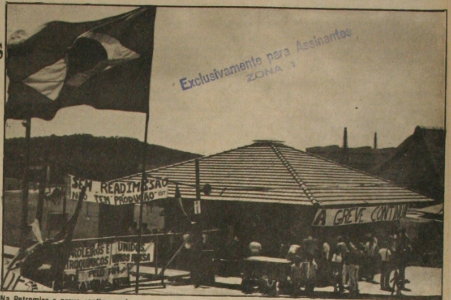
Na Petromisa a greve continua, só os ônibus voltam a circular.

Informou ele, que os tipos de pneus mais procurados são os da Brasília, Fusca, Chevette, Caminhão radial (Pneu de aço), onde os seus preços variam muito de Czs 407,00 à Czs 7.000,00, além de outros que são procurados pelas revendedoras. Acrescentou ainda que a previsão para normalizar a situação no comércio de pneus, só no segundo semestre de 1987, onde a expectativa do governo é liberar a importação de equipamentos originais e diminuir os contratos de exportação para que não haja crise como estas.