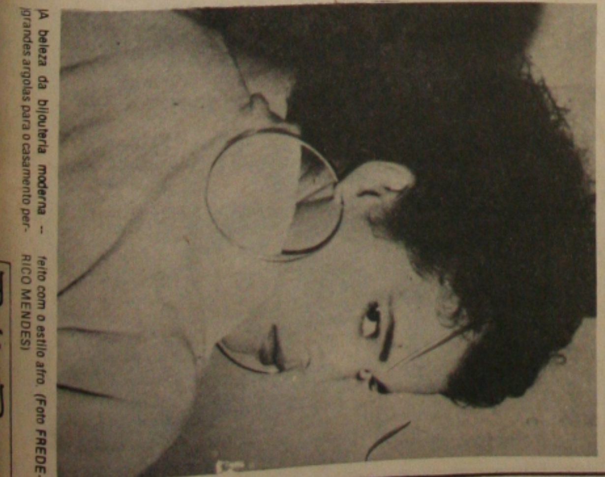
A beleza da bijouteria moderna -- feito com o estilo afro.

Vão aí alguns lembretes para a elegância diária: Só as "vedetes" chegam com grande estardalhaço e plumas na cabeça... As mulheres elegantes chegam discretamente! Alas, discreção é sinônimo de elegância! Ganhar uma discussão é bom, mas não é imprescindível! Ceder elegantemente a vitória ao outro é também uma maneira de vencer. Muitas vezes deixamos de fazer um elogio, por timidez... Mas o elogio é uma demonstração de afeto! Se sim-