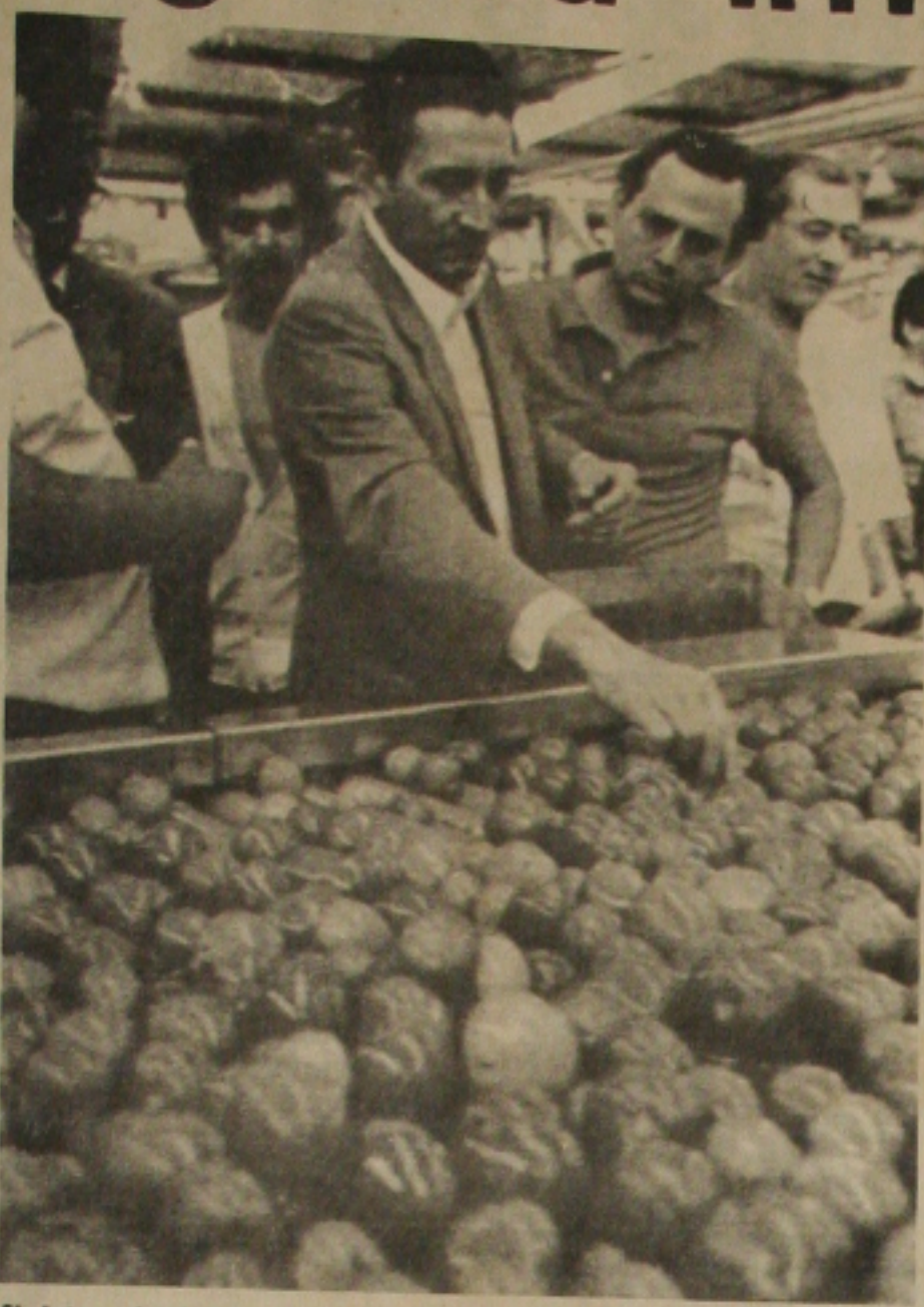
Ministro da Irrigação, Vicente Fialho, visita a indústria de esmagamento de tomate "Frutos do Vale", que processa a produção dos seis perímetros irrigados do Proine

SÍLIA - O Governo quer disciplinar o uso da água. Para isso, o Ministério da Irrigação, em conjunto com a Organização das Nações Unidas (ONU), que deverão checar a próxima semana para o problema. A informação do Ministro Vicente Fialho está preocupado com o uso indiscriminado da água na irrigação. De acordo com o Ministro, no passado, em Juazeiro, fatos entraram em conflito com a água do Rio Salgueiro causou a morte de dois filhos acrescentou que os Gerais os agricultores solicitando a liberação, por o Ministério, do direito de água do Rio para irrigar 2 mil, mil e quinhentos mil hectares. Fialho diz: "nós devemos ser muito cuidadosos, porque se começarmos a liberar estes direitos dougamos ao longo dos rios, ter um grande problema de conflitos". Uma equipe do Ministério da Irrigação, segundo o Ministro, está estudando uma proposta para estabelecer legislação que dê o direito de derivação de água. Ele disse que ainda não há uma data para enviar o projeto ao Congresso Nacional, até o final do ano, será enviado ao Presidente José Sarney em arcabouço da proposta de início do próximo ano a ser submetido ao Congresso.