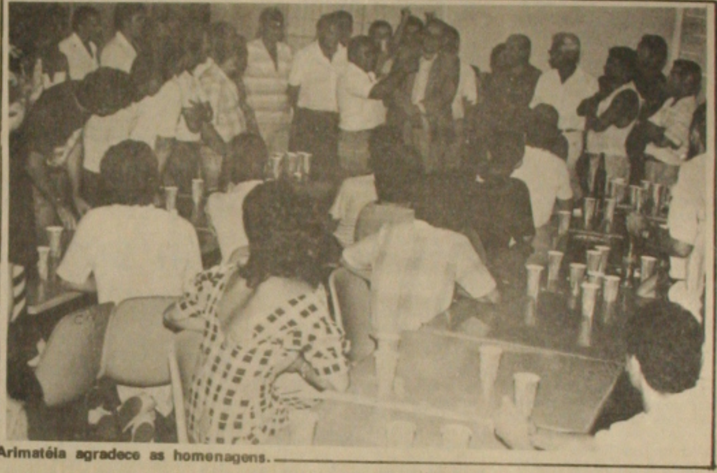
Arimateia agradece as homenagens.