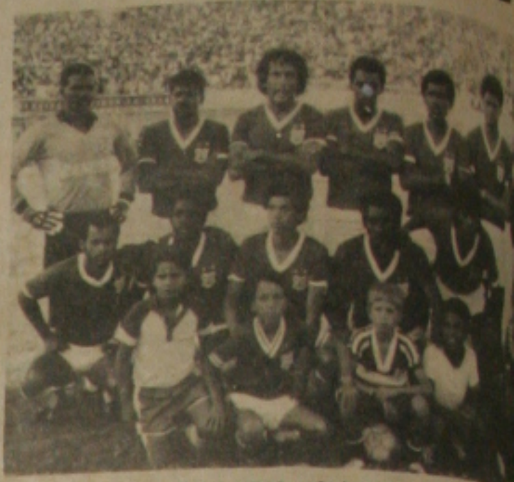
Sergipe tenta estreiar com uma vitória

O regulamento da competição deste ano é basicamente o mesmo de 85, e determinará que os critérios desempates são os seguintes: maior número de vitórias; melhor saldo de gols; maior número de gols a favor; menor número de gols sofridos e sorteio. Se na final os dois times terminarem empatados em pontos, após os dois jogos, haverá prorrogação de meia hora e, caso necessário, cobrança de pênaltis, para apontar o campeão de 86.