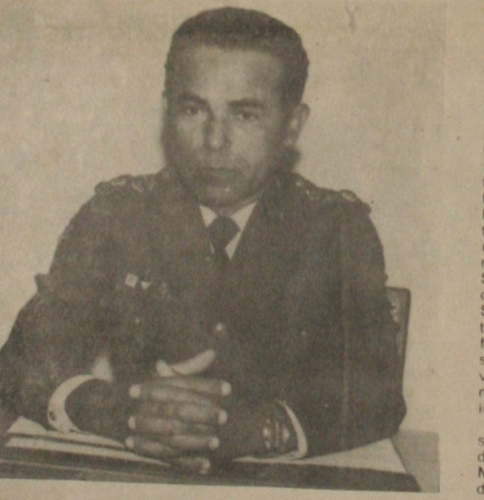
José Batista defende a permanência dos PMs

O Comandante Geral da Polícia Militar de Sergipe, coronel José Batista dos Santos Filho, disse que todos os comandos gerais das PMs do Brasil, são contra a propositura da extinção dessa guarnição como propõe a comissão de Estudos Constitucionais, uma vez que, é o ponto básico na sustentação de nossa defesa são as instituições militares as quais são seculares. O Comandante acrescentou que por diversas vezes participou de reuniões no sul do país com objetivo de defender a existência dessas instituições. "Só temos a considerar a tradição e a história cheia de bons serviços prestados ao povo brasileiro - disse José Batista dos Santos que traduz seu pensamento como o de todos os comandantes das PMs. "Não acredito que uma polícia já existente ou venha ser criada, desempenhará com autenticidade as missões peculiares em toda a sua existência. Confio em nossos futuros constituintes e espero que uma propositura como foi feita pela Comissão Provisória de estudos constitucionais não haverá de ser votada para colocá-la em evidência", concluiu o militar.