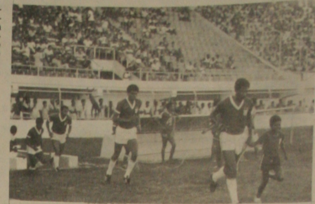
Sergipe acerta o pé na Copa Brasil.

Por outro lado, o Confiança acertou a rescisão do contrato com Albertino. O jogador recebeu Cz$ 10 mil e passe livre, po-