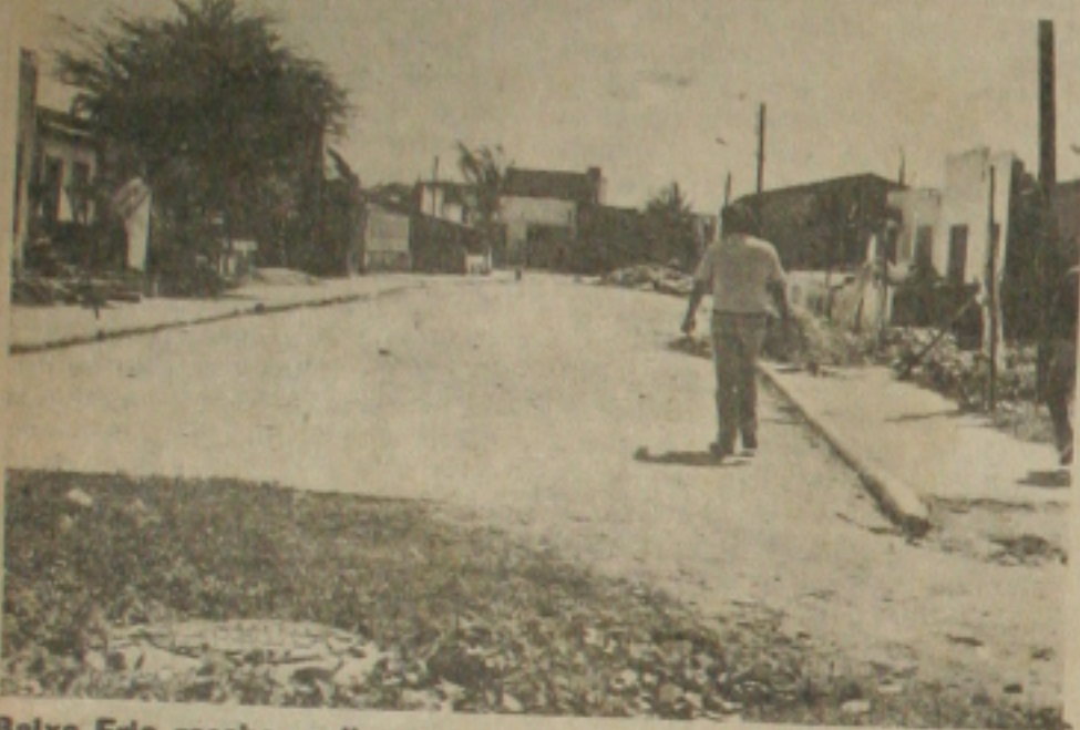
Baixa Fria recebe melhoramentos.