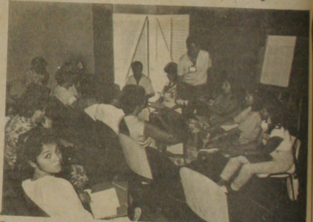
Reunião do pessoal ligado ao Projeto Aribé, no auditório Lourival Baptista.

Desenvolvido pela Fundação Estadual de Cultura - FUNDESC através da Divisão de Projetos Especiais o Projeto Aribé visa proporcionar a comunidade do bairro Siqueira Campos uma maior participação no direcionamento das atividades desenvolvidas no Auditório Lourival Baptista. Este trabalho vem sendo realizado através de reuniões realizadas no próprio Auditório Lourival Baptista com líderes comunitários e membros da FUNDESC. Nessas reuniões estão sendo discutidas as formas de atuação dessas comunidades quanto a elaboração de projetos culturais a partir das próprias entidades sob a orientação