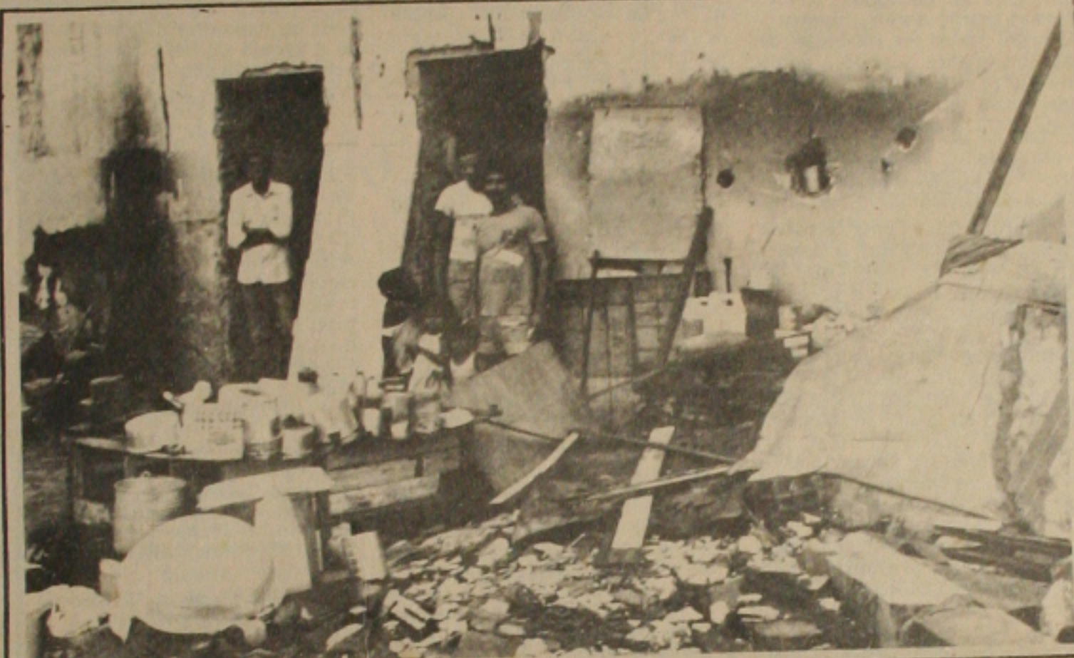
O sanitário abandonado serve como lar para as duas famílias.

Duas famílias alagoanas estão vivendo em completo abandono em banheiros que restaram de um galpão parcialmente danificados pelo tempo que fica localizado na rua São Cristóvão com Basílio Rocha. Ao todo são nove pessoas, dentre essas cinco crianças, que estão abrigadas há mais de três meses no galpão abandonado. Eles vieram para Sergipe em busca de uma melhor condição de vida, e estão nesta situação.