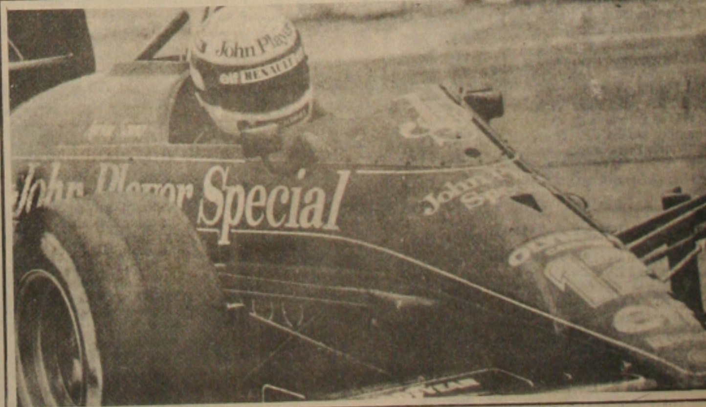
Motor explode e tira Senna da pole position.

MONZA -- Ayrton Senna vai largar em quinto lugar, ao lado de Nelson Piquet, na Grande Prêmio da Itália, a 13ª etapa do Campeonato Mundial de Fórmula 1. Essa prova começará às 10 horas (horário de Brasília), e terá 51 voltas pelos 5 800 metros do circuito italiano, um dos mais rápidos entre os usados pela F.1. Ayrton teve o motor de seu carro quebrado quando saía para fazer sua segunda tentativa de marcar tempo sendo que a pole position acabou ficando para o italiano Teo Fabi, que obteve 1m24s078.