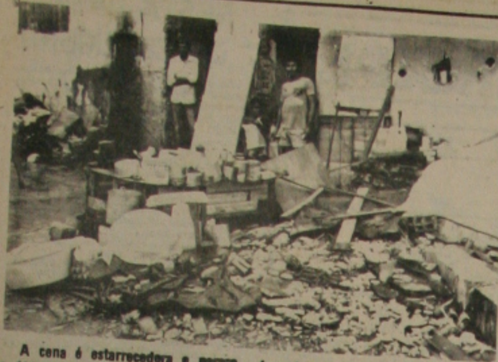
A cena é estarrascadora e porosa o México depois do terremoto. Mas é aqui mesmo em Aracaju, em pleno centro da cidade: familiares "vivendo" no meio de escombros...