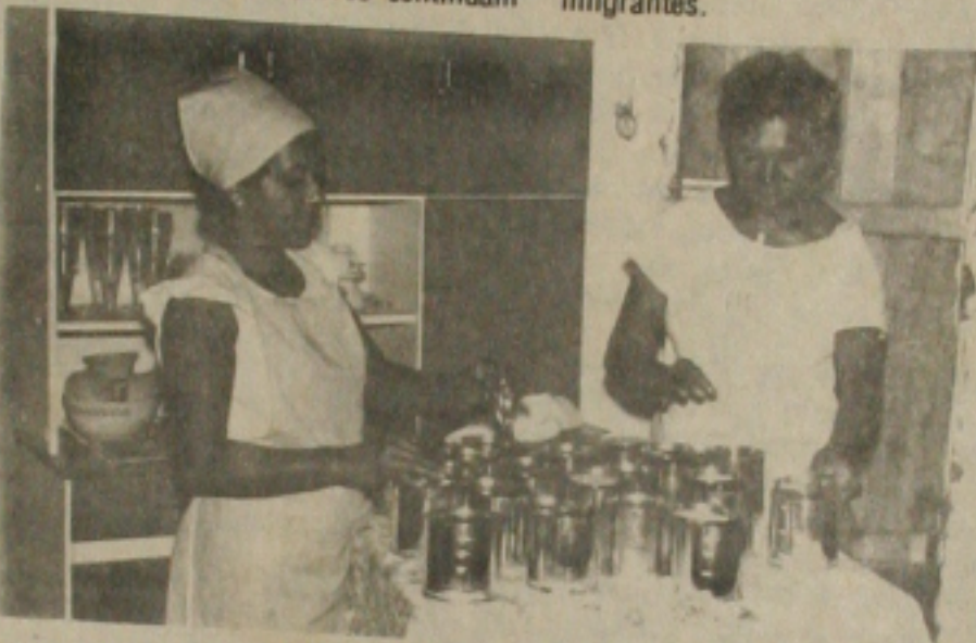
É bastante considerável a produção de doces artesanais, que sempre encontram uma boa clientela.