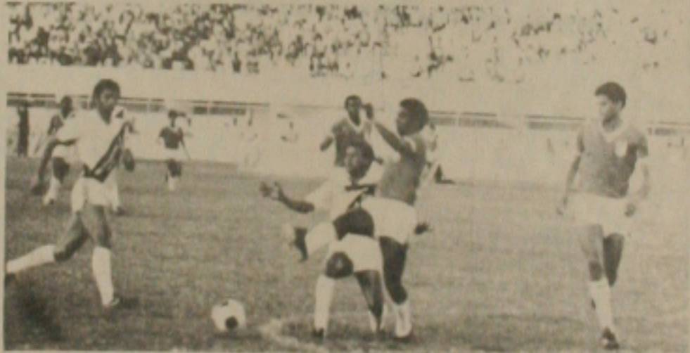
SERGIFE se prepara para jogar Atlético, Corinthians e Flamengo.

Depois da excelente vitória contra o América e o jogo de ontem em Lagarto, o Sergipe parte na próxima semana para uma temporada de três jogos pela Copa Brasil. São três compromissos de grande importância para o time rubro e qualquer ponto conquistado nessa saída do Sergipe será de grande importância para o time rubro, pois esses serão talvez, os jogos mais importantes, isso porque o Sergipe vai enfrentar o Atlético Paranaense, no primeiro jogo dia 11, no domingo enfrenta o Corinthians, no Pacaembu e finalmente vai jogar com o Flamengo no Maracanã num dia de quarta-feira à noite. Três importantes compromissos para o futuro do Sergipe na Copa Brasil.