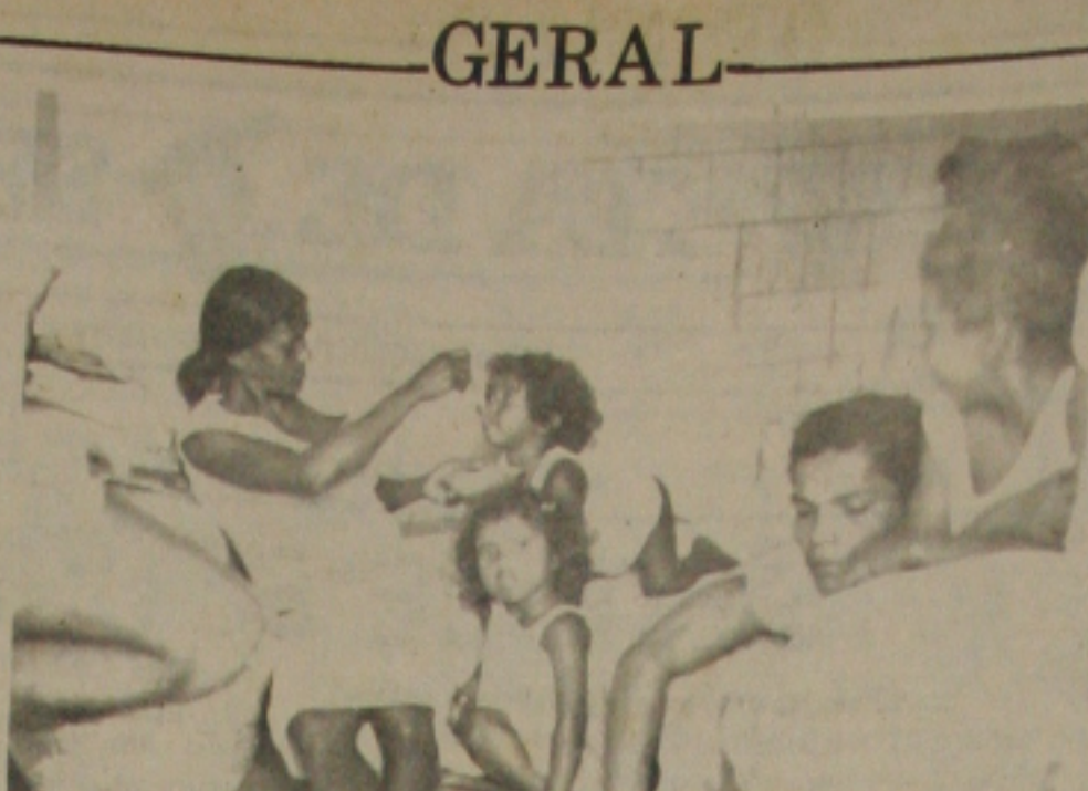
As crianças, naturalmente são as onde outrora foi um sanitário, arriscando-se a contrair graves enfermidades.