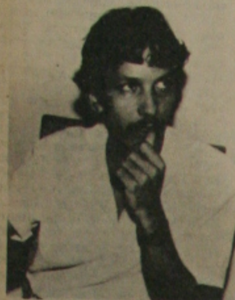
O Secretário dos Transportes, Ricardo Nunes só faz multar as empresas de ônibus que não cumprem o horário, esquecendo-se com isso de que a multa apenas não resolve.

entes para atender a demanda de milhares de pessoas que dependem de transporte coletivo para se deslocarem de suas residências para o trabalho - ou vice-versa - ou mesmo para os diversos locais de lazer em suas horas de folga. Acontece porém, que a SETURB vem se revelando impotente para controlar e exigir que as empresas que detêm o monopólio do transporte urbano em Aracaju - Progresso e Fátima - cumpram com o seu dever de bem servir à população. São poucos os bairros e conjuntos de Aracaju que são bem servidos em matéria de transporte, podendo-se incluir entre estes, o Bugio, Conjuntos Augusto Franco e Médici. Mesmo assim, não são poucas as vezes que os usuários reclamam da carência de transportes para esses núcleos habitacionais.