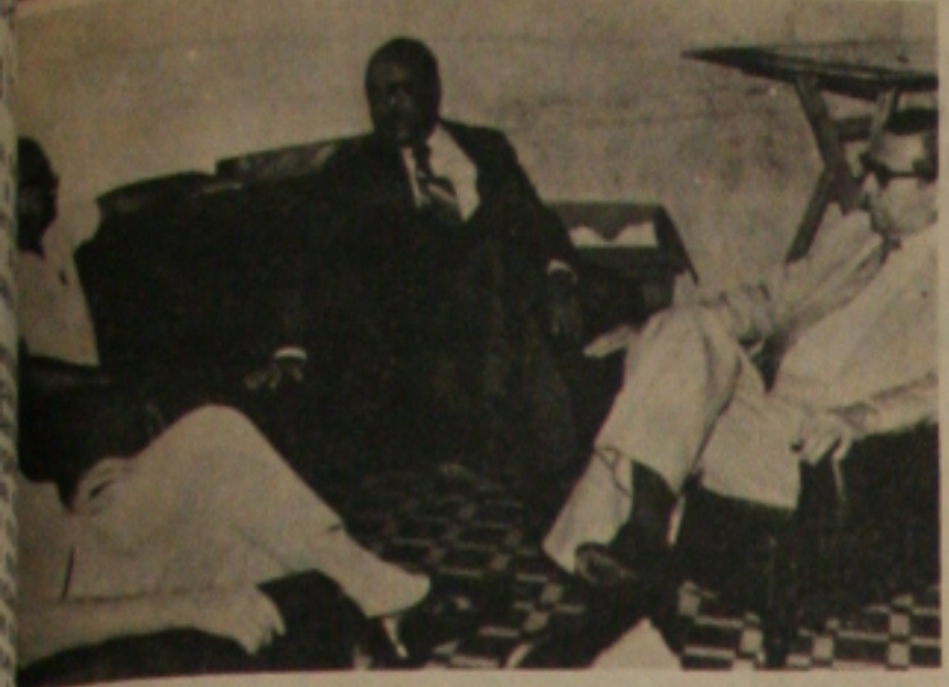
GOVERNADOR VISITA A GAZETA