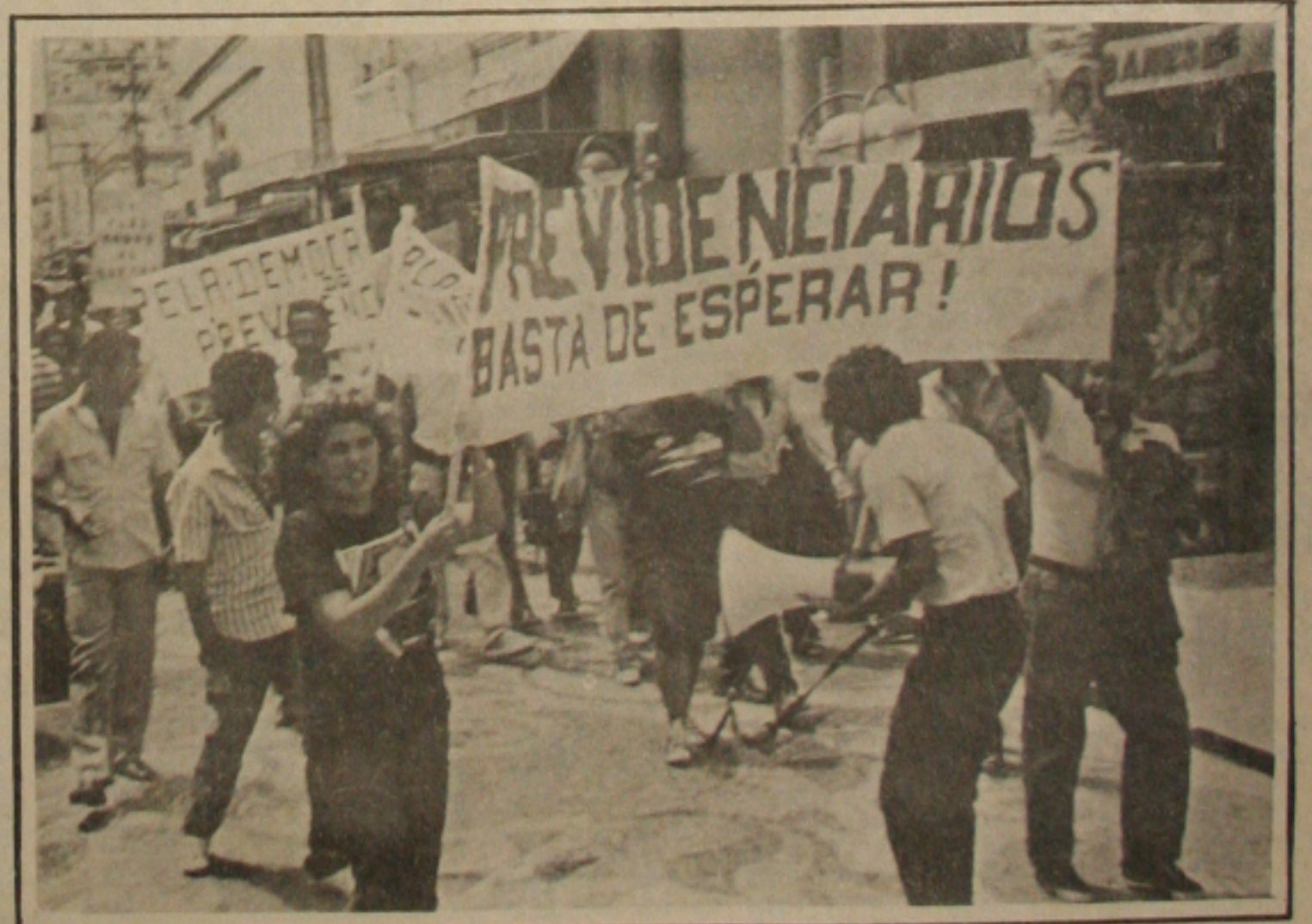
Previdenciários fizeram passeata pelo Calçadão da Rua João Pessoa.

Os previdenciários que trabalham nas Superintendências do INAMPS, INPS e IAPAS saíram ontem em passeata pelo centro da cidade com cartazes protestando contra a recusa do Governo Federal em não querer atender as suas reivindicações de