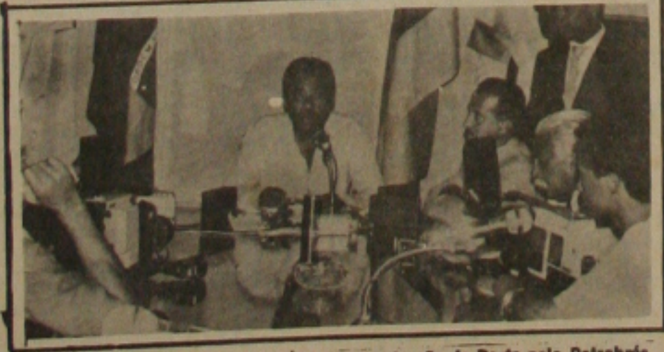
O Governador João Alves, comunicou a construção do Porto pela Petrobrás.

acrescentou entretanto que, a partir do momento de contratação do porto, a obra será gerenciada por comissão mista da Petrobrás e do Estado, conforme consta no edital.