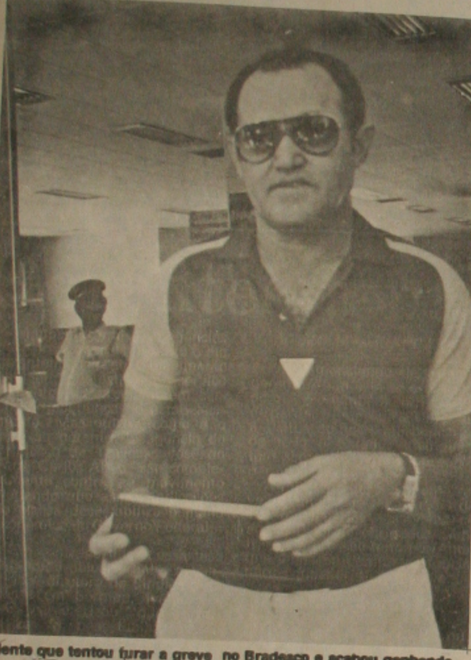
Cliente que tentou furar a greve no Bradesco e acabou ganhando uma vaia.