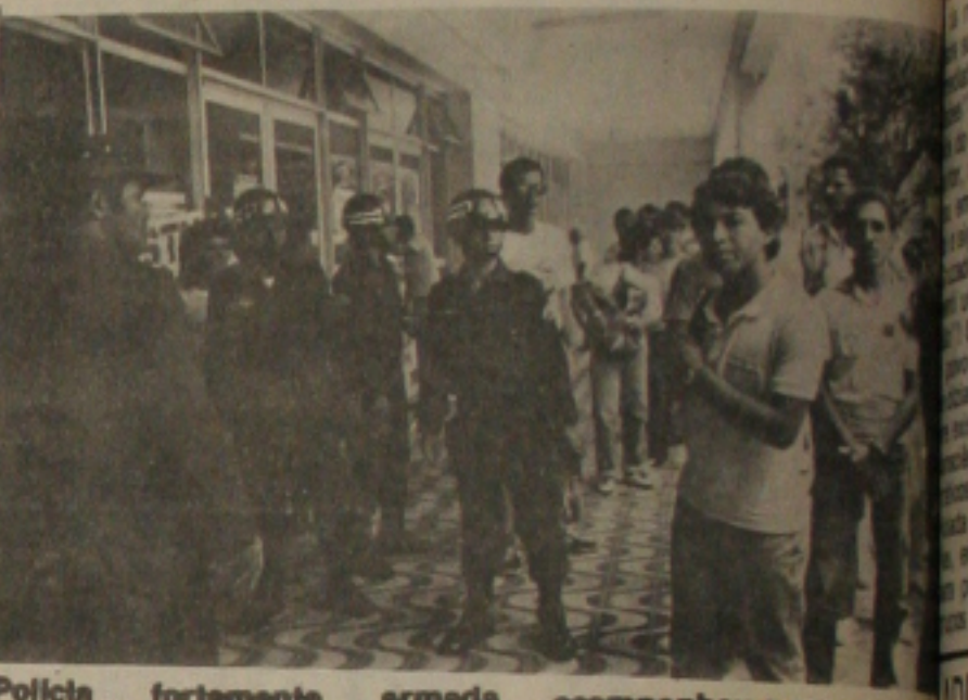
Polícia fortemente armada acompanhou a greve.

as minhas aflições, as minhas angústias, as minhas lágrimas, bem saibei Divino Coração, como preciso alcançar de Vós esta grande graça (pede-se a graça com fé). A minha conversa Convooco me dá ânimo e alegria para viver. Só de Vós espero com fé e confiança