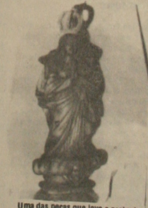
Uma das peças que leva a assinatura de Antônio Tavares.

nenhum incentivo para que os seus trabalhos sejam apreciados pelo seu próprio povo, além disso, segundo ele, as dificuldades são inúmeras para que um artista sergipano possa levar sua obra para mostrar fora do Estado. Uma exposição que não revela somente