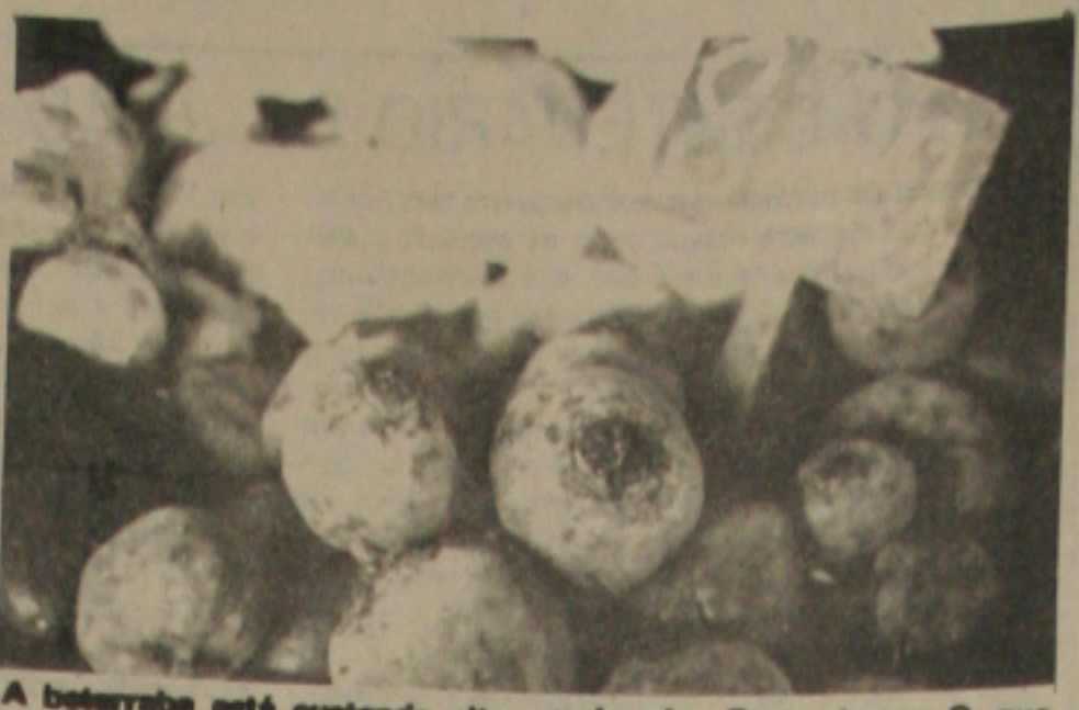
A beterraba está custando oito cruzeiros o quilo, mas com a nova lista da Sunab, deverá ser majorada. Pergunta-se: O que foi congelado, afinal, neste país?...