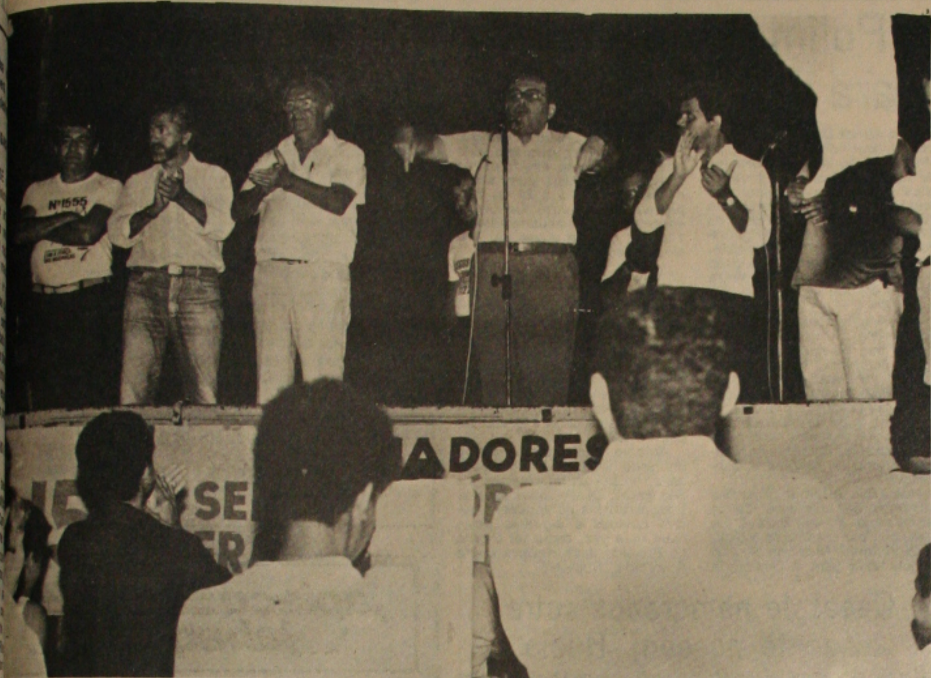
...sou fiscal do dinheiro público.

Quando eu era prefeito de Aracaju, fiscalizava obra e trabalhava no meu carro particular, não o atual prefeito premeia vários carros a empresa particular, desviando o dinheiro do Estado. Foi o que disse no comício no conjunto Santa Tereza, ao falar para os moradores da região, que mesmamente porque não existia o candidato do PMDB.