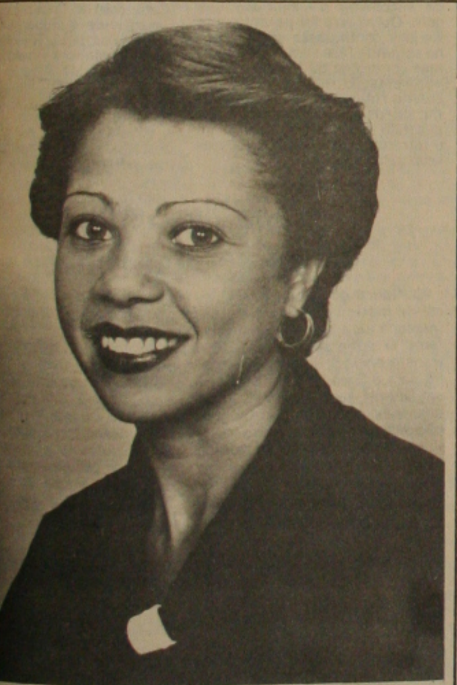
A cantora Rosemary que vem emplacando na novela Cambalacho, está preparando terreno para lançar o seu novo disco...