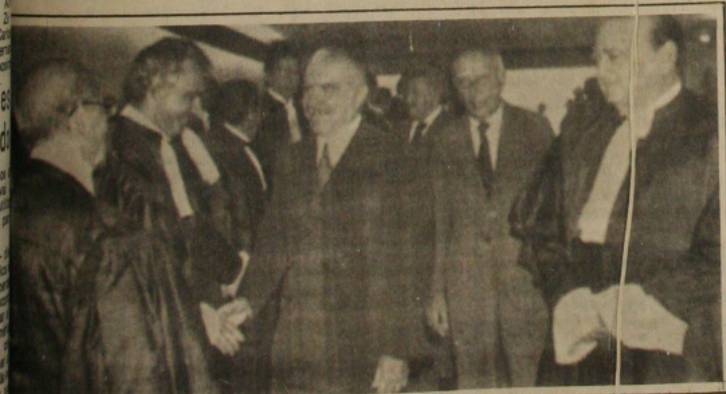
Presidente Sarney acompanhado do deputado Ulisses Guimarães, do ministro Paulo Brochado e do ministro Lauro Leitão cumprimenta os Juizes do Tribunal Federal de Recursos nas comemorações dos 40 anos daquela Corte.

A praça de táxi do Aeroporto de Aracaju reúne 23 veículos, em sua maioria carros Opala Comodoro de quatro portas.