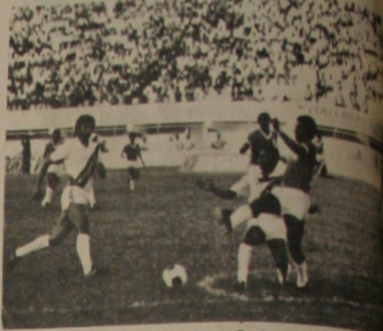
Rivaldo promete nova boa atuação domingo.

desmentiu a nota, dizendo que o desfile tornou-se uma festa na Avenida Barão de Maruim. Se os XI Jogos da Primavera tornassem uma "Olimpíada tavadantil" aí sim o desfile realizaria no Estádio Lourival Baptista, finalizou Leó