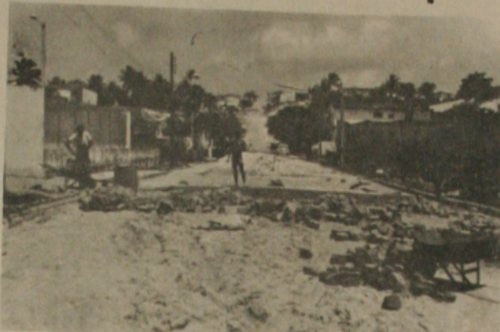
Bairro Getúlio Vargas, recebendo melhorias.

A Secretaria de Obras e Urbanismo está concluindo obras de pavimentação e drenagem no quadrilátero Estância/Avenida Desembargador Maynard e Gararu/Avenida Gentil Tavares, que muito beneficiarão a população ali residente e de há muito esquecida pelo poder público municipal.