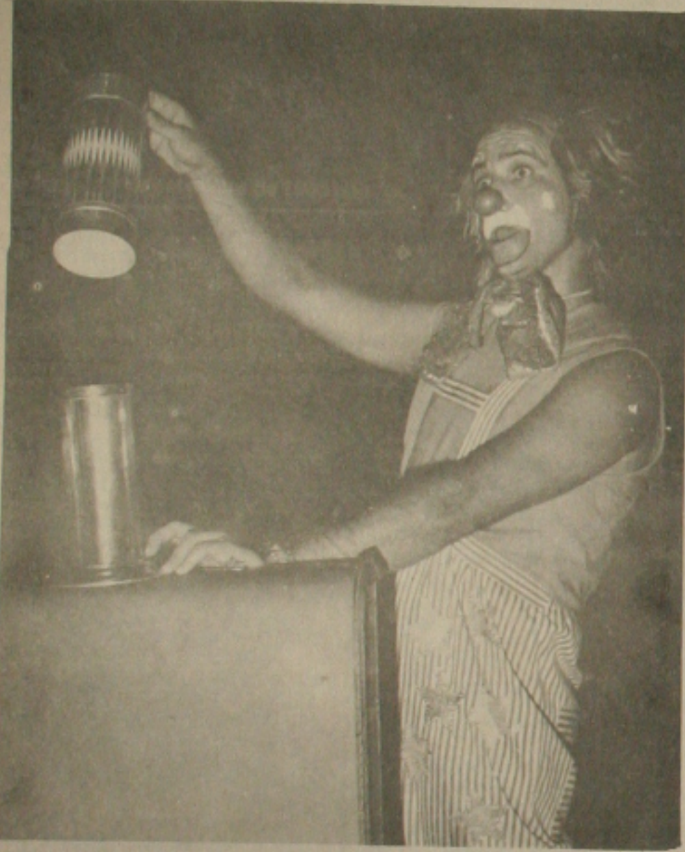
Cena de "O Detetive Palhaço", que estréia amanhã, às 17 horas, no Atheneu. Domingo, duas sessões, às 10 e às 17 horas.