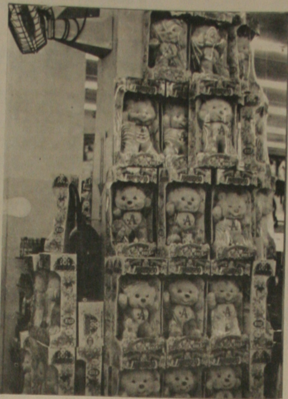
Não vai faltar brinquedo para quem quiser presentear a garotada no Dia da Criança.