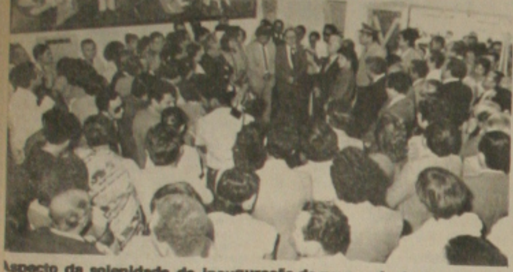
Aspecto da solenidade de inauguração da nova sede do Juizado de Menores, no último dia 17.

O Juizado de Menores de Aracaju registrou ontem, no seu primeiro dia de expediente normal, na sua nova sede, um dos fatos mais graves de toda a sua história. Trata-se de um agricultor morador no Povoado Mosqueiro que está sendo acusado de ter estuprado sua própria filha de dois anos de idade. A informação foi dada pelo juiz de Menores José Rivaldo quando preferiu omitir o nome do implicado, alegando questões éticas, mas garantiu que o ML já confirmou o estupro e encaminhado documentação à Justiça. Para este caso, o Magistrado garantiu que tão logo seja constatado indícios, o pai da criança será encaminhado à Delegacia Oficial competente a fim de que responda processo-crime e aí então será tomada a decisão judicial. José Rivaldo voltou a lamentar