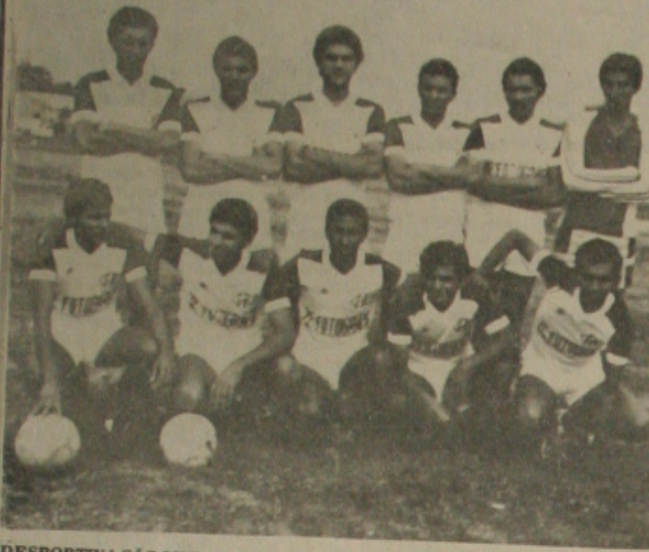
DESPORTIVA SÃO MIGUEL