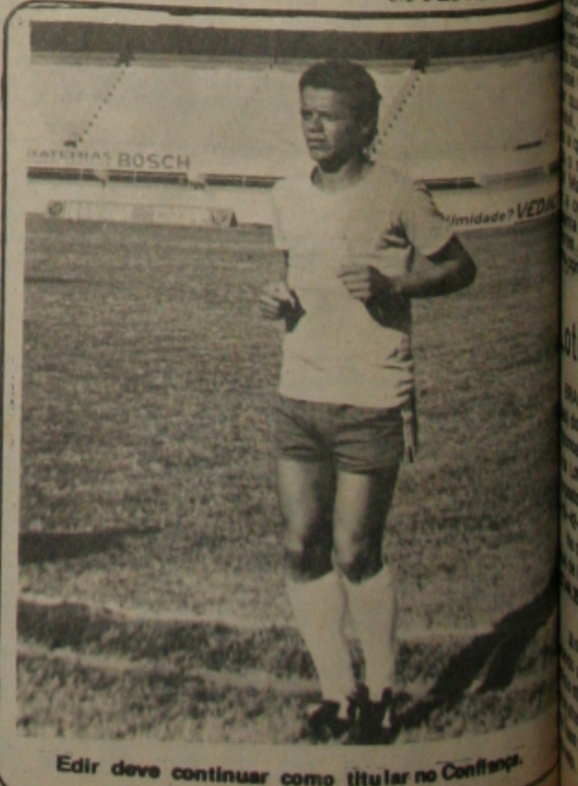
Edir deve continuar como titular no Confiança

Aeroporto de Guarulhos um ônibus à espera do Sergipe. Pelo desgaste da viagem, a CBF resolveu transferir o jogo de domingo à tarde, para a segunda-feira, à noite, a exemplo do que aconteceu com o Botafogo da Paraíba no último jogo em Aracaju.