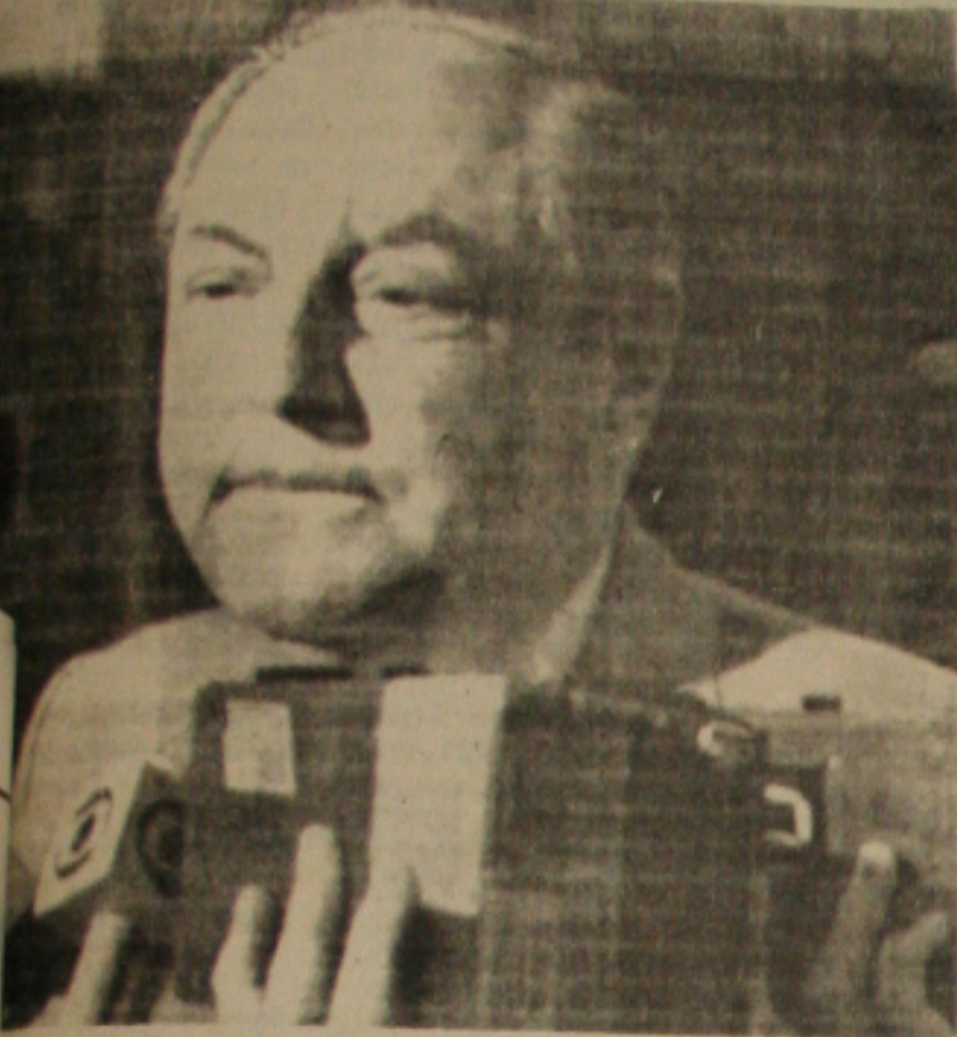
Aureliano e outra vez candidato a Presidente

SILIA — AG — A disputa sucessão presidencial começa a adquirir contornos mais concretos. Depois do Governador das Minas, Heliópolis, lançar oficialmente a sua candidatura ao Presidente do PMDB, o Ulysses Guimarães, o qual que seu nome também já foi lembrado, foi a vez do ministro das Minas e Energia, Aureliano Chaves, apesar de que "por enquanto esta disputa, ele não descartou, a possibilidade de candidatar-se à Presidência da República no futuro.