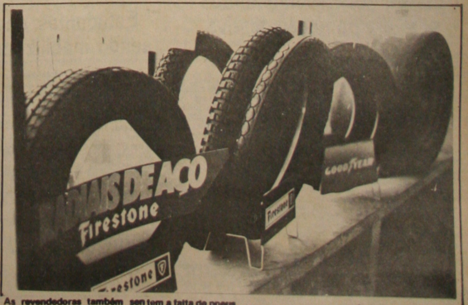
As revendedoras também sentem a falta de pneus.

Na Empresa Progresso o problema é o mesmo: faltam todos os acessórios, desde pneus até molas para fazer o serviço de reposição. Segundo o seu diretor Aderson Monteiro, a escassez do material poderá prejudicar o funcionamento da empresa, se perdurar por mais tempo essa crise. (página 02)