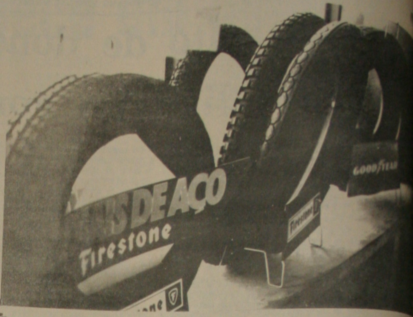
Foto 01 - coletivos poderão parar por falta de pneus

Monteiro acredita que deverá haver um colapso total no sistema de transporte coletivo em todo o país, principalmente em Aracaju, que recebe a sobra desses produtos que estão escassos nos grandes centros, como Rio de Janeiro e São Paulo.