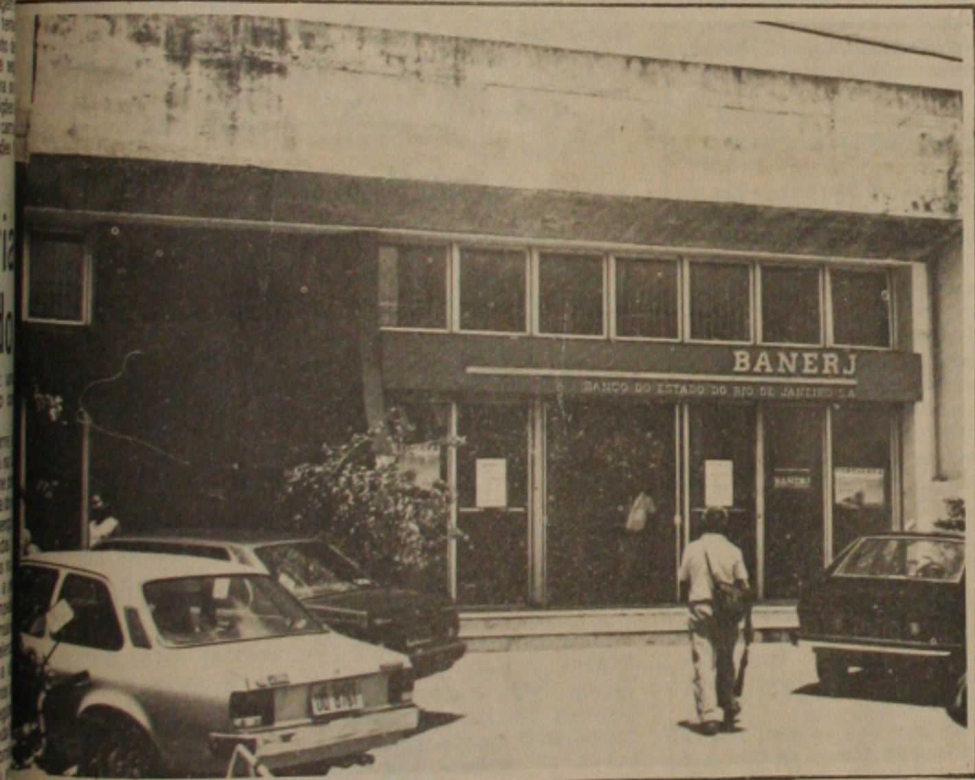
Prefeito promete punir bancos.

para o povo aracajuano, e não do prefeito ou de qualquer vereador, por isso devemos nos unir para que ela seja cumprida", disse. (Página 05)