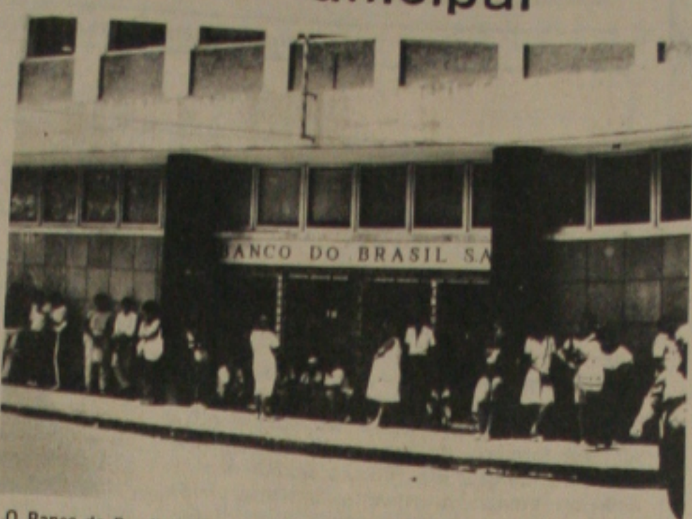
O Banco do Brasil assim como as demais, (é exceção do Banco do Estado do Rio de Janeiro) está abrindo às 11h 30m.