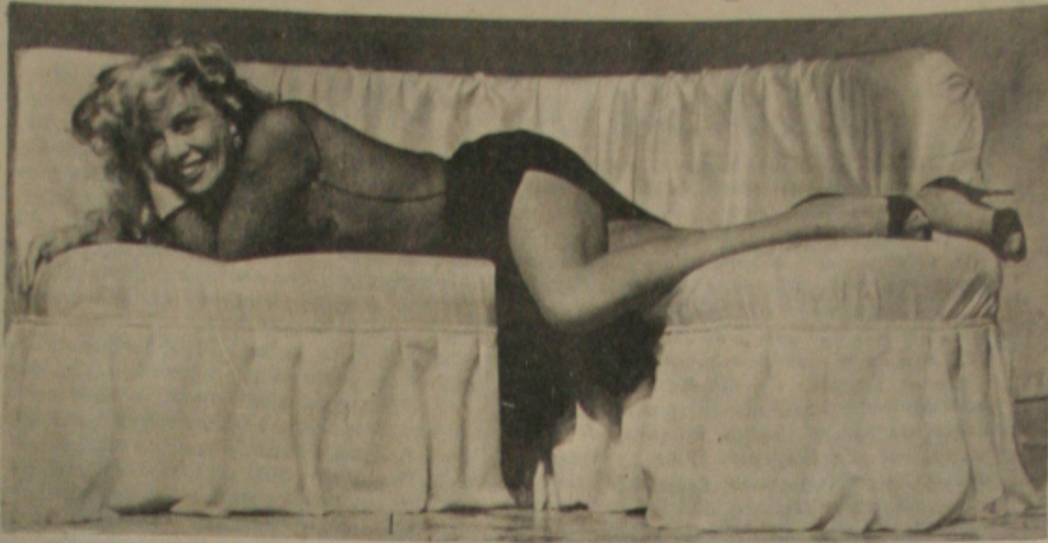
Rogéria é uma artista pra ninguém botar defeito. À excessão dos babacas e preconceituosos.