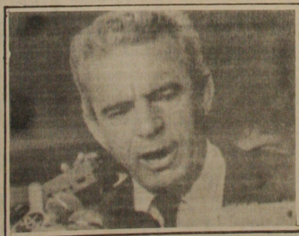
O ministro Iris Resende diz que o programa de abate do boi gordo a ser apresentado pelos pecuaristas evitará que o governo utilize de instrumentos mais radicais e extremados.

Iris Rezende informou que não pensa no racionamento, mas na racionalização da distribuição que passaria a ser feita em determinados dias da semana, para que essa distribuição seja compatível com a disponibilidade do produto". Ele reconheceu que as medidas até agora tomadas pelo Governo não permitem um abastecimento pleno.