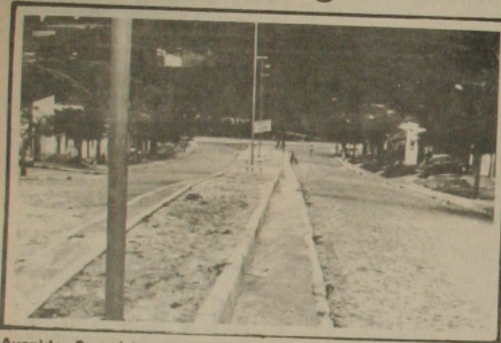
Avenida Sanatório, no bairro urbanizada.