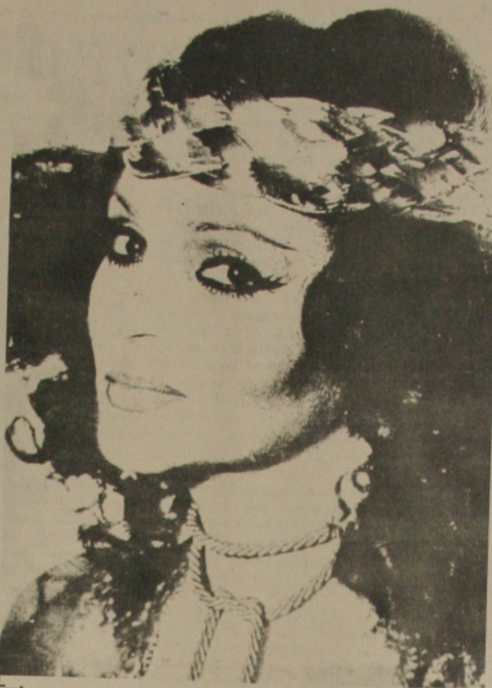
Embora sexagenária, Sarita Montiel conserva boa parte da beleza que a consagrou com um dos mitos sexuais do cinema.