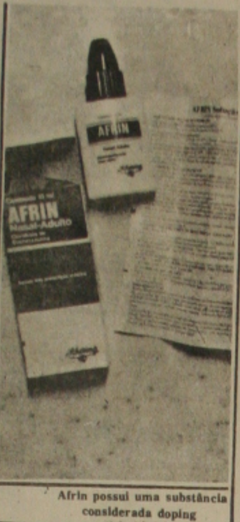
Afrin possui uma substância considerada doping