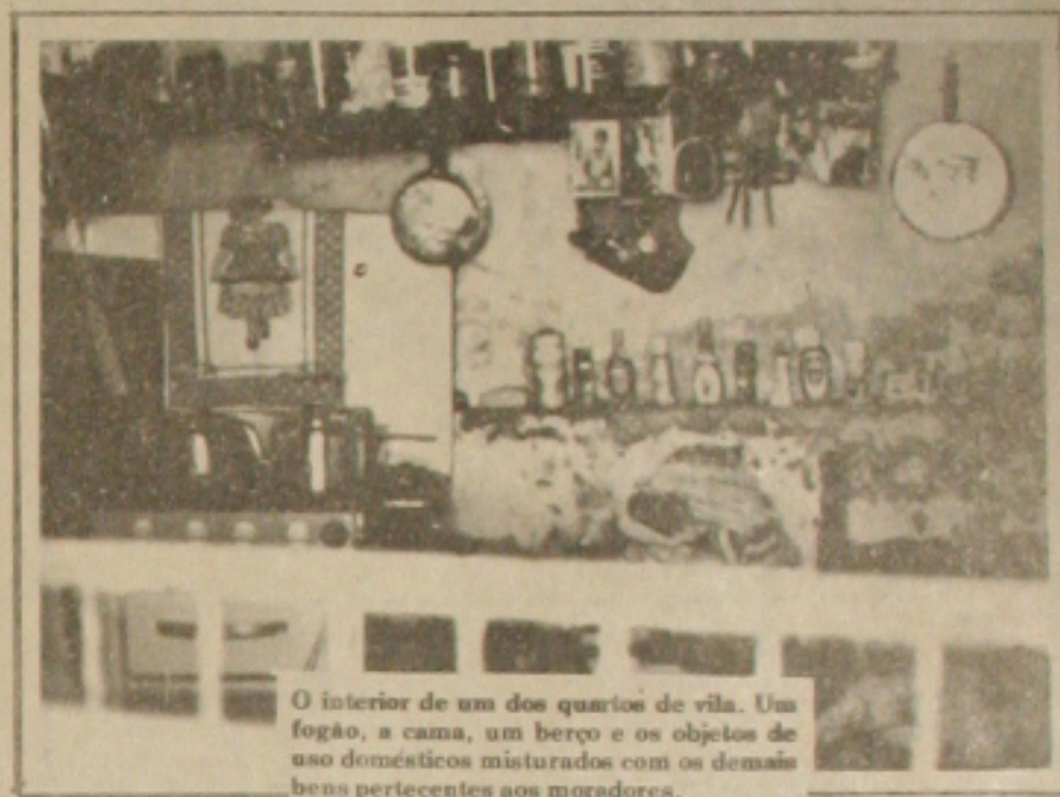
O interior de um dos quartos de vila. Um fogão, a cama, um berço e os objetos de uso doméstico misturados com os demais bens pertencentes aos moradores.

Judite Santos, 30 anos, 3 filhos, disse ter sido espancada por um dos filhos da patroa e quando reclamou, obteve a seguinte resposta: "... empregada é para suportar os defeitos dos patrões, coma calada".