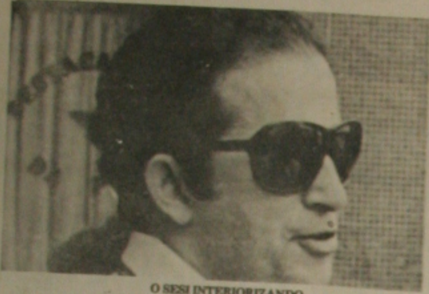
O SESI INTERIORIZANDO

Mais um tanto marca o Serviço Social da Indústria - Sesi, no progresso social-desportivo de Sergipe. Aquela importante instituição inaugurará hoje às 17 horas, na cidade de Boquim o Ginásio