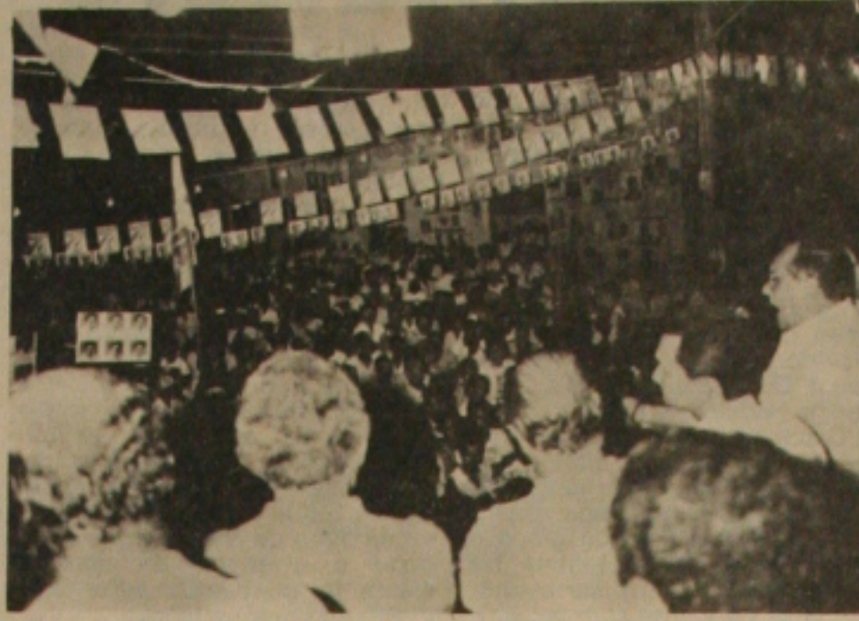
poder, enriquecer sempre à custa do sacrifício do povo.