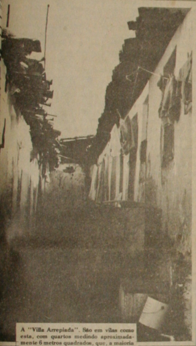
A "Villa Arrepiada". São em vilas como esta, com quartos medindo aproximadamente 6 metros quadrados, que, a maioria das domésticas moram com seus filhos enfrentando toda sorte de dificuldades.

de trabalho em uma mesma casa, e só agora, está recebendo o salário de Cr$ 300,00.