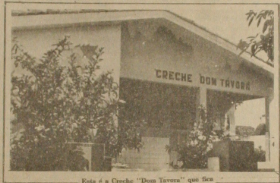
Esta é a Creche "Dom Távora" que fica na Praça da Bandeira onde abriga aproximadamente 200 crianças.

Com Cr$ 400,00 mensais para pagar transporte, comprar roupa, remédio, alimento para os filhos e o aluguel do quarto, numa vila no subúrbio da cidade, não lhe restou outra alternativa senão dizer: "a desgraça toda é a gente não ganhar o suficiente para sustentar nossos filhos".