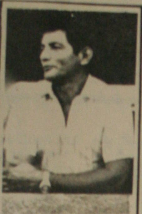
CARLOS SENDO CRITICADO

Será iniciado (hoje) à tarde, o I Campeonato Comunitário de Futebol da cidade de Frel Paulo. Eis os jogos marcados: Em Pinhão - Pal-