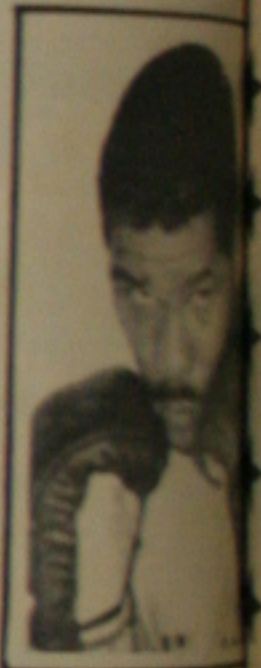
Maguila é o destaque

Os delegados de 115 países-membros do CMB reunidos até amanhã poderão decidir pela ruptura dos vínculos com a AMB (Associação Mundial de Boxe) e a FIB (Federação Internacional de Box), por causa das divergências quanto à questão do problema racial na África do Sul. O mexicano José Sulaiman, presidente do CMB, disse em seu discurso de abertura da convenção que o órgão tem tomado "a liderança entre as organizações desportivas internacionais