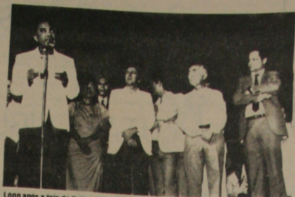
Logo após a fala do Reitor, o governador João Alves Filho fez seu discurso ressaltando o valor cultural de um evento como o Fasc.