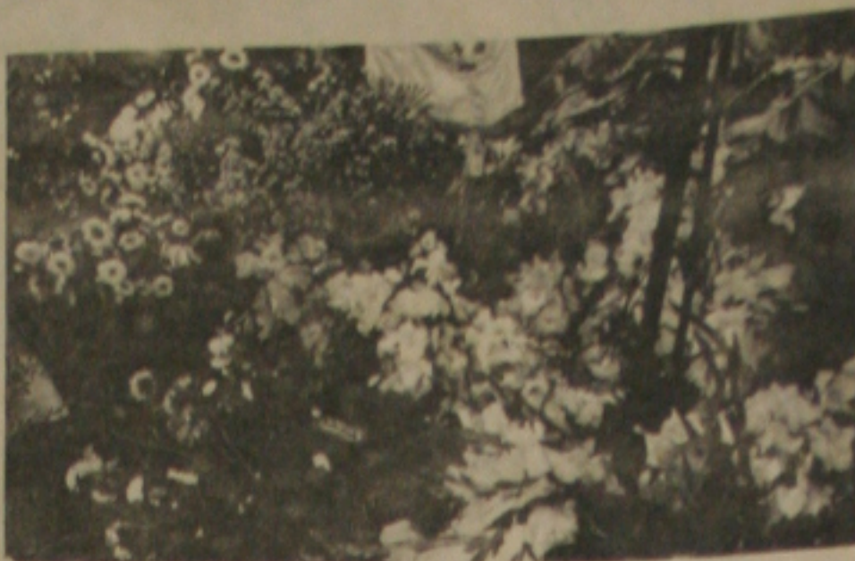
Cemitérios estão limpos no dia d- finados