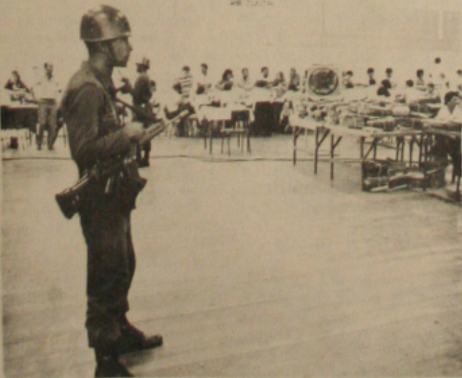
Eleição transcorre com lentidão sob controle do Exército.