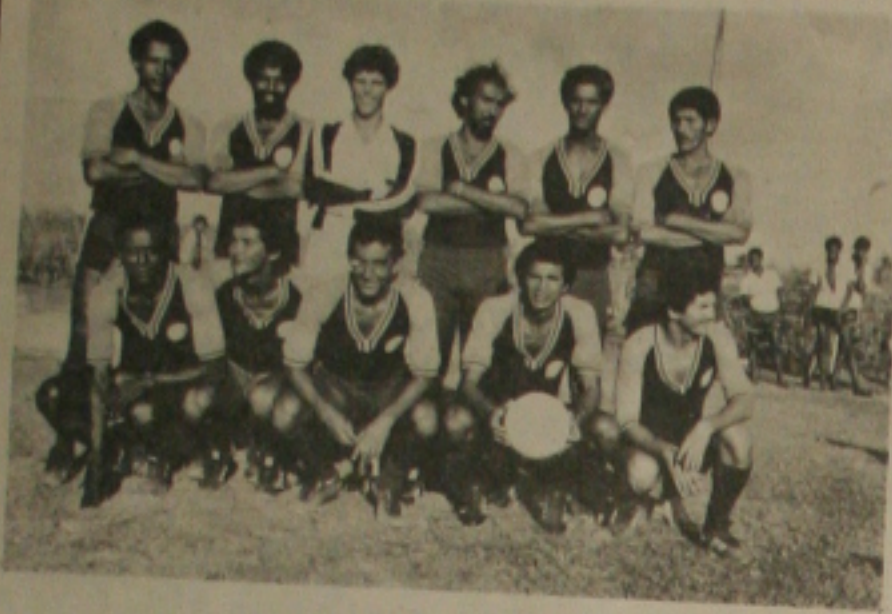
TIME DA AGAP EM AÇÃO

Quando os clubes profissionais deste Estado derem sinal verde para que os seus atletas possam entrar de férias coletivas, o time de futebol da Associação de Garantia aos Atletas Profissionais - AGAP, irá