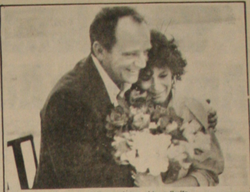
O público sergipano vai ter o direito de assistir durante três dias um espetáculo de alto nível...