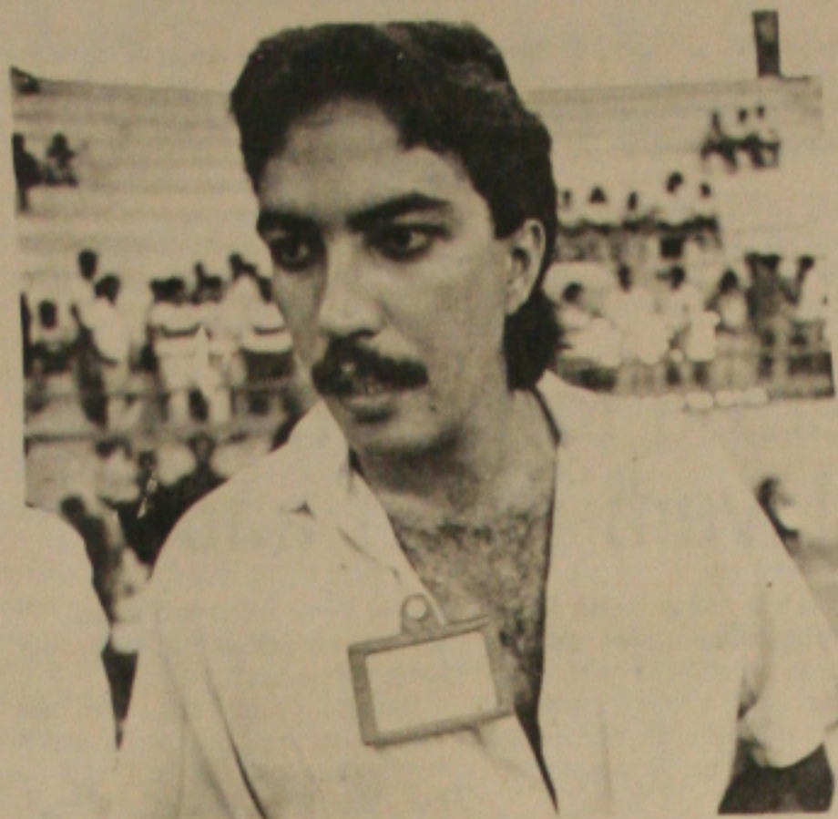
Déda ficou com os votos dos candidatos com eleitorado em Aracaju.