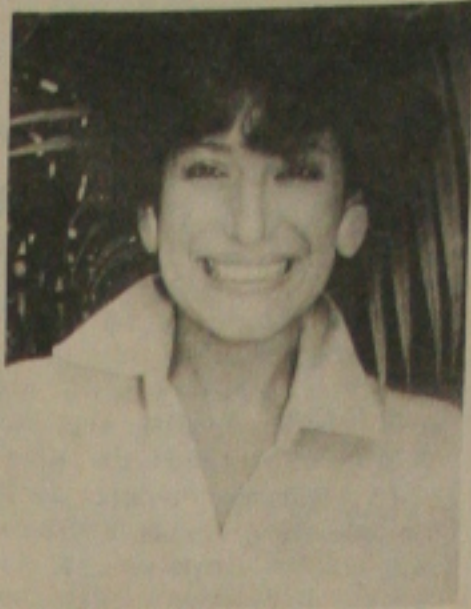
Além de ser uma mulher extraordinária, Suzana Vieira é também uma das melhores atrizes do Brasil.