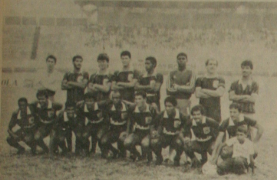
O time do Lagarto já se considera campeão e faz amanhã a festa das faixas no Paulo Barreto.

Os dirigentes do Lagarto afirmaram logo após a partida que houve um erro do juiz da partida e o Tribunal não tem nada que julgar. O Lagarto que já foi prejudicado uma vez não admite entrar de "galato" por uma segunda vez. Além do time estar correto em todo o desenrolar da partida, os dirigentes do Lagarto afirmaram que houve erro do juiz que não soube interpretar o regulamento. Segundo o dirigente do alvi-verde, o regulamento é claro e nada diz sobre o sorteio. "O regulamento determina que havendo empate no tempo normal, na prorrogação e na série de penalidades serão repetidas tantas cobran-