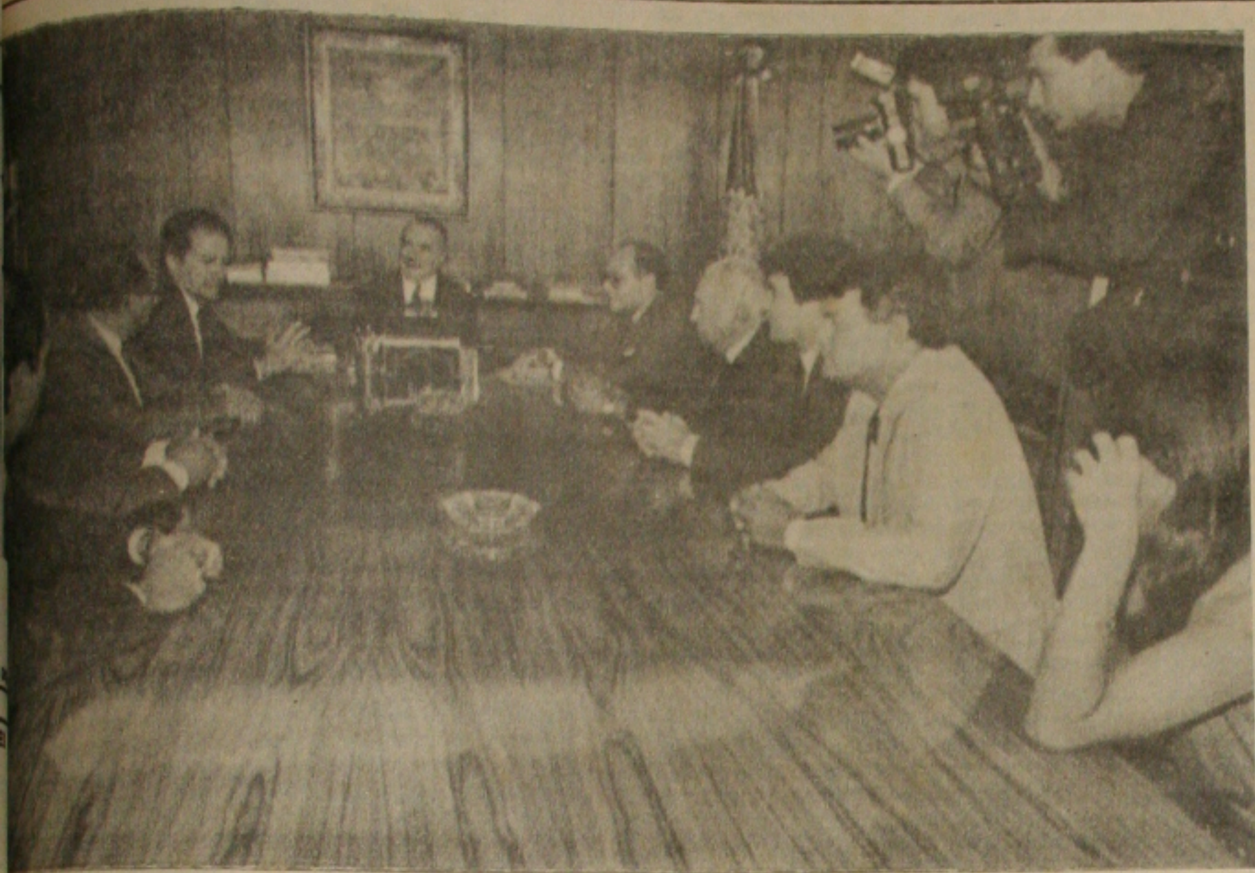
Presidente José Sarney recebe a bancada federal do PMDB eleita de Sergipe.