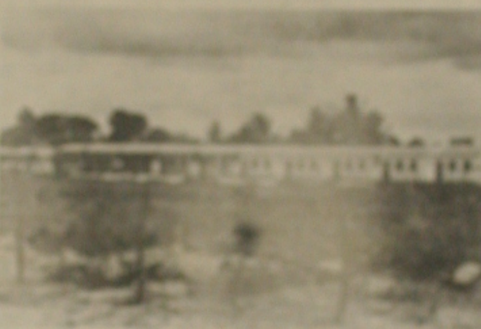
As 100 casas que serão entregues na Avenida da Baixa Fria serão entregues em dezembro.

O prefeito de Belo Horizonte, Carlos de Sá, afirmou que as 100 casas da Avenida da Baixa Fria serão entregues em dezembro. Segundo ele, as casas são modernas e confortáveis, atendendo às necessidades da população.