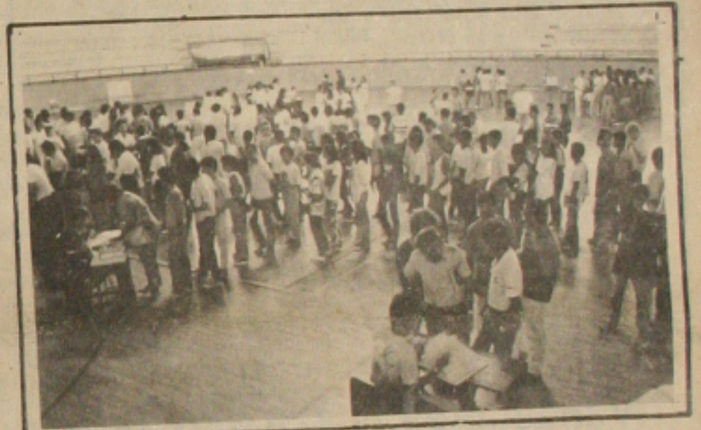
Mais de 2 mil estudantes foram ao Constâncio Vieira, receber os seus cartões do Vestibular 87.

verão ser entregues nos horários das 8h30 às 11h30 e das 14h40 às 17h30. Durante esse período passarão pelo ginásio