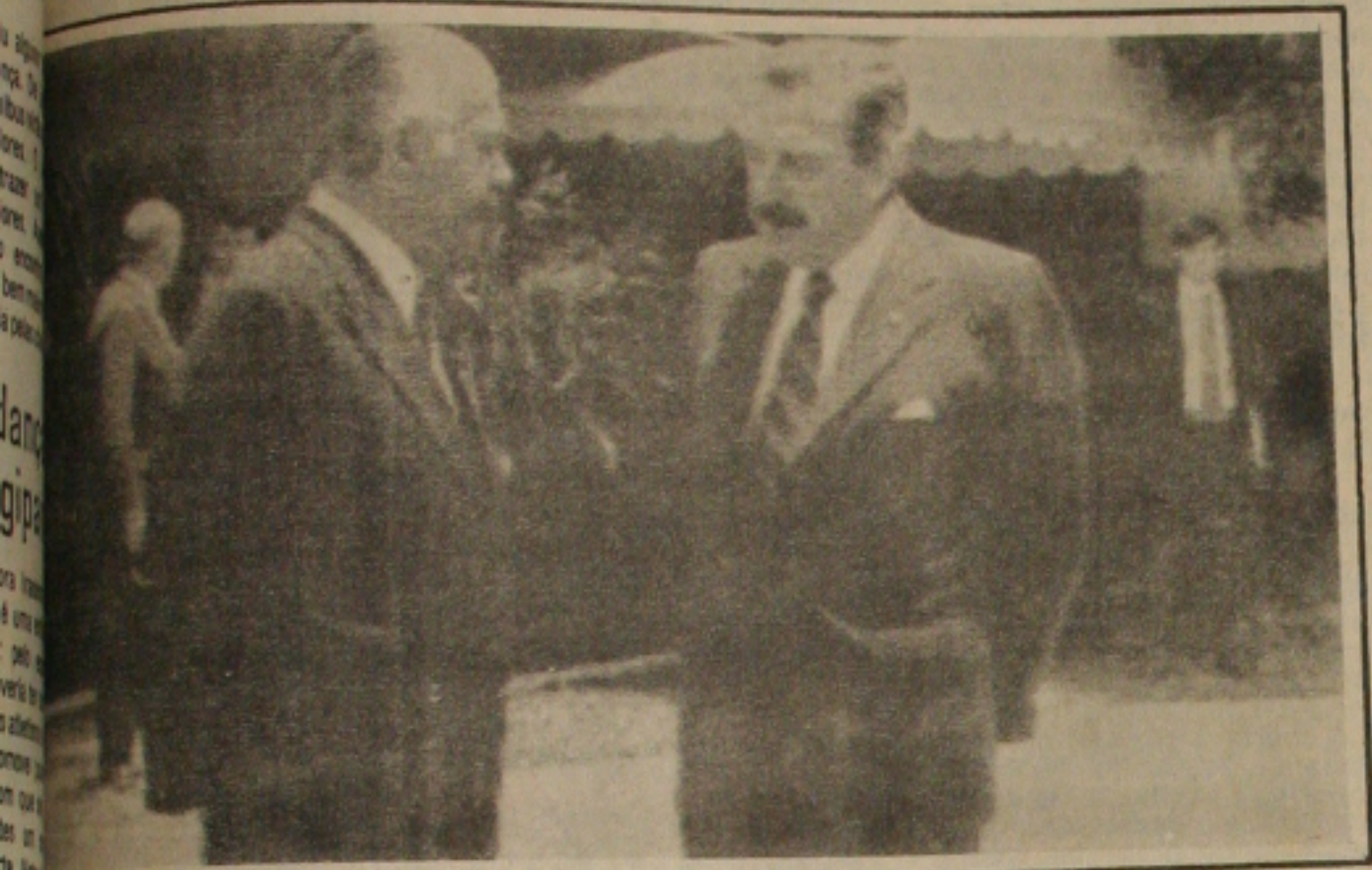
— Os Presidentes José Sarney e Raul Alfonsín conversam na sede da Embaixada Argentina onde o presidente brasileiro foi homenageado ontem com um almoço