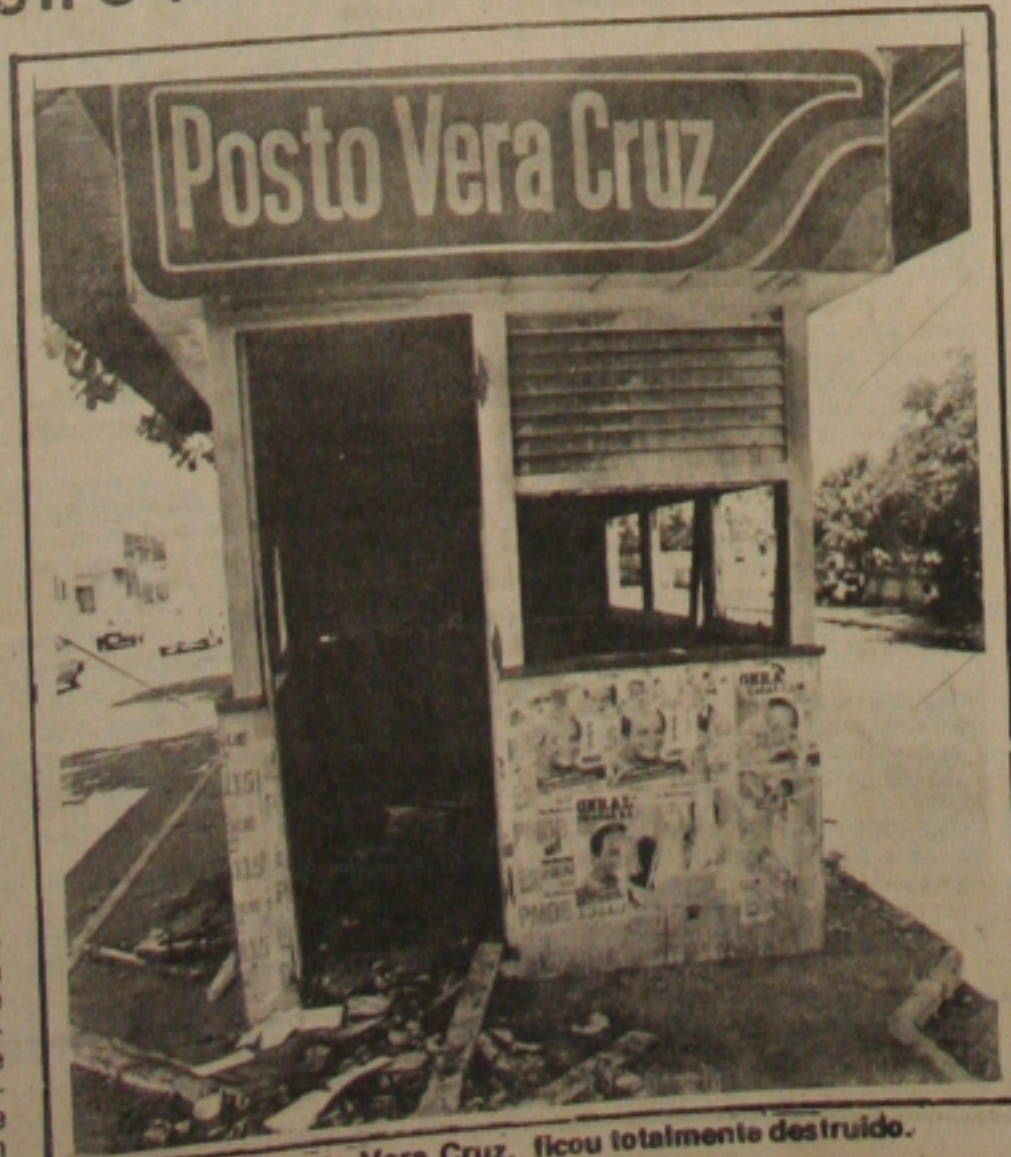
O escritório do Posto Vera Cruz, ficou totalmente destruído.

O Delegado ouvirá também os proprietários da redondeza objetivando colher informações para identificar o motoqueiro que ateu fogo no escritório do posto. "Só com a prisão dele é que se pode saber o verdadeiro motivo do incêndio do posto", disse Batinga acrescentando que tem alguns dias para investigar o caso.