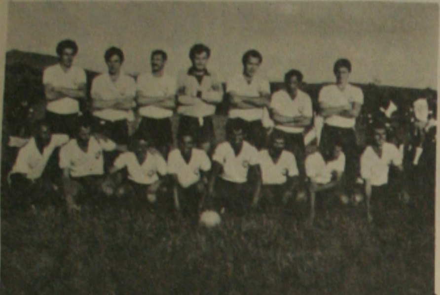
CORINTHIANS DE APARECIDA DEIXANDO