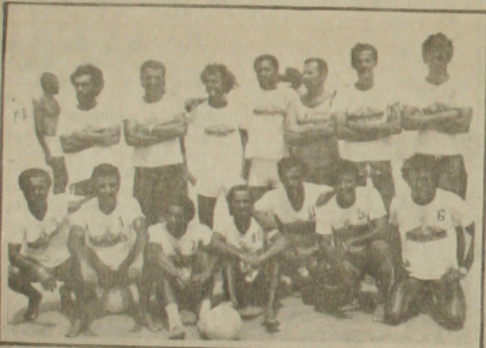
Na foto, a equipe Olímpia campeã do "I Certame Praiano do PETROCLUBE".

Tudo indica que ainda este mês, a direção de esportes do Petróleo Praia Clube, irá promover o "II Campeonato de Futebol de Praia", envolvendo equipes formadas por empregados da PETROBRAS em Sergipe e Alagoas.