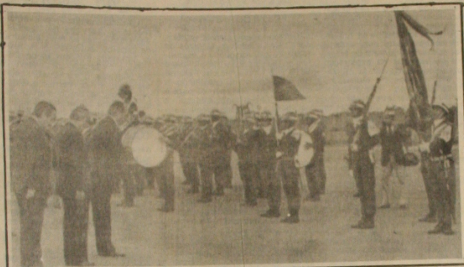
Brasília — Os Presidentes José Sarney e Raul Alfonsín acompanham o presidente uruguayo, Julio Maria Sanguinetti, recebido ontem na Base Aérea de Brasília, com honras militares.

Chefe do Governo brasileiro em Sanguinetti e Alfonsín grandes estadistas e democratas observou que, o enfoque das