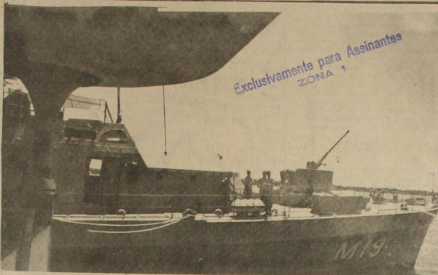
O navio Caça-Minas Abrolhos, ancorado na Ponte do Imperador, aberto a visitação pública.

Não é que São Paulo foi um fracasso. A maioria das indústrias não funcionou, e foi um grande feriado. Não se pode culpar os transportes que funcionaram, nada disso, os trabalhadores fazem greve com ou sem transportes. A produção saiu afetada.