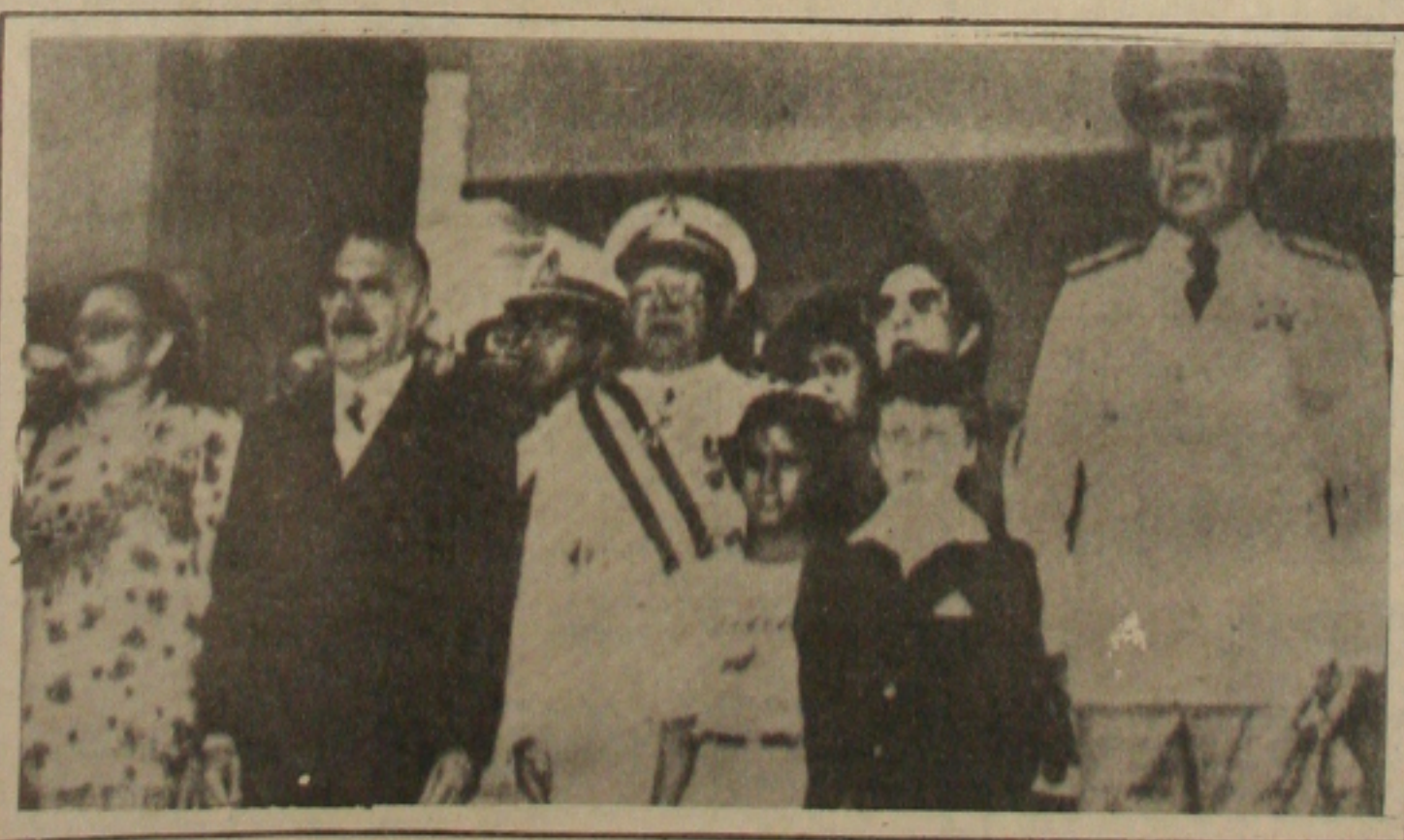
O presidente Sarney, os ministros Leônidas Pires Gonçalves e Henrique Sabóia e D. Marly, cantam o Hino Nacional durante a cerimônia de formatura dos novos guardas-Marinhas.