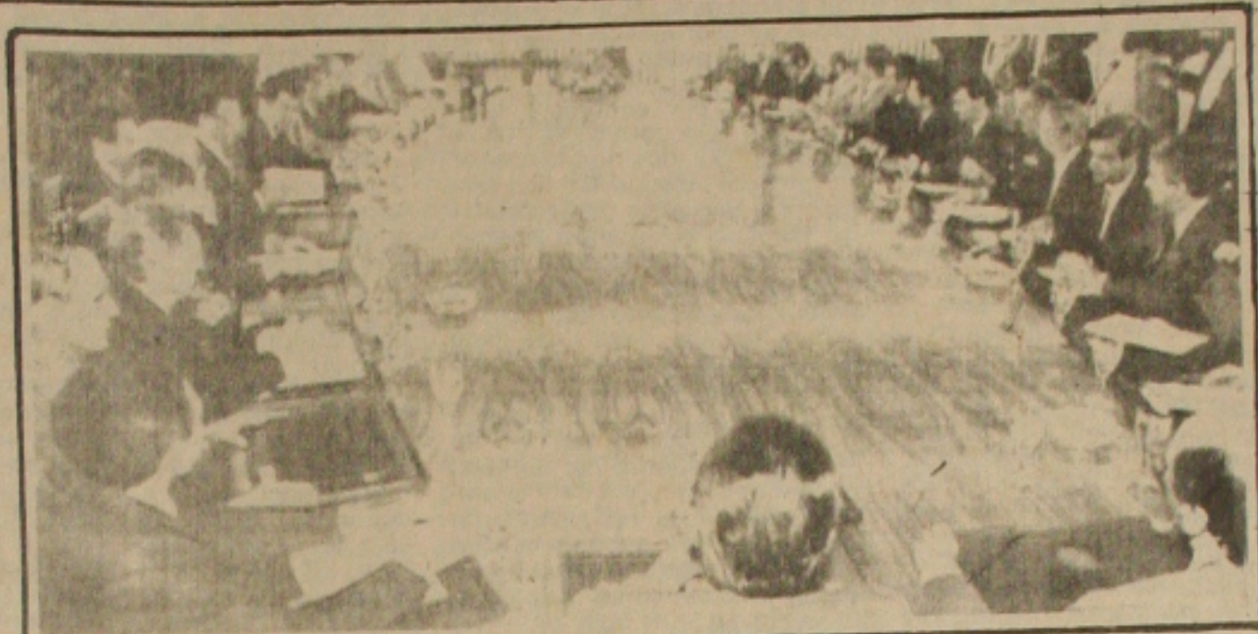
BRASILIA, 17 (EBN) - O Presidente Sarney, na reunião com todo o Ministério, disse que o Brasil não caminhará para a recessão econômica e assegurou que o Governo dispõe de instrumentos para revitalizar a economia caso ela venha a perder a vitalidade.

BRASILIA - O tema dominante da reunião de ontem entre o Presidente José Sarney, os ministros, os líderes da Aliança Democrática, o Consultor e o Procurador-Geral da República foi o pacto social. Após a reunião, o líder do PFL no Senado, Carlos Chiarelli, disse que o governo não está pensando em adotar nenhum pacote na área econômica, quer corrigir as distorções da economia através do diálogo com empresários, trabalhadores e a classe política. A conclusão a que chegaram os ministros na reunião, segundo o ministro da Cultura, Celso Furtado, é que o governo não está indo "de mãos vazias" para o Pacto. A diferença entre esse Pacto proposto pelo governo e os anteriores é que o Plano Cruzado proporcionou benefícios: aumento da oferta de emprego, de salário e de consumo.