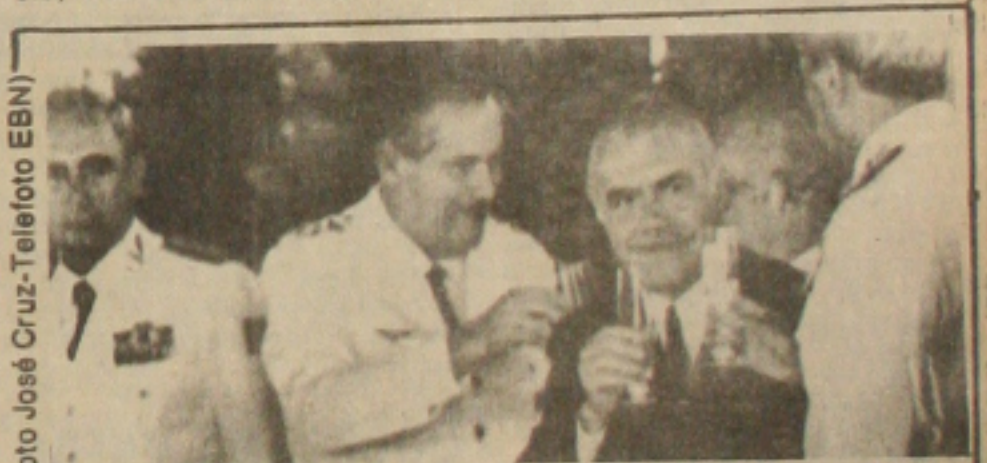
O Presidente José Sarney durante almoço que lhe foi oferecido ontem pelos Ministros militares no Clube Naval de Brasília