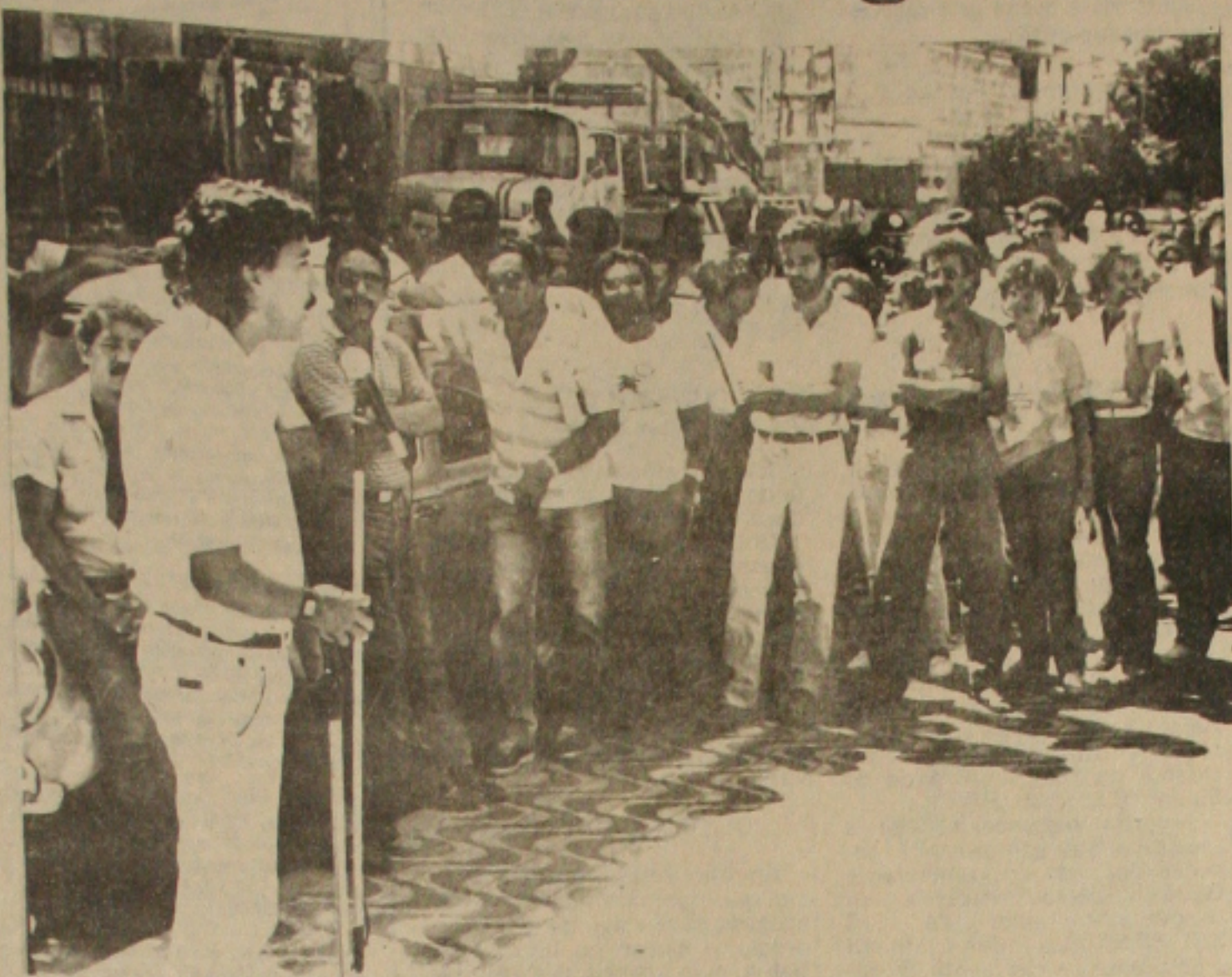
Líderes sindicais deram apoio ao movimento reivindicatório dos telefônicos.

o repouso. No entanto serão descontados os três dias de paralisação, sendo esses dois últimos e o dia 12, que os funcionários paralisaram suas atividades, na greve nacional. A empresa se comprometeu também em retirar um documento encaminhado à DRT no qual a diretoria solicitou que fosse decretado estado de greve.