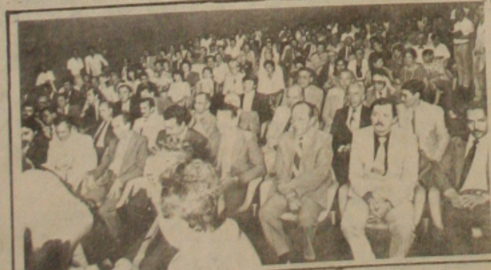
Os eleitos, durante a solenidade de posse

Já diplomados, os futuros parlamentares e Governantes, aguardarão tão somente a data da posse para os respectivos cargos.