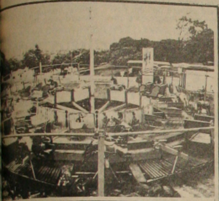
Seu Tobias com totalmente abandonado,