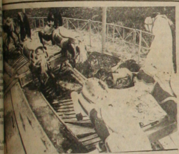
Carvalhos sem cabeça, ca deiras podres ...