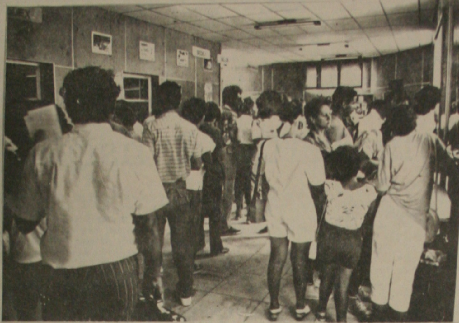
Movimento foi grande ontem na Agência Central dos Correios.

Depois de frisar que foram colocados 2 balcões: um na praça General Valadão e outro na praça Fausto Cardoso, justamente para facilitar o atendimento ao público, acrescentou que além