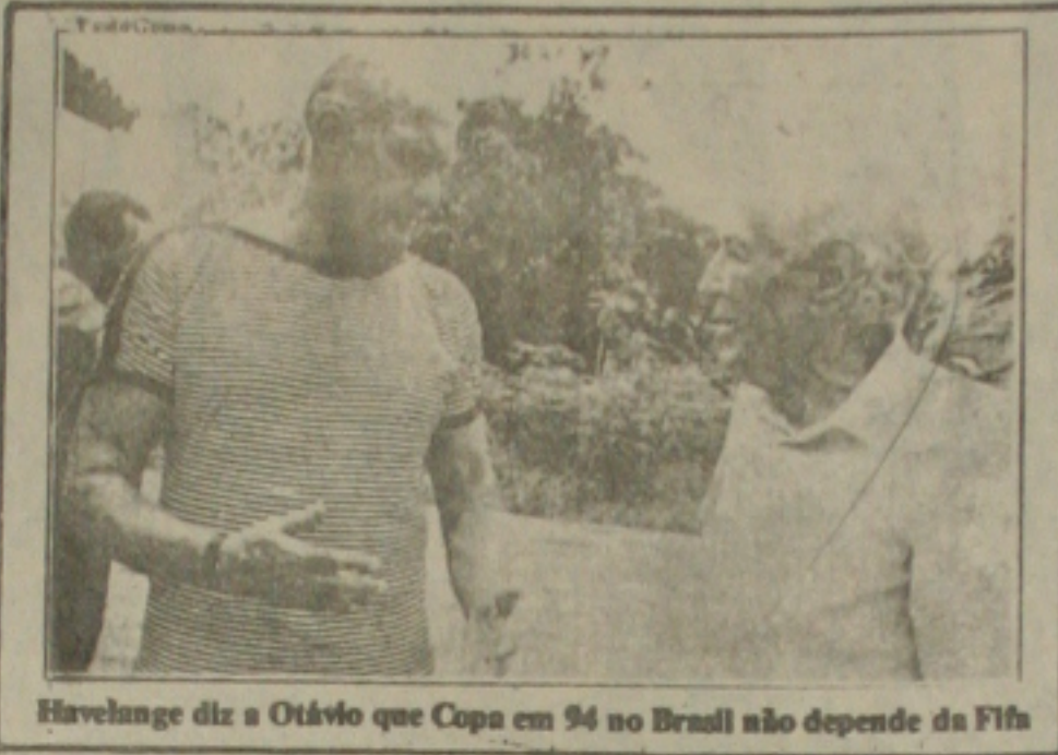
Havelange diz a Otávio que Copa em 94 no Brasil não depende da Fifa

—Para mim, a Copa de 94 será realizada no Brasil. No entanto, não depende da Fifa, mas do Governo Federal.