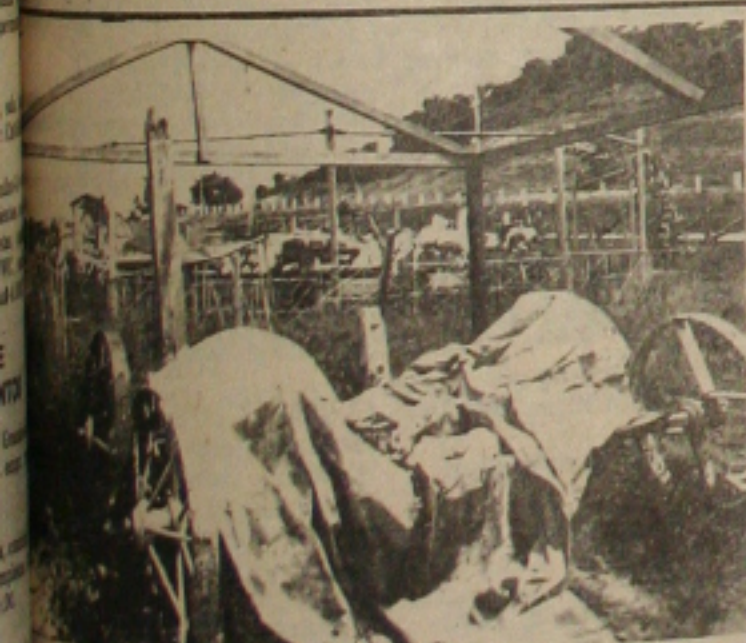
Restaurando com outras peças deterioradas do Parque

sergipano que nunca foi montado com o Carrossel de Tobias, quer seja uma de suas cadeiras de madeira, ou mesmo seus filhos, sobriamente para durante os natalinos vê as crianças divertindo ao cibandando mais tradicional neste período? O Carrossel de Tobias, na segunda metade do século passado, na In-terioridade do Estado de Sergipe, teve uma pequena parada nos Estados Unidos, no início do século que se passou em Aracaju, onde se encontram os principais detalhes da criação das cadeiras. Desde o ano de 1970, não se pode contar com o Carrossel de Tobias, sob a responsabilidade do Govern-