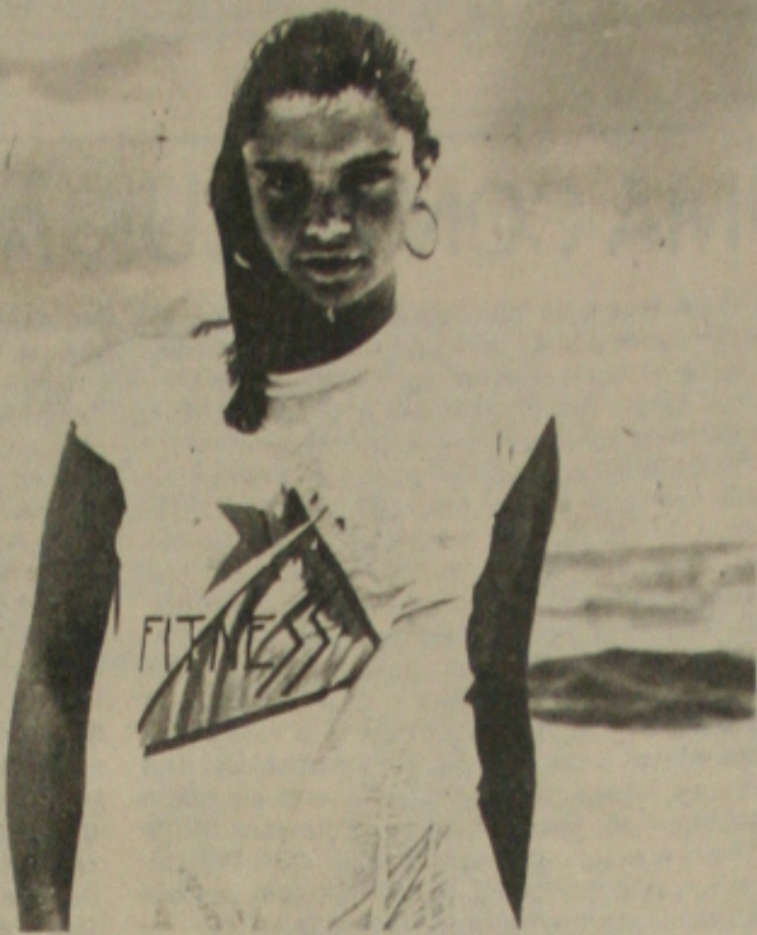
A garotinha da foto, saindo das águas da Atalaia, parece mais uma sereia que Netuno desprezou porque já não dava mais no couro... E que sereia!

as famílias demonstrassem qualquer reação. Fernando Matos disse ainda que na próxima segunda-feira vai realizar um relatório geral da situação. Ele diz que recebeu informações do Tenente Valdemar, segundo as quais, parte da área das terras invadidas, pertence ao Estado, precisamente à Secretaria de Saneamento e Recursos Hídricos, e que estava à disposição da COHIDRO. Sobre o fato dos soldados da PM expulsarem os "sem terra", sem um mandato judicial, o Secretário de Segurança Pública afirmou que a ação da polícia foi legal, pois os camponeses invadiram um local que faz parte do patrimônio alheio, e que eles ainda não estavam na posse da terra, o que só se configurará após um ano.