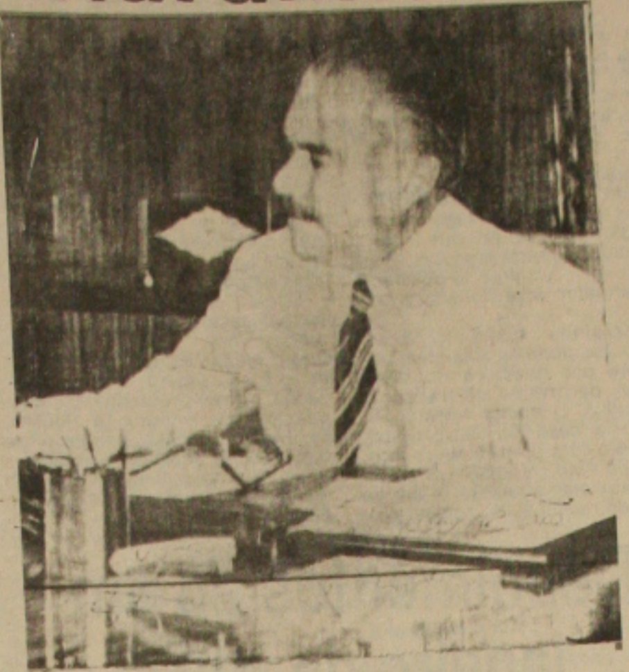
Sarney deixou as atividades oficiais para repousar em São Luís.