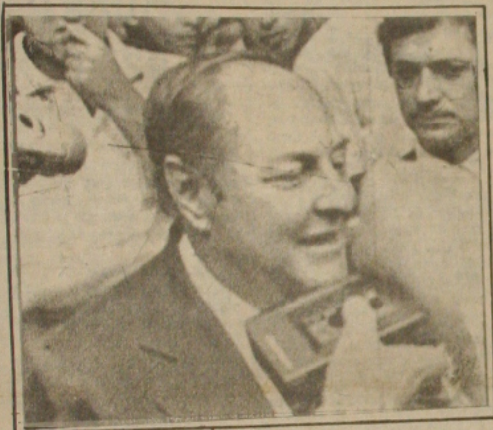
Aureliano decidirá o racionamento de energia.

BRASILIA — O racionamento de energia elétrica do Nordeste poderá ser decidido segunda-feira, quando o ministro Minas e Energia, Aureliano Chaves, se reunirá com o secretário-geral, Paulo Richer, e o diretor-geral do Departamento Nacional de Águas e Energia Elétrica (DNAEE), Getúlio Lamartine, e representantes das principais concessionárias de energia elétrica do Nordeste, para avaliar o sistema energético da região. Segundo Paulo Richer, deverão ser discutidas todas as alternativas possíveis para aumentar a produção de energia no Nordeste, que foi muito reduzida com a queda do nível das águas dos reservatórios das usinas hidrelétricas de Três Ilhas e Sobradinho, que estão operando com apenas 43% de seu nível normal, respectivamente. O secretário-geral informou que uma das propostas que será discutida e encaminhada ao presidente Aureliano Chaves é a redução da produção de alumínio em São Luís do Maranhão, que consome muita energia, e a transferência desta energia para outros condutores. Ele explicou que já estão sendo feitas diversas si-