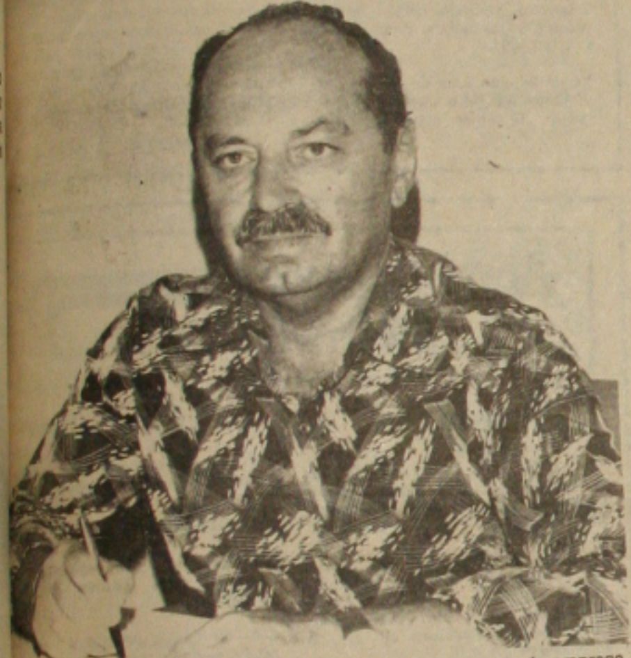
Januário não crer em desemprego.

Uma ilha, de cinco hectares de extensão e de cobertura florestal totalmente preservada com diversas espécies animais, está protegida de forças da Marinha, auxiliada por elementos do Exército e da Aeronáutica.