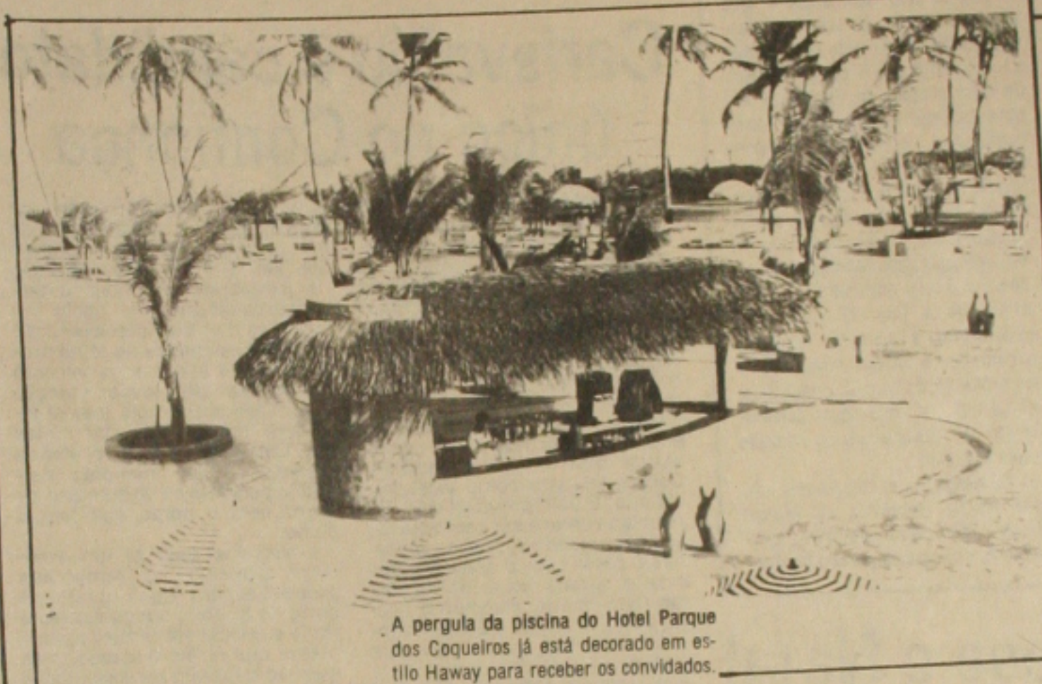
A pergula da piscina do Hotel Parque dos Coqueiros já está decorado em estilo Haway para receber os convidados. (Foto: Paulo Menezes).