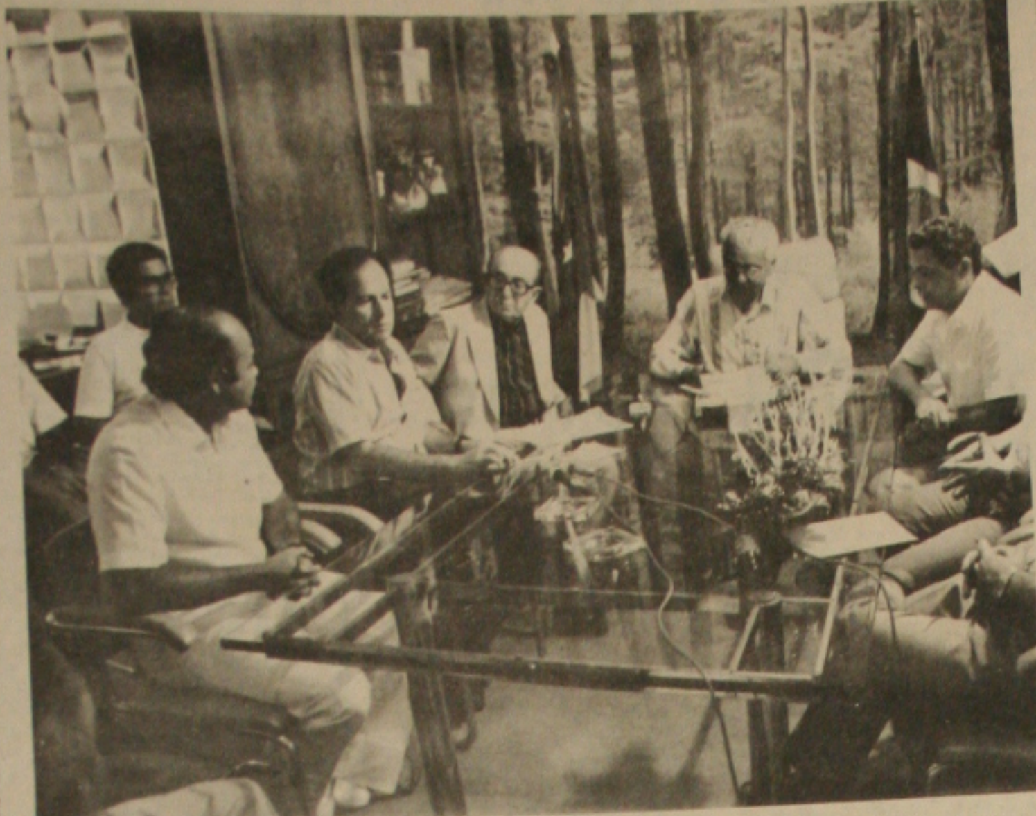
Albano Franco participou da solenidade de assinatura do convênio.