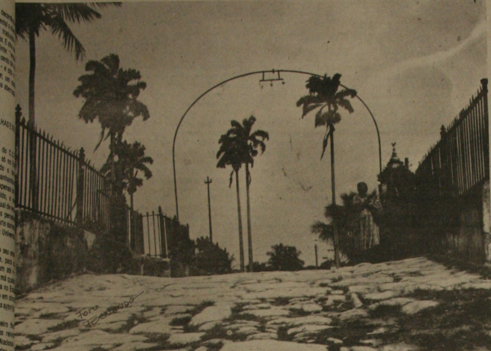
Laranjeiras, um "verdadeiro museu a céu aberto", com o seu invejável patrimônio arquitetônico de rara beleza, está em festa desde ontem.