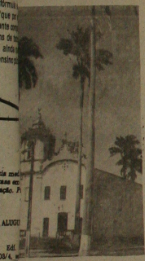
Igreja da Conceição, em Laranjeiras, cuja construção data do século XVIII, é um dos mais belos monumentos da cidade.

sa Senhora da Conceição, onde foi realizada a saudação dos Bacamarteiros da cidade de Carmópolis.