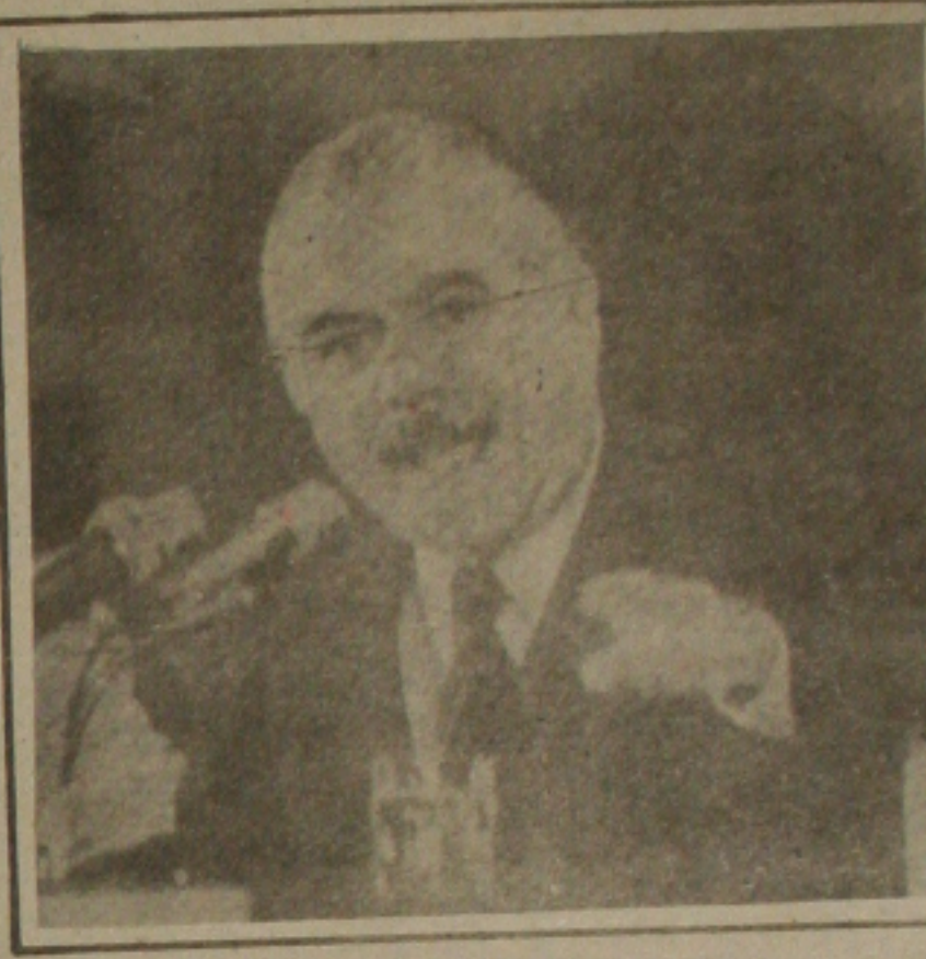
Sarney acusou empresários de anarquistas

BRASÍLIA — O Presidente José Sarney acusou ontem dirigentes empresariais de anarquistas e aliados de Bakunin, porque "num momento em que se procura consolidar o estado de direito no Brasil e o regime da lei, eles pregam a desobediência civil", e advertiu, também, que ninguém vai desestabilizar o governo. As críticas do presidente foram feitas durante o primeiro programa semanal deste ano "Conversa ao pé do rádio", no qual Sarney, em linhas gerais, destaca as realizações do governo e condena o pessimismo e o desânimo. — Para que se verifique o estado de exaltação a que chegou esse estado de espírito, basta ver que dirigentes empresariais, num momento em que se procura consolidar o estado de direito no Brasil, o regime da lei, prega a desobediência civil e a anarquia, e passam a ser aliados daquela coisa do século passado, que é Bakunin - afirma o presidente. Mais adiante, Sarney elogia os trabalhadores: "eu acho que mais paciência tem tido os trabalhadores brasileiros, o povo pobre e sofrido que aguenta os índices de miséria absoluta, este sim que constitui o verdadeiro problema e a vergonha nacional. Mas, em vez de