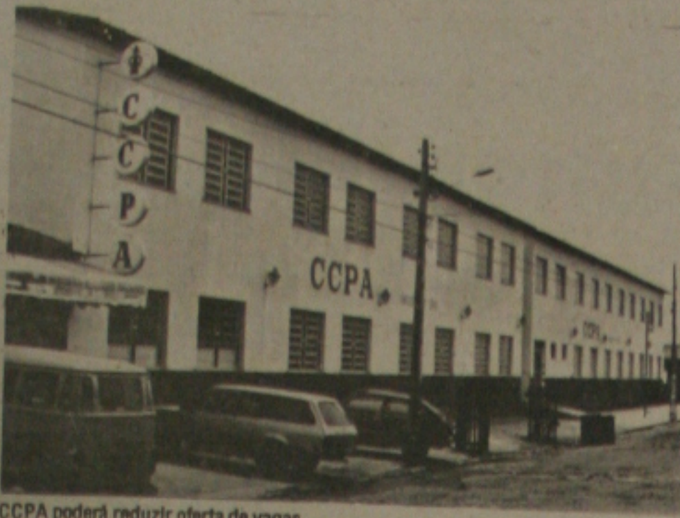
CCPA poderá reduzir oferta de vagas.