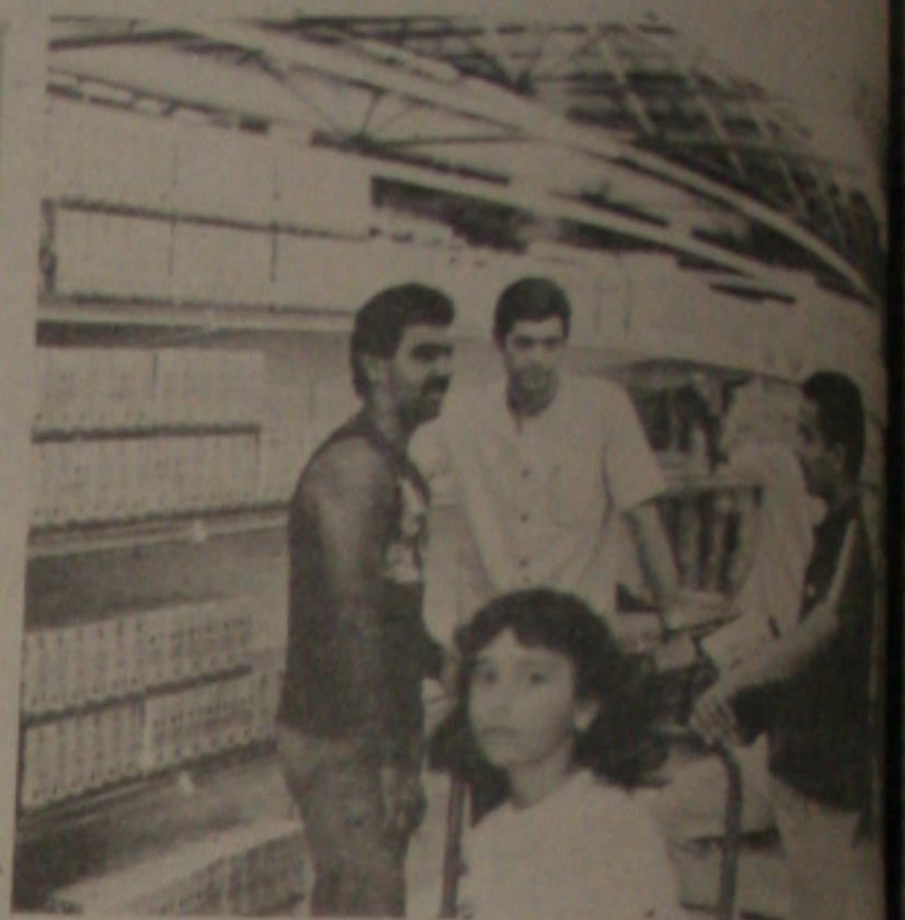
Nas prateleiras o leite europeu foi substituído por leite local.