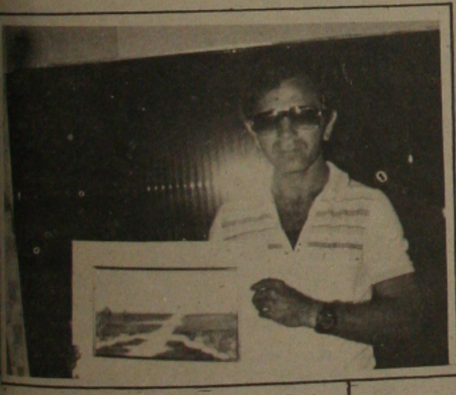
ZITO um artista plástico de mão cheia que no próximo dia 16, mostra o seu trabalho de arte na Galeria Álvaro Santos.