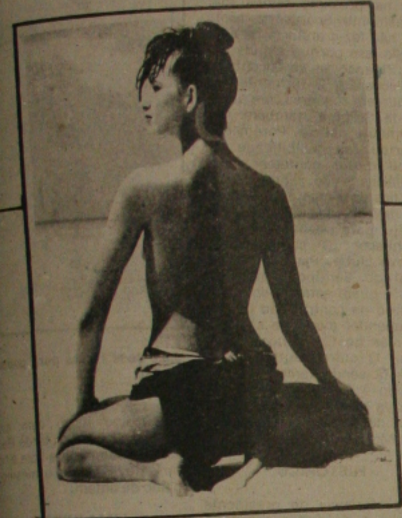
Bronzeado uniforme só se consegue utilizando bronzeadores com filtro solar e expondo o corpo ao sol em horário adequado.