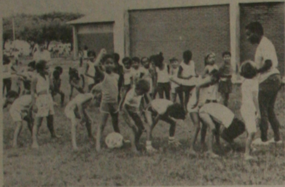
NAEL MOVIMENTA PMA