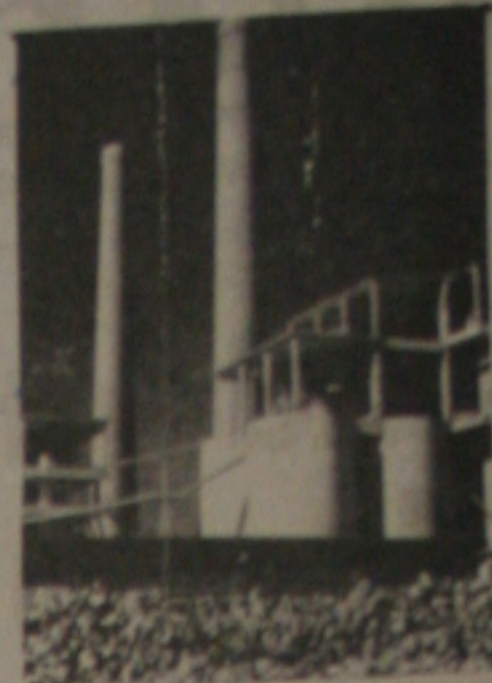
Chaminés da Portland podem voltar a poluir o Siqueira Campos.

uma unidade do mesmo grupo localizada em Larangeiras. Agora, com a grande possibilidade de mais uma produtora vir à tona, a empresa requererá a aprovação dos seus fôrnos.