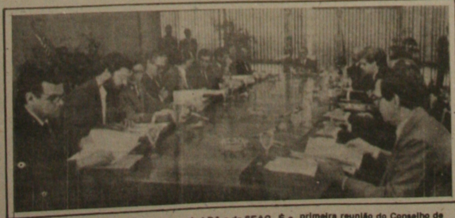
O Presidente, 16 Ministros e os titulares da LBA e da SEAG. É a primeira reunião do Conselho de Desenvolvimento Social no governo Sarney.

e que é preciso maior participação da comunidade. O Ministro disse que não se tratou da