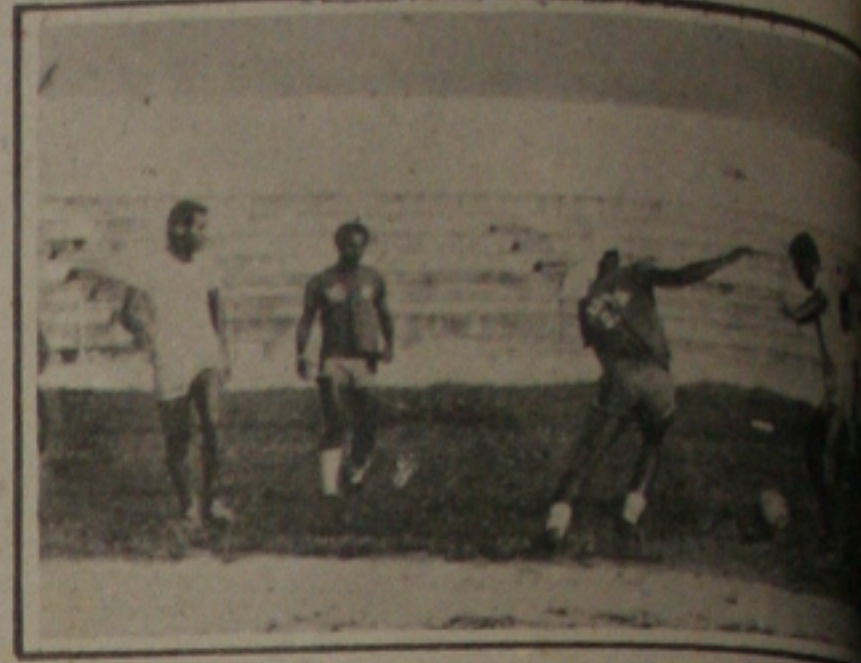
Time do Sergipe saturado de treinos quer amistosos.