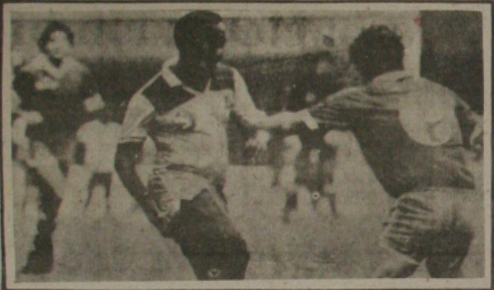
Edu recebe sempre o combate dos argentinos

SAO PAULO - O futebol argentino atravessa uma fase de grandes conquistas. Depois de ganhar tudo o que disputou em 1986, o Mundial do México, o Mundial Inter-Clubes e a Taça Libertadores da América, além do Campeonato Sul-Americano extra de seleções, começou 1987 conquistando o Primeiro Campeonato Mundial de Futebol Seniores - Copa Pelé, ao derrotar a Seleção Brasileira dentro de casa, por 1 a 0, na decisão de anteontem à tarde, no Estádio do Pacaembu, com gol de Feldman.