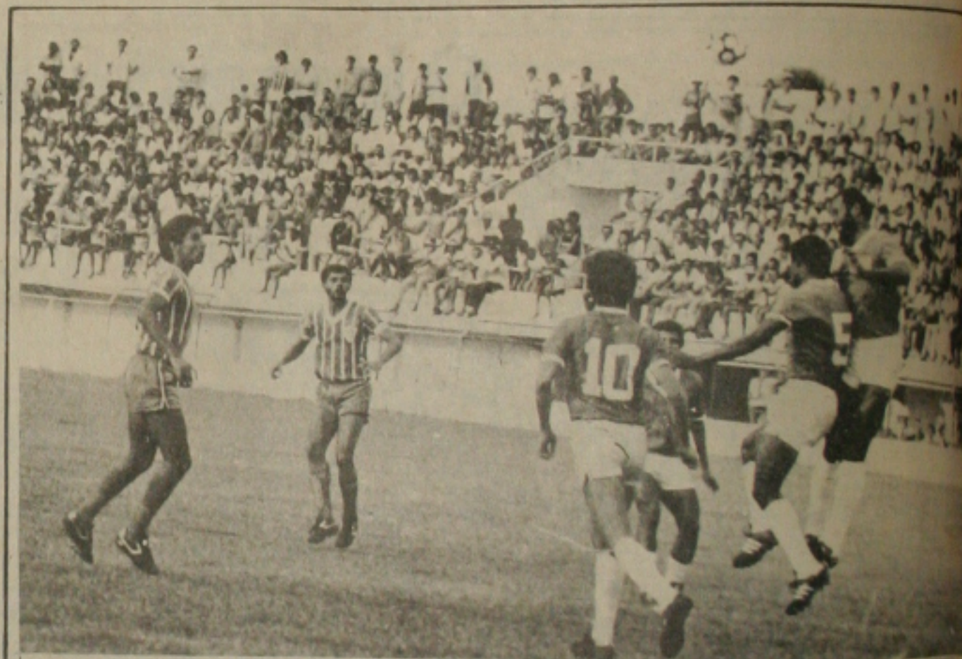
Itabaiana reagiu e a defesa rubra segurou. O quanto pode.