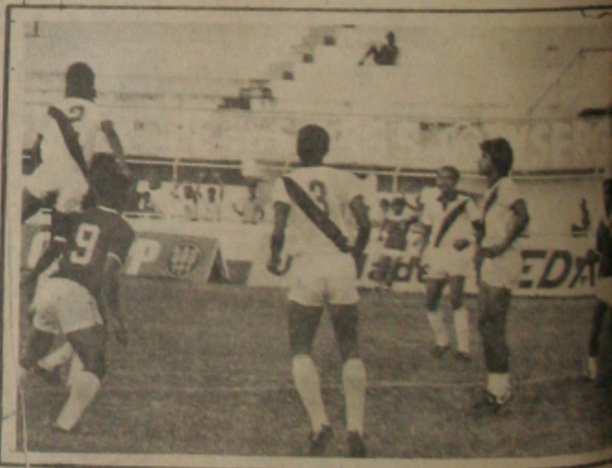
O Vasco foi duro na defesa e eficiente no ataque. Só podia vencer.