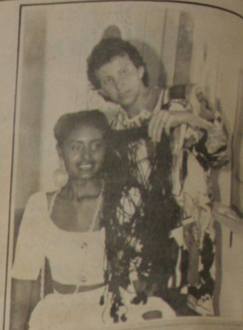
Isabel uma bonita morena sen do produzida por Marcus Rafael.

Como hoje é 31 de março, a data recorda em muita gente a Revolução de 1964. Só nos resta passar o dia com a purga atrás da orelha aguardando chegar a quarta-feira.