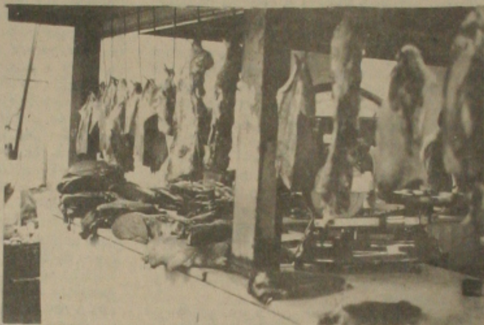
A carne está em abundância face aos elevados preços do produto

A carne bovina e outros tipos como charque e de porco estão sobrando nas bancas do Mercado Thales Ferraz em Aracaju. Segundo informações dos marchantes no ramo o produto está em abundância face aos elevados custos do produto que varia de CZ$ 75,00 a CZ$ 80,00 como também como consequência da proximidade da Semana Santa época em que o consumo de pescado aumenta.