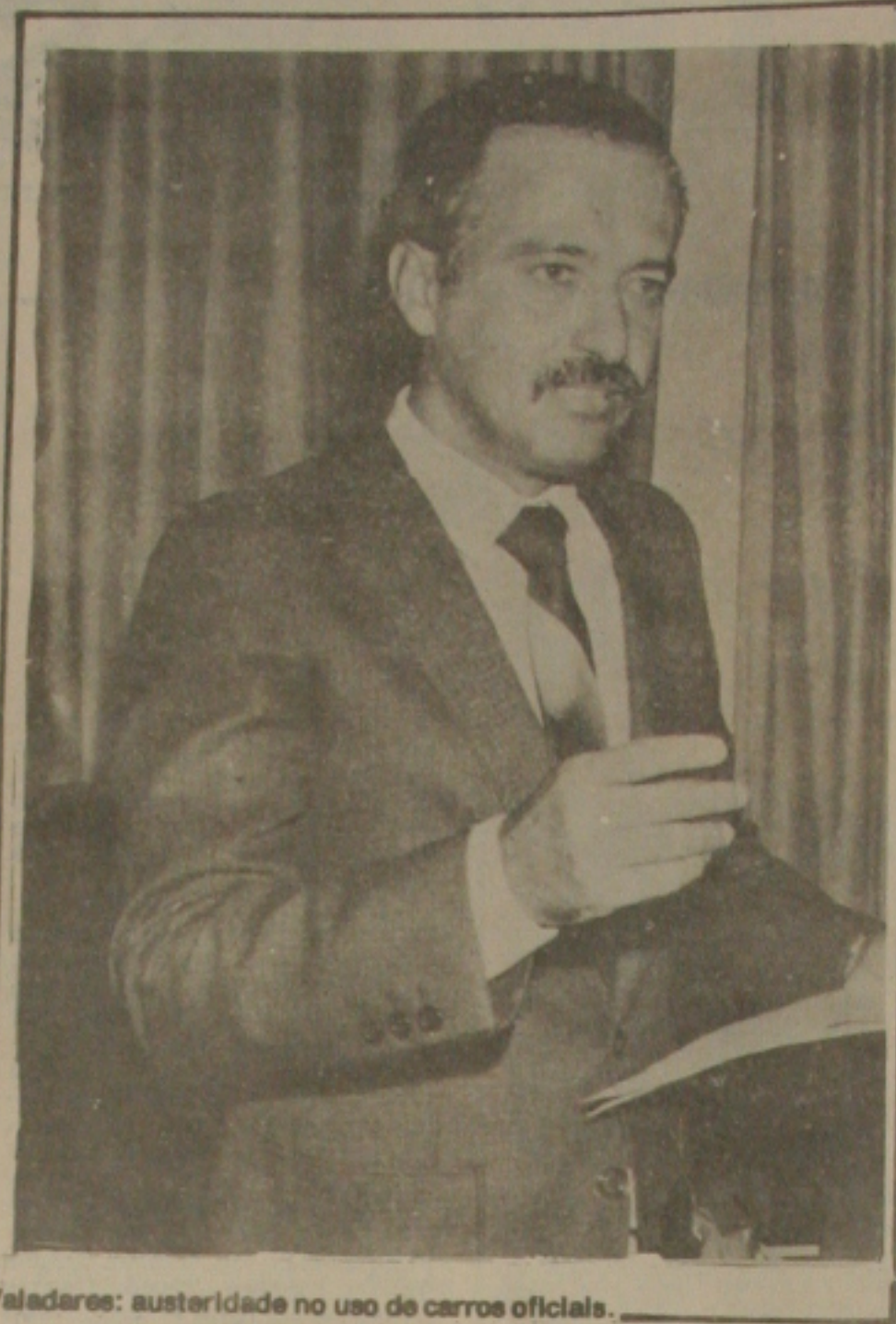
Valadares: austeridade no uso de carros oficiais.

Este decreto obedeceu a uma determinação do governador Antônio Carlos Valadares e se enquadra no seu rigoroso programa de contenção de despesas.