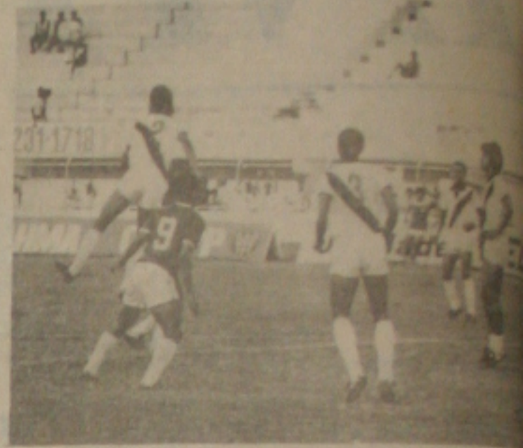
Vascaínos vão lutar pela vitória