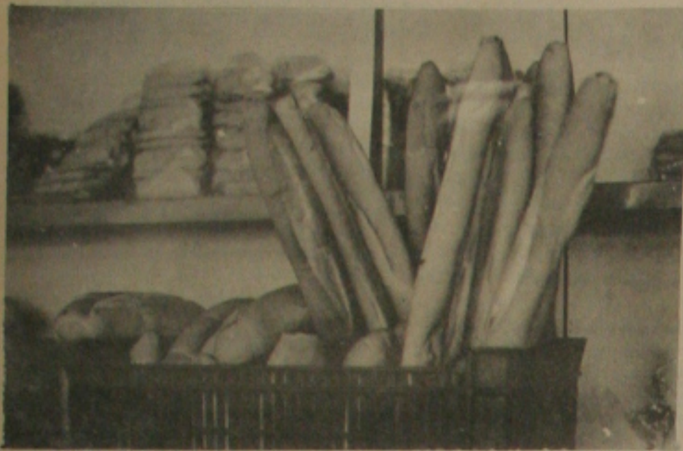
Apesar do aumento o pão continua sendo produto de primeira necessidade.