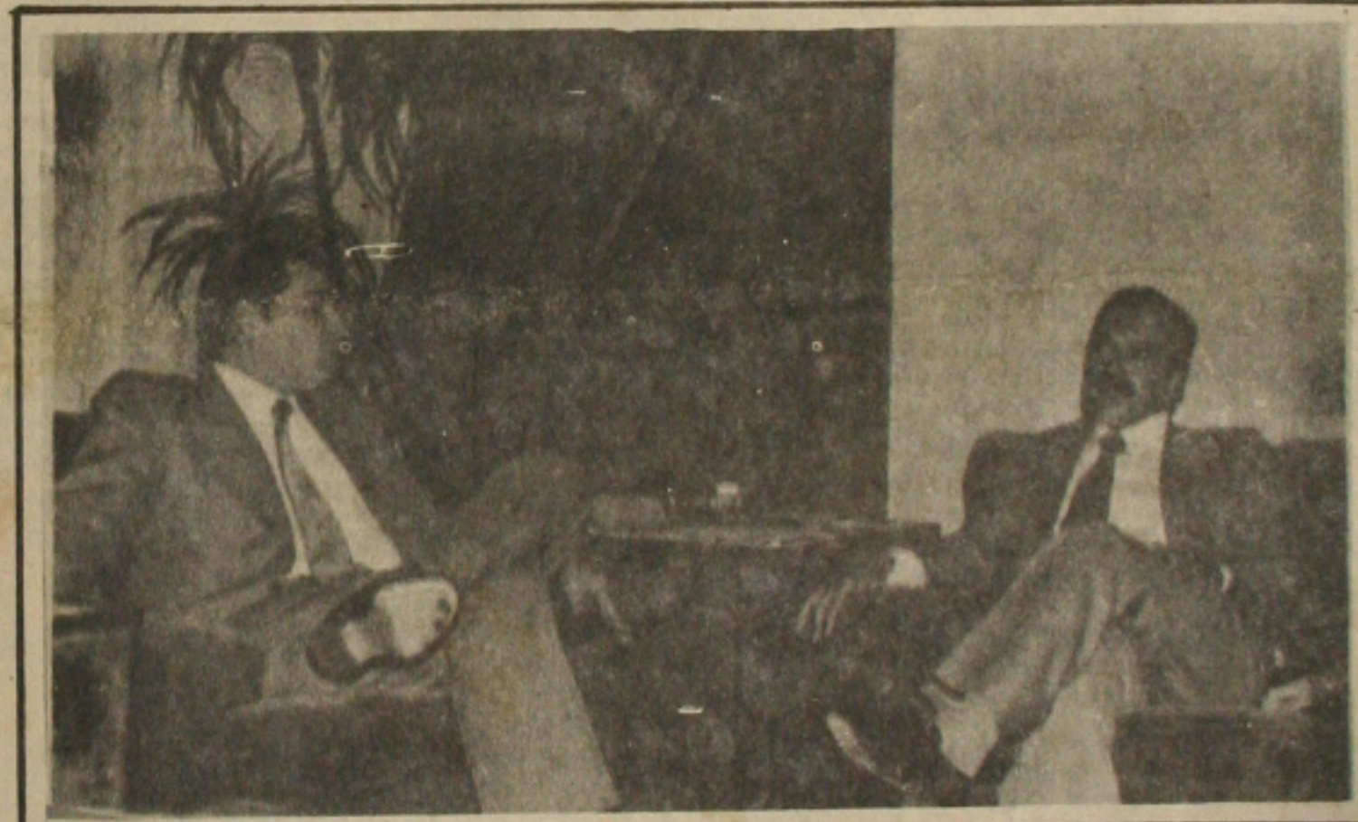
O Governador Antônio Carlos Valadares, sendo recebido pelo Ministro do Interior, Joaquim Francisco Cavalcanti.

A previsão inicial, segundo o Governador, é a liberação por parte do Ministério do Interior, conforme ele ressaltou, serão suficientes para o atendimento aos desabrigados; mas o governo do estado terá que continuar mantendo negociações junto ao governo federal, no sentido de obter novos recursos, principalmente para a recuperação da infraestrutura viária de Aracaju e São Cristóvão, bastante danificada pelas chuvas.