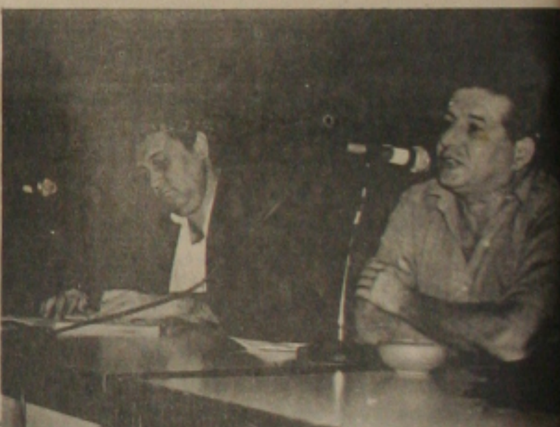
Presidente da Emsetur defende criação de Museu.