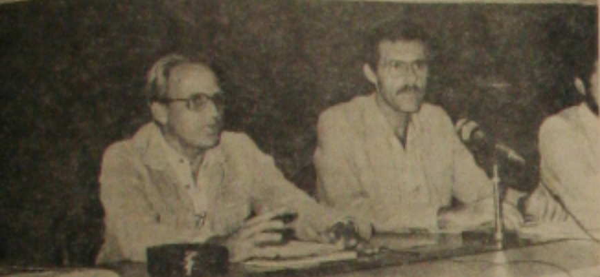
Pessoa fala sobre quadro econômico.

ENCONTRO ESTADUAL DE ECONOMISTAS E ESTUDANTES DE ECONOMIA DA ECONOMIA. Promoção: CORECON-16ª REGIÃO Apoio: GOVERNO DO ESTADO DE SERGIPE, CODISE / CERJ / SEPLAN-SE / BAWESE