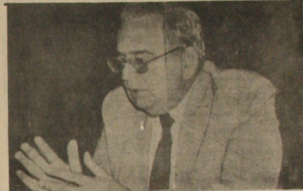
Presidente do Banco do Brasil Camilo Calazans determina a reativação da linha de crédito,

O Banco do Brasil liberou as micro, pequenas e médias empresas montante superior a CZ$ 10 bilhões nos últimos três meses, para cumprir o plano de saneamento financeiro dessas empresas, regulamentado pela resolução 1.335 do Banco Central e atender outras necessidades, através de linha de crédito do próprio Banco - asspeme (Resolução 695).