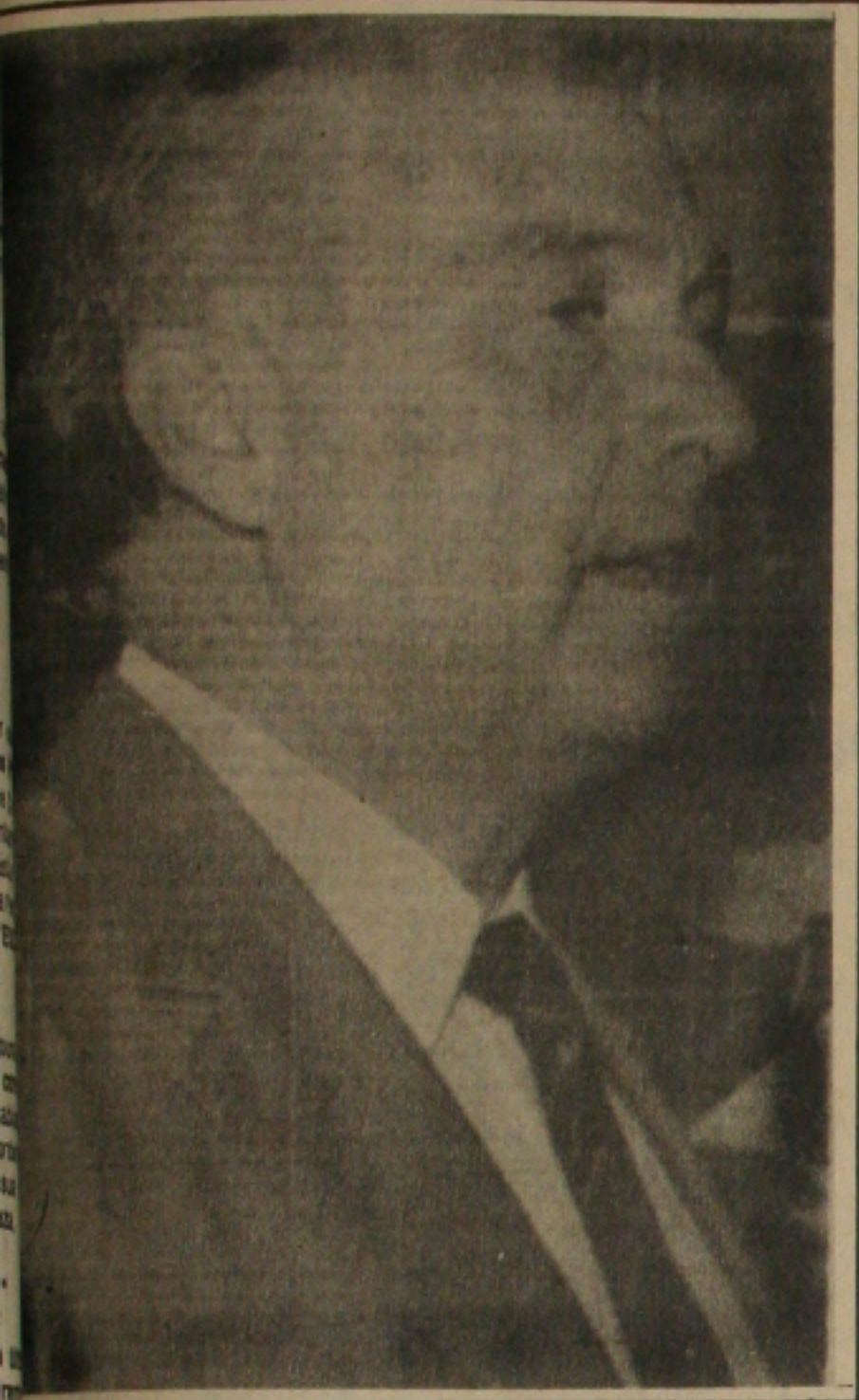
Ministro Bresser Pereira, entregou o Plano Macroeconômico ao Presidente Sarney.