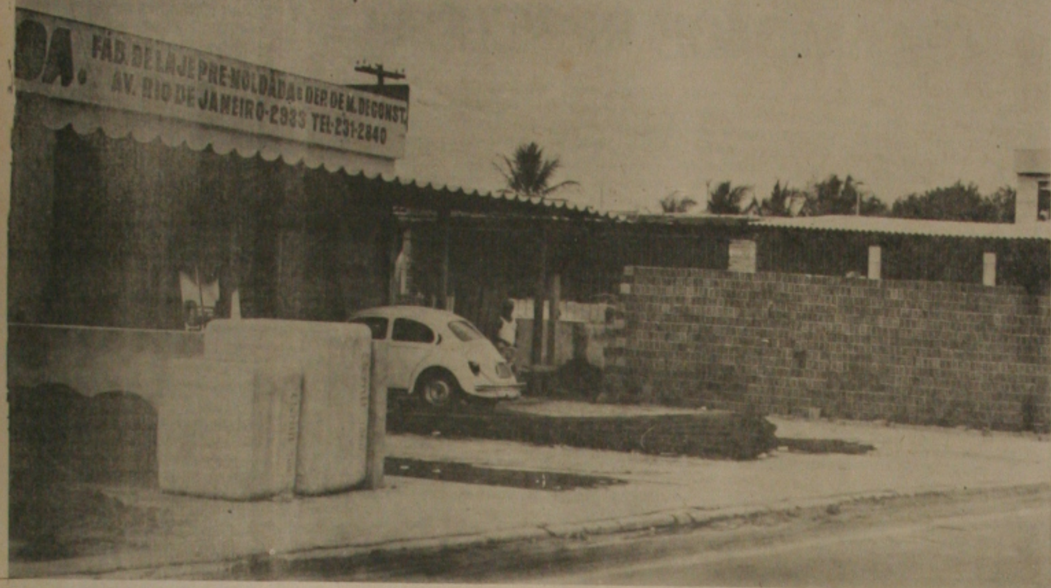
Vendas de material de construção estão quase paralisadas.