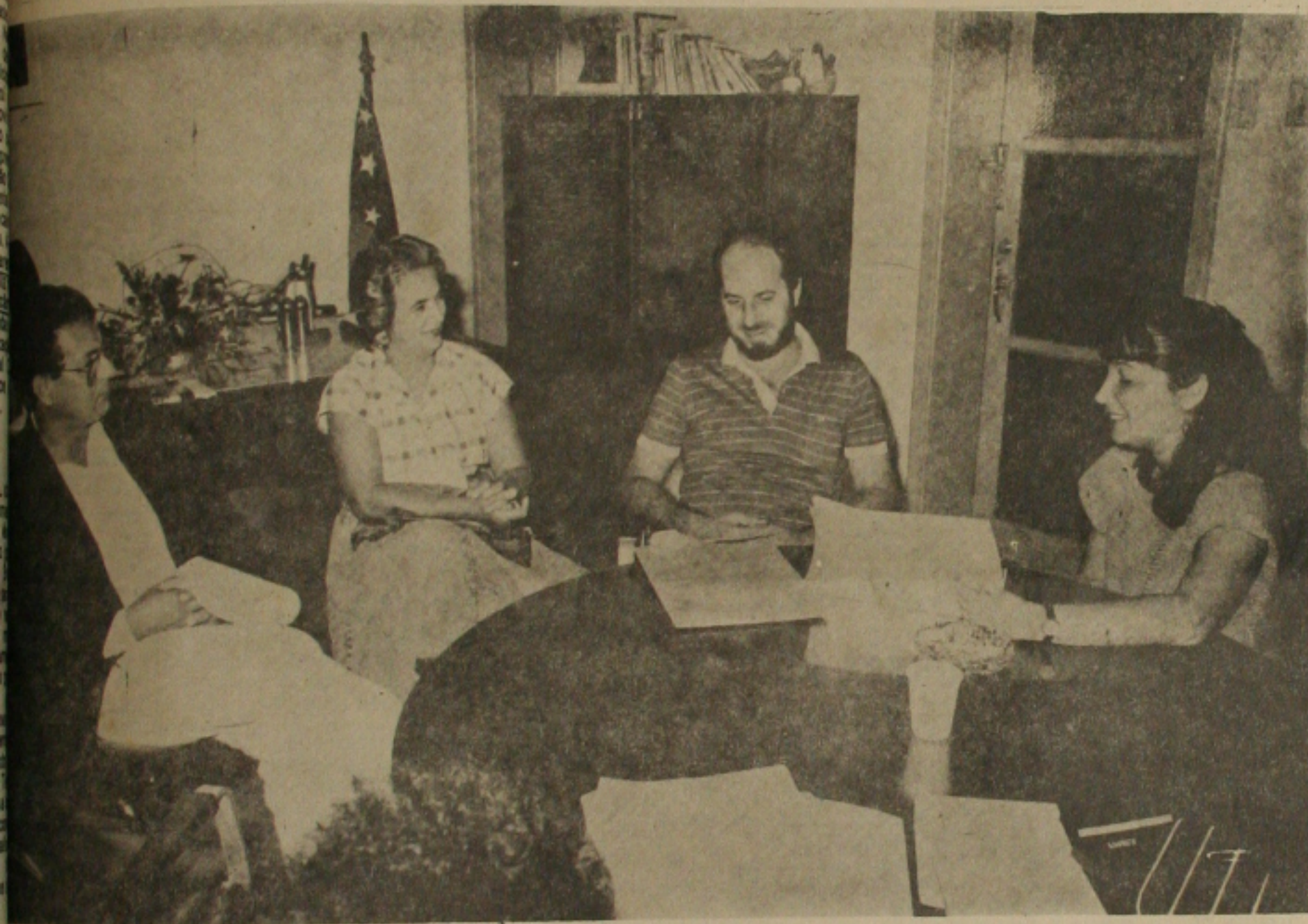
lançamento do comitê.