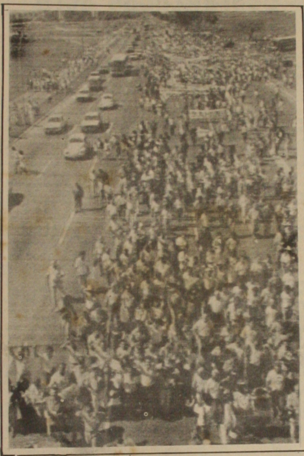
Brasília - Na Esplanada dos Ministérios a UDR realizou passeata.

Segundo Calado, a classe produtora rural estava representada ali não somente pelos latifundiários, e pequenos, e médios produtores, mas também por empregados e representantes de federações e associações do comércio e da indústria associações de mulheres executivas, que se uniram ao protesto, "preocupados com o alto grau de estatização do país".