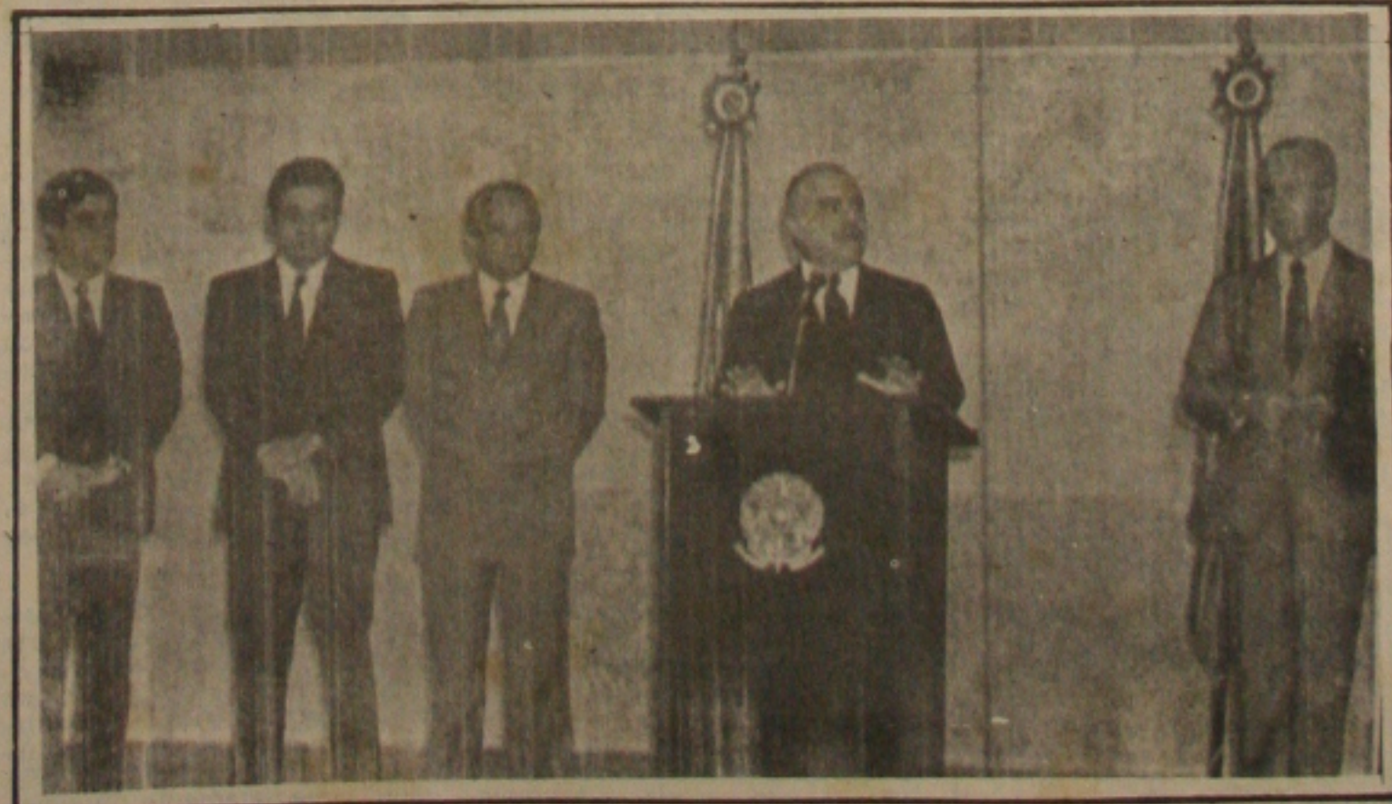
Brasília - Presidente José Sarney discursa na solenidade de sanção da lei que isenta de pagarem IPI na compra de carros a álcool

de seu grande destino". Sarney referiu-se aos pioneiros do desenvolvimento brasileiro para reforçar seu apelo de combate ao pessimismo. Nesse trecho do discurso, ele afirmou que "maiores dificuldades atravessaram aqueles que nos legaram o Brasil de hoje, aqueles que viram o Brasil sem estradas, aqueles que viram as nossas cidades sem ruas transitáveis, aqueles que não viram o Brasil cortado de Norte a Sul com as vias de transporte modernas, que tem".