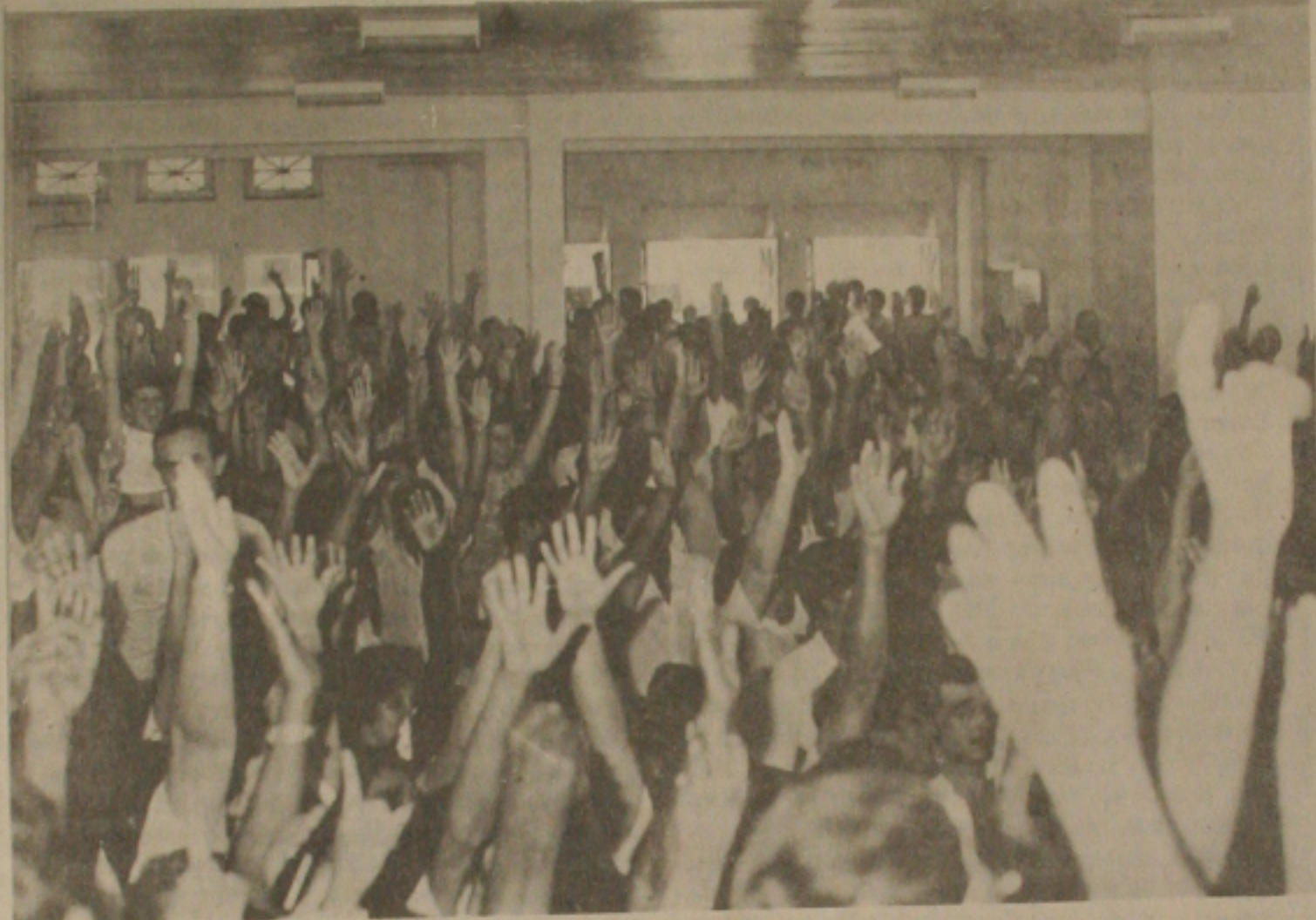
Os servidores da Prefeitura de Aracaju decidiram pela paralisação da greve.

O prefeito Jackson Barreto com uma proposta avançada aos funcionários da Prefeitura Municipal de Aracaju afastou a hipótese de uma greve geral por parte dos servidores do Município. Ontem, em assembléia geral realizada no Instituto Histórico e Geográfico de Sergipe, os funcionários aceitaram a proposta de Jackson Barreto e resolveram suspender o movimento grevista, retornando às atividades normais.