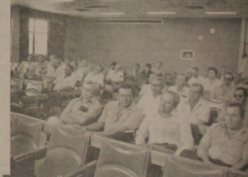
Foi realizado ontem, às 10:30 hs, no auditório do Banese, assinatura de convênio de fiscalização de preços entre a Sunab e as Prefeituras Municipais do Estado.

A reunião contou com a presença do Superintendente Nacional de Abastecimento, Celsius Antonio Lodder, do Governador do Estado, Antonio Carlos Valadares, a delegada regional da Sunab, Lygia Maynard e todos os Prefeitos Municipais.