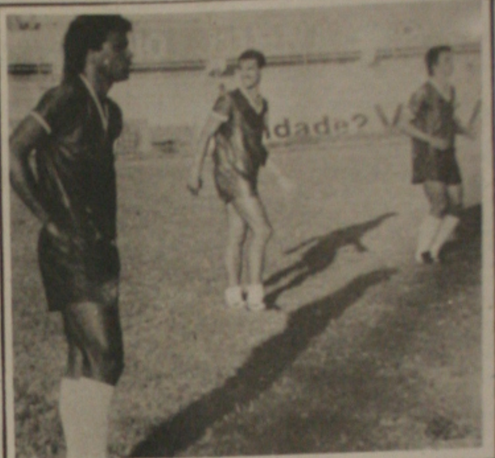
Carlos Alberto enfrentará o Santa Cruz.

O jogo segundo Ribeiro Neto será muito difícil catimbado e acima de tudo serão todos torcendo contra o Confiância e isso deve dar muita moral ao adversário. "Mas estamos preparados para essas dificuldades. Vencemos o CSM debaixo de lama, torcida e muita pressão. Porque não haveremos também de vencer o Santa Cruz? Respeito-o como o grande adversário. Mas acredito muito mais no time do Confiância". Os proletários têm o time do Santa na bronca, isso porque o treinador Verissi-