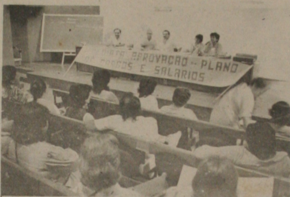
Na assembleia de ontem, os servidores da Emater/Se decidiram pela realização do ato público de hoje.

Ele salientou que há muito tempo os servidores estão querendo entrar em greve, mas esta havia sido suspensa a pedido do Governo do Estado devido as negociações feitas anteriormente. "O que estamos querendo agora é o cumprimento das negociações feitas, pois apesar de termos perdido muito quando negociadas as nossas reivindicações não houve o cumprimento do Governador para com elas. E como não conseguimos ainda uma audiência com o Governador, pois