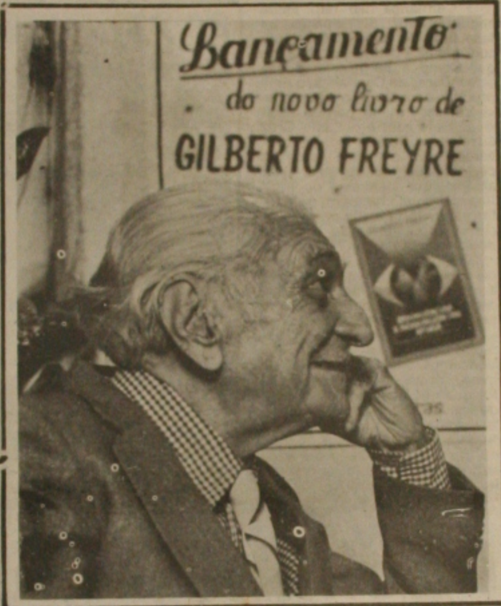
Sociólogo e escritor Gilberto Freyre.

RECIFE - O escritor pernambucano Gilberto Freyre, 87 anos, está internado desde domingo último na Unidade de Terapia Intensiva do Instituto do Coração do Hospital Português desta capital. Ele foi acometido de uma isquemia cerebral que atingiu o hemisfério direito do seu cérebro. Em fevereiro passado outra isquemia comprometeu o hemisfério esquerdo.