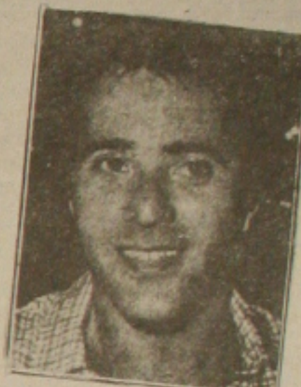
Tony Ramos substitui Fábio Jr.

Fábio Jr. que tinha seu nome certo no elenco da minissérie AEIO Urca, que a Globo bota em sua programação de sexta-feira ainda este semestre, teve que ser substituído por Tony Ramos, pois o seu estado de saúde não lhe permite grandes esforços físicos e emocionais. Tony que vinha sendo sondado pela Manchete, por enquanto ficará impossibilitado de qualquer transação.