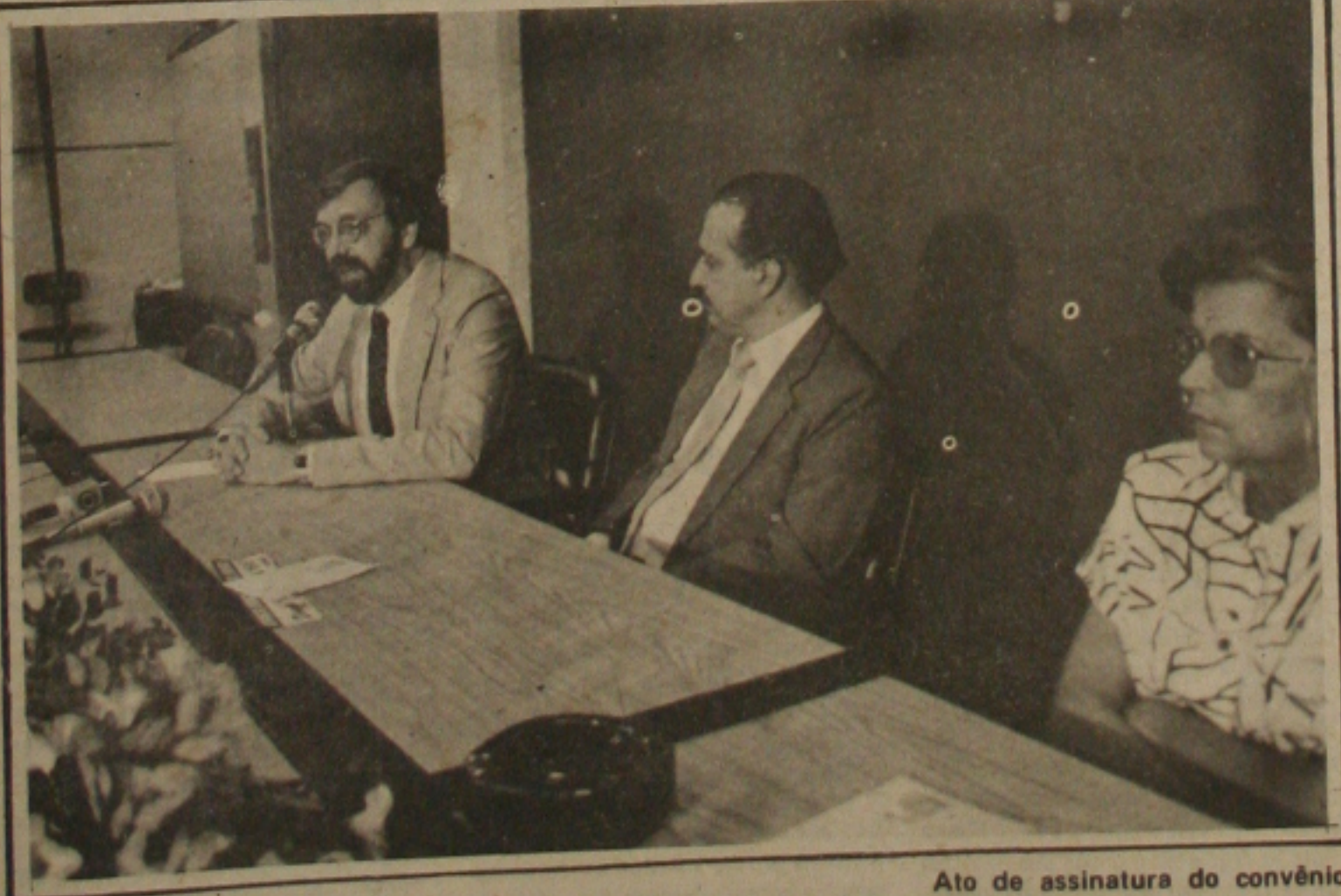
Ato de assinatura do convênio

O Governador Antônio Carlos Valadares presidiu ontem, no Palácio do Banese, uma reunião entre o Superintendente da Sunab, Celsius Antônio Lodder, a Delegada Regional do órgão, Lygia Maynard, e os prefeitos do interior do Estado, para regularizar as assinaturas de convênios entre as prefeituras municipais e a Sunab, objetivando o enrijecimento, também no interior, da fiscalização do congelamento de preços. Através dos convênios assinados ontem, cada prefeitura terá um ou dois servidores que representarão a Sunab em seu município, efetuando a fiscalização, consultas e inclusive a autuação de infratores que desobedeçam ao congelamento. Esses servidores serão contratados pelos fiscos da prefeitura para que possam atuar em suas cidades. Além disso, o convênio estabelece que 50 por cento da receita proveniente das multas lavradas por ocasião das infrações, serão revertidas em benefício do município.