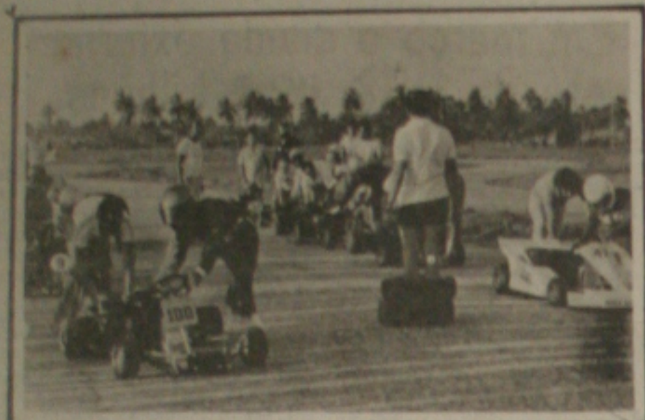
KARTODROMO SEM DEFINIÇÃO