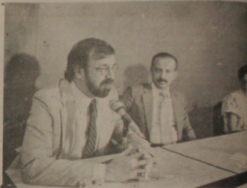
Assistido pelo governador Antônio Carlos Valadares, o superintendente nacional de Abastecimento, Celsius Lodder, explicou a importância da fiscalização dos preços.