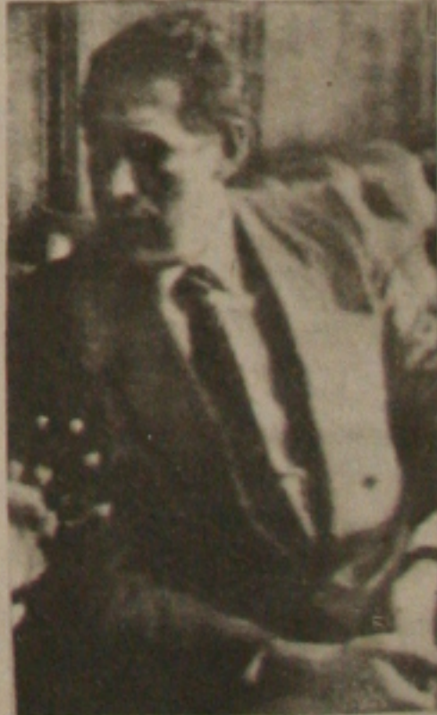
Governador do Estado de São Paulo, Orestes Quercia.