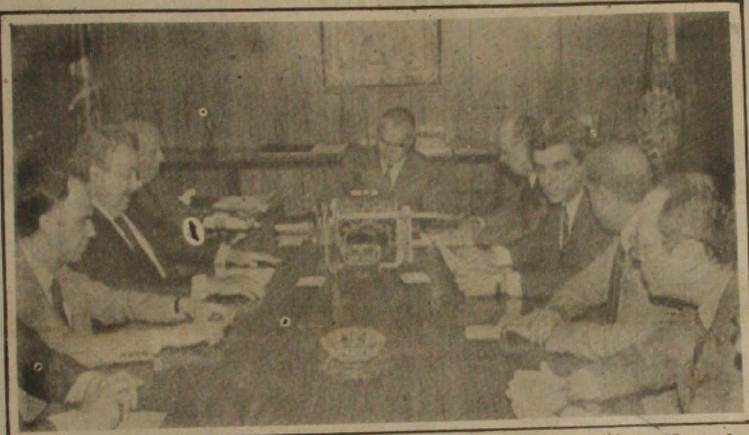
Brasília, 14 (EBN) - O Presidente José Sarney com Ministros e líderes políticos na sanção hoje do projeto de lei permitindo rolagem da dívida de Estados e Municípios

BRASILIA (EBN) — O Presidente Sarney sancionou, em solenidade no Palácio do Planalto, Projeto de Lei que trata sobre a rolagem da dívida de Estados e Municípios que, a partir de agora, através de operações com o Banco do Brasil, poderão rolar total ou parcialmente seus débitos contra o Banco até 30 de abril de 1987. O projeto de Lei também trata dos débitos relativos às despesas correntes de exercícios anteriores ao de 1987. Os recursos para essas operações serão supridos pelo Banco Central e os encargos financeiros serão definidos pelo Conselho Monetário Nacional. O processo fica condicionado à aprovação, pelo Ministério da Fazenda, de um plano de saneamento financeiro que será encaminhado pelos Estados e Municípios interessa-