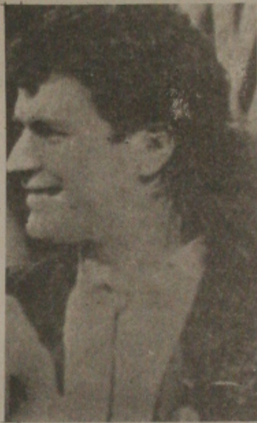
O cantor Paulo Ricardo, nada pela legalização da maconha.

As palavras do RPM aos repórteres causaram surpresa, pois esperava-se que ele fosse fazer um manifesto contra a repressão às drogas. Paulo Ricardo procedeu ao contrário e fez um discurso político, observando que no momento existem bandeiras mais importantes como a questão política e econômica do País. Só faltou dizer abaixo Sarney, Diretas já.