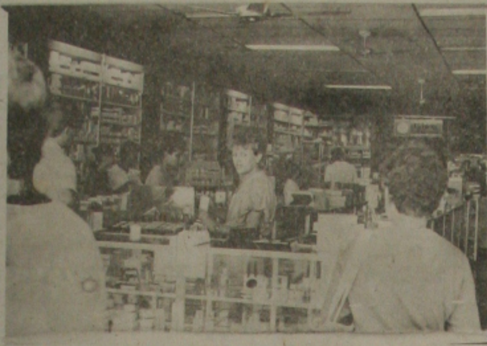
As farmácias de Aracaju continuam enfrentando a falta de remédios.

Quanto ao pronunciamento do Ministro da Saúde, afirmando que a Central de Medicamentos (CEME) do Governo Federal