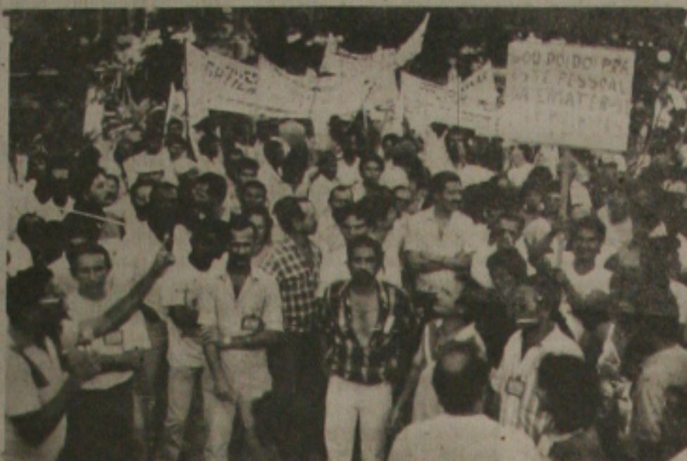
O ato público dos funcionários em greve na Emater-Se atraiu mais de duas mil pessoas.

Além de reivindicar uma melhor atenção por parte do Governo do Estado com relação as verdadeiras funções da EMATER-SE, em apoio ao setor agrícola do nosso Estado, os servidores afirmam ainda que a