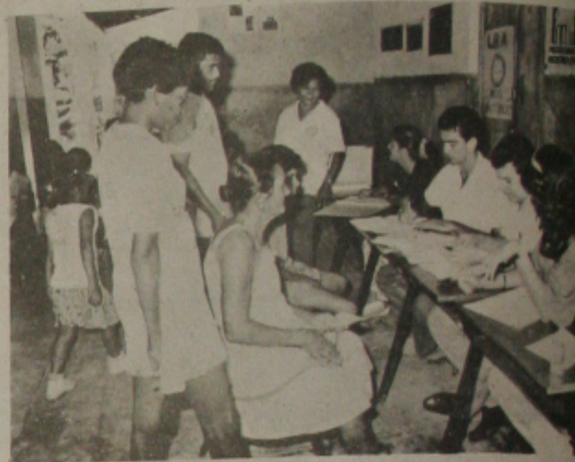
O "Mutirão do Serviço Jurídico" vai estender seus benefícios aos moradores do bairro Santos Dumont.

Mutirão de Serviço Jurídico, a Superintendente da LBA pretende ainda beneficiar outras famílias de diversas localidades, as