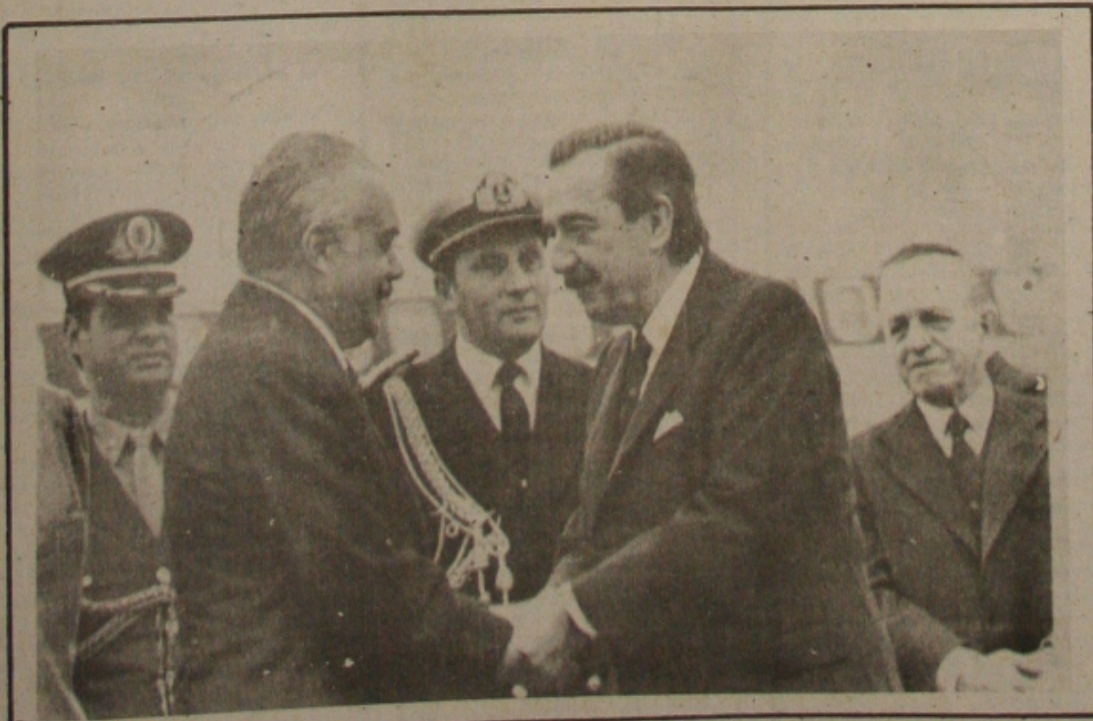
Buenos Aires. O presidente Sarney cumprimenta o presidente Alfonsín ao chegar ao Aeroparque, o aeroporto central de Buenos Aires

Depois de exercer várias funções importantes para a Igreja Católica na América Latina, Dom Lucas Moreira Neves passou a ocupar, desde 1979, o cargo de Secretário da Sagrada Congregação dos Bispos, em Roma, tornando-se também Secretário do Sacro Colégio dos Cardeais. Agora ele foi nomeado pelo Papa João Paulo II, Arcebispo e Cardeal Primaz do Brasil, substituindo o Cardeal Brandão Vilela, que morreu em dezembro do ano