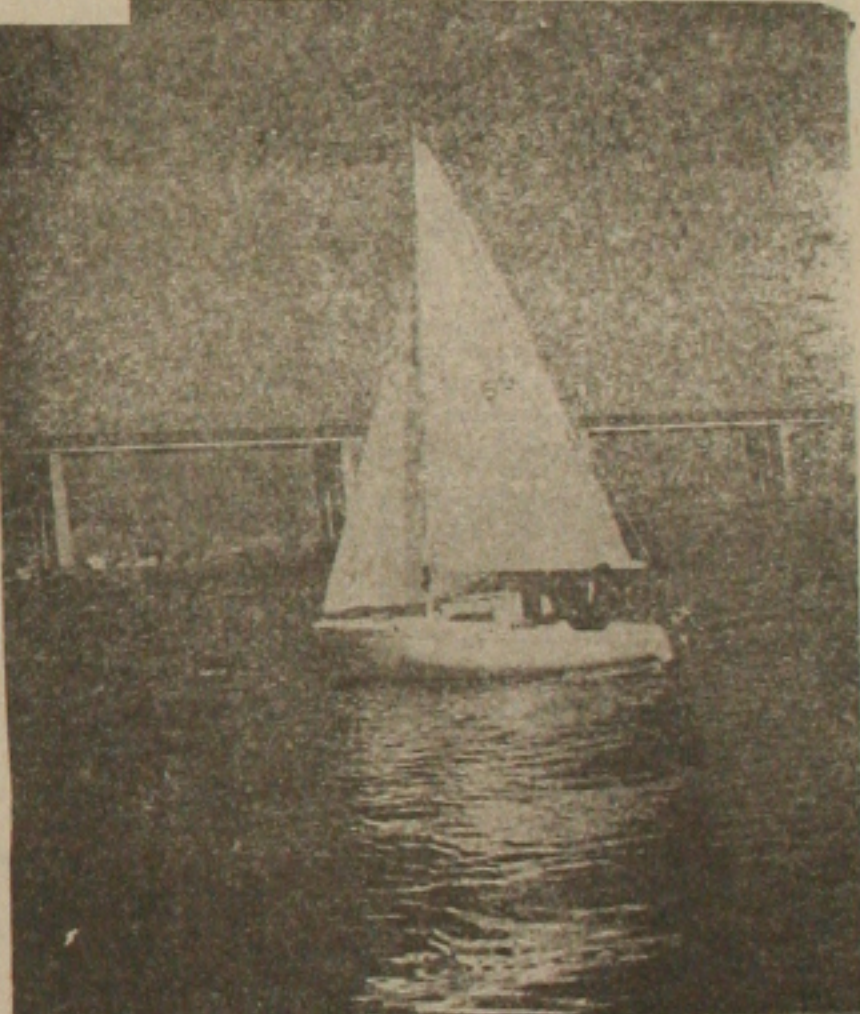
(Transcrito do repórter Bayer n.º 79)