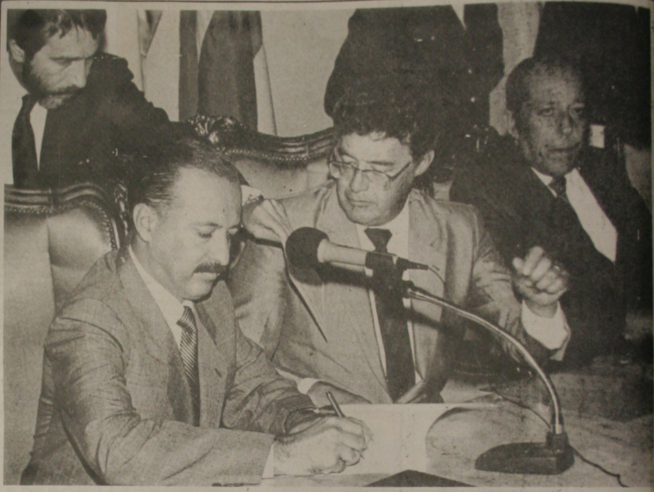
Governador Antônio Carlos Valadares, ministro Deni Schwartz e o presidente da Assembléia, Deputado Guido Azevedo.

O MAIOR VOLUME DE RECURSOS PARA HABITAÇÃO E SANEAMENTO DA HISTÓRIA DE SERGIPE, FOI FORMALIZADO ONTEM