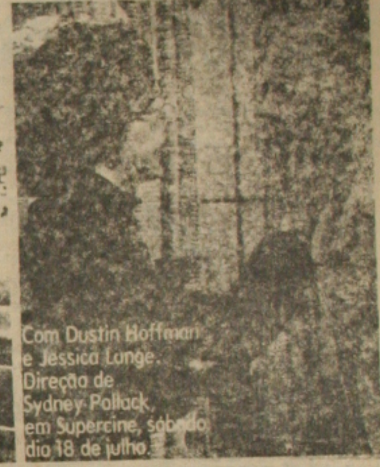
Com Dustin Hoffman e Jessica Lange. Direção de Sydney Pollack. Em Supercine, sábado dia 18 de julho.