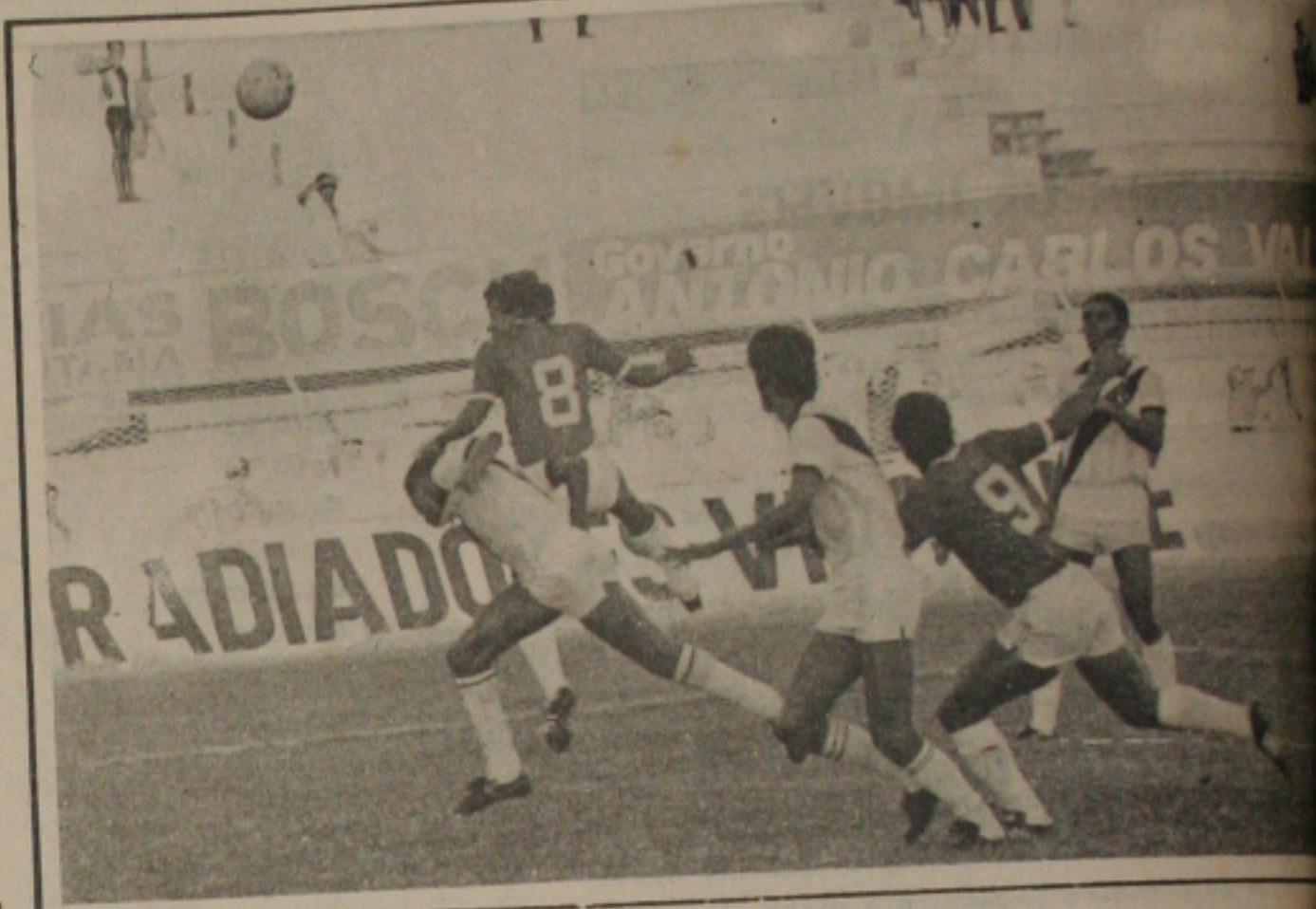
Sergipe enfrenta o Vasco de olho no Itabaiana.

Dirigentes do Sergipe informam que o time investiu, mas infelizmente os resultados de campo não foram os esperados. Amanhã caso se concretize a desclassificação do time rubro, um novo plano será implantado no time rubro que evidentemente deverá passar por uma reformulação com princípio de crise.