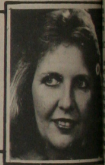
A simpatia da Srª Ana Teixeira.