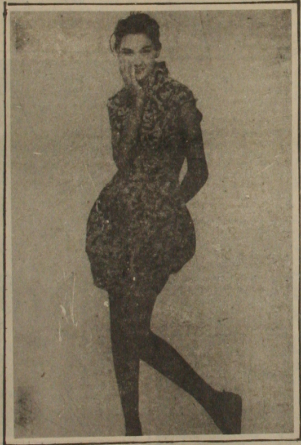
Vestido em popeline de algodão.

A Santaconstancia optou por acompanhar as tendências dos quatro temas propostos pelo C.I.M (Centro de Informação de Moda) da FENATEC. Naturalmente estes temas foram elaborados de uma maneira bastante sofisticada e diversificada, como é costume da nossa empresa. Os temas foram interpretados em tecidos de tear e malharia em lisos, estampados e fios tintos. CERIMÔNIAS: um tema que propõe uma cartela de cores claras. Várias tonalidades de branco, como o branco sujo, bege, marfim e tons pastéis. Tema romântico, recicla o espírito dos antigos enxovais e suas texturas nobres. A grande novidade da estação em termos