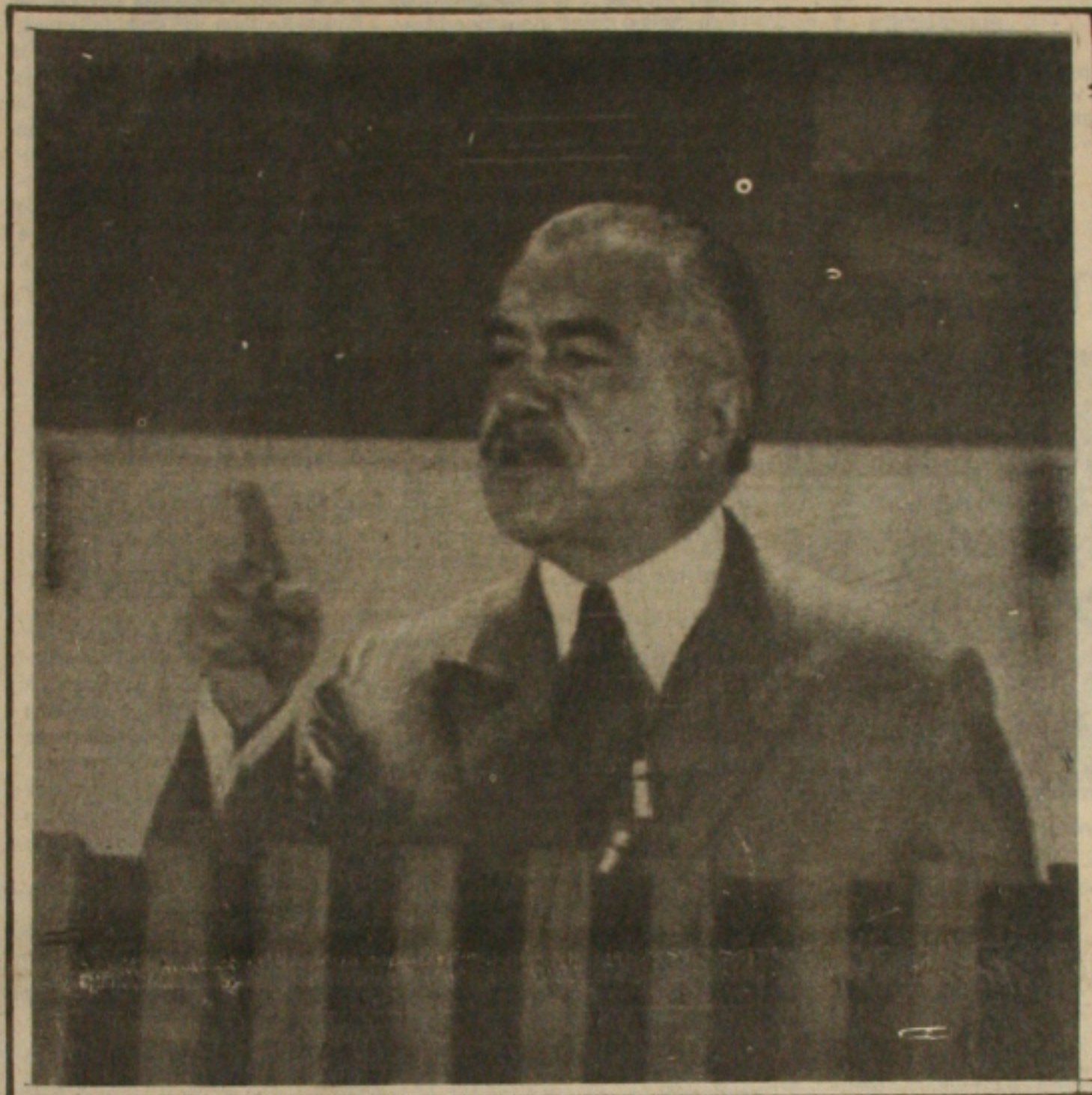
Sarney convida Collor para visita a Xingó.

BRASILIA (EBN) - A usina Hidrelétrica de Xingó, que o Presidente José Sarney irá visitar no próximo dia, 12, localizada na divisa dos Estados de Alagoas e Sergipe, acrescentará o sistema gerador da Companhia Hidrelétrica do São Francisco (CHESF) 2.136 megawatts médios, de energia, e contribuirá de forma decisiva para reduzir o racionamento de energia nos Estados do Nordeste.