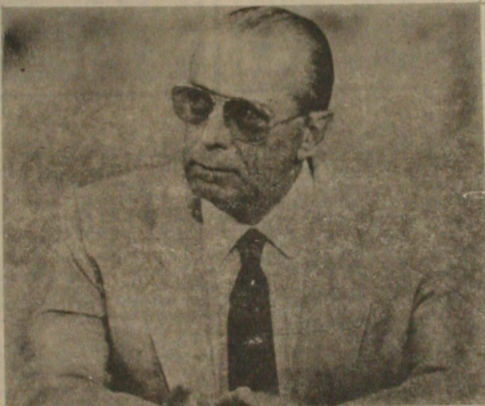
João Figueiredo será homenageado.

SÃO PAULO, (EBN) - O ex-presidente João Figueiredo estará em São Paulo, no dia 11 de agosto, terça-feira, para receber a medalha do Mérito Rodoviário que lhe foi outorgada pelo Conselho Superior da Associação Nacional das Empresas de Transportes Rodoviários de Carga (NTC), em sua reunião ordinária de abril. A cerimônia será realizada no Buffet Baluca, a partir das 18 horas.