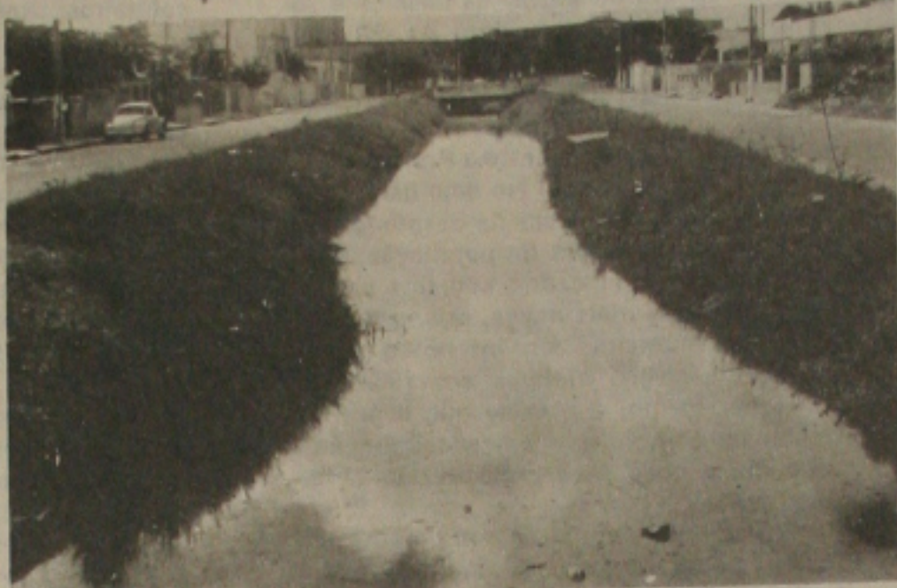
O Canal Gonçalo Prado está entre os que serão revestidos.