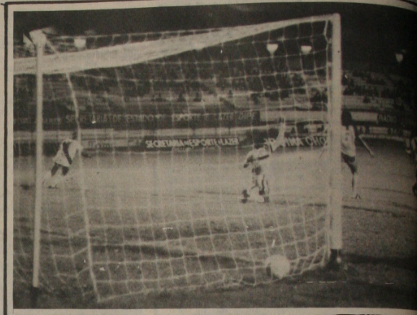
Pimenta fez 1x0...