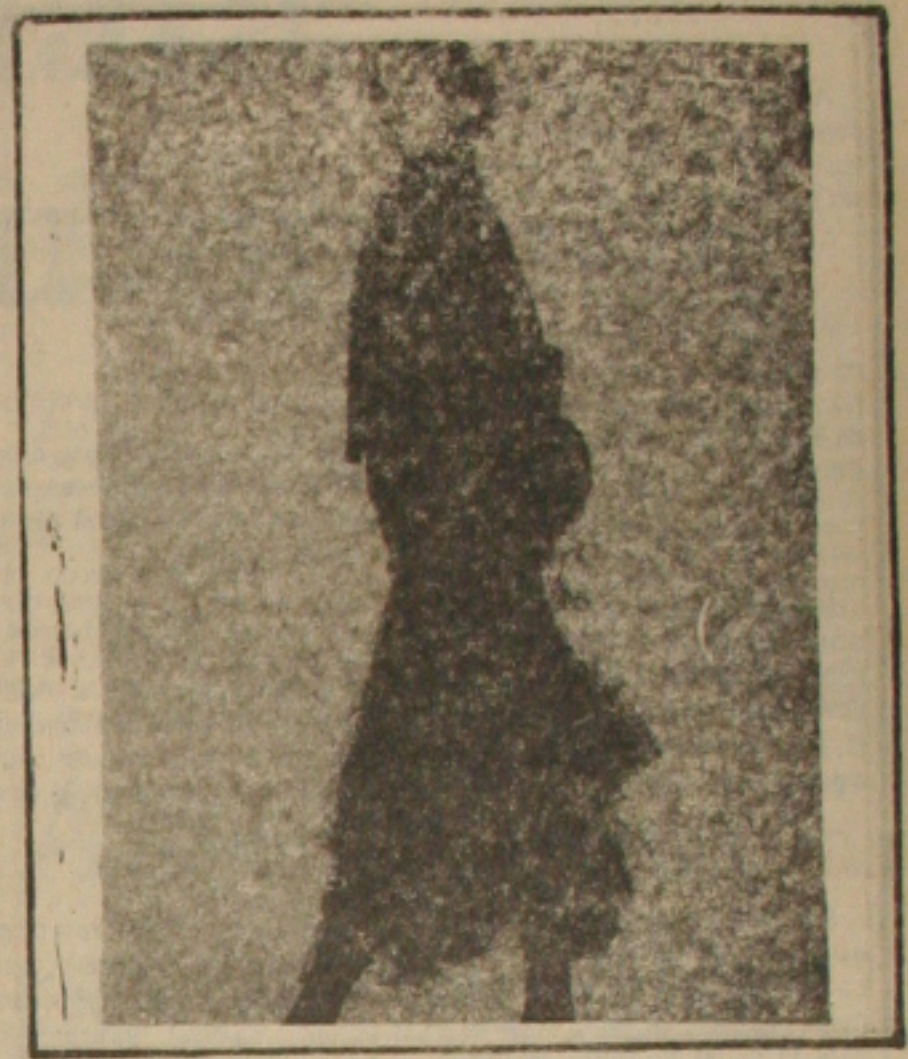
Missão Urbana: Jaqueta em sorja de algodão.