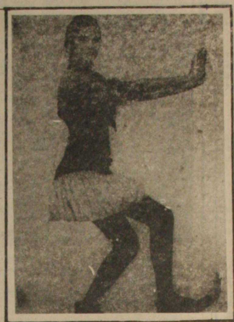
Jaqueta em linho