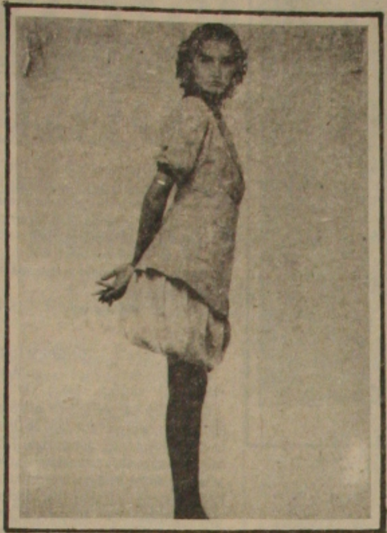
Cerimônias: Blazes em linho com detalhes.