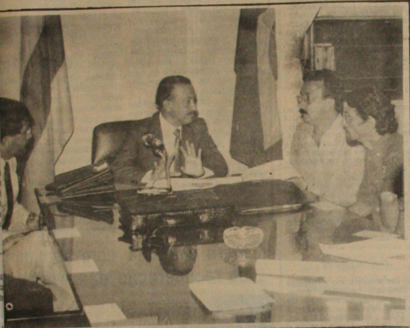
Governador discute implantação da empresa.