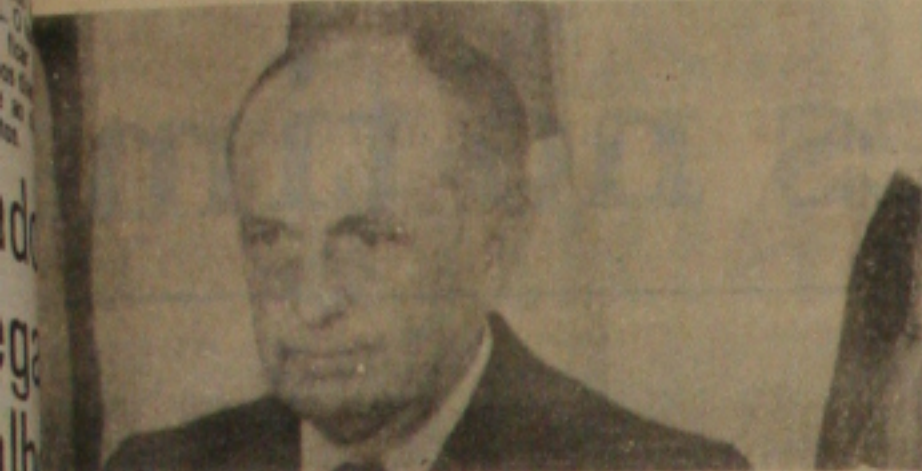
do da Fazenda. Luiz Carlos Bresser Pereira.

DADE DO MÉXICO - (EBN) - O Mida Fazenda, Luis Carlos Pereira, disse ontem, e encontro com empre-mexicanos, que um dos que mais contribui para a do intercâmbio com-entre Brasil e México é o na da dívida externa, que os países latino-america-