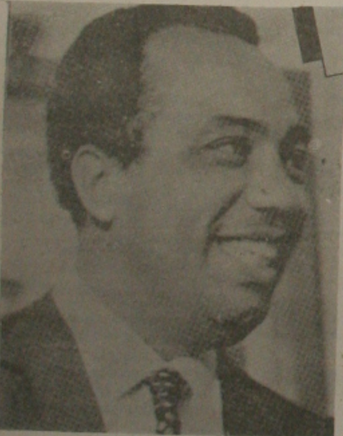
João Alves Filho, Ministro do Interior