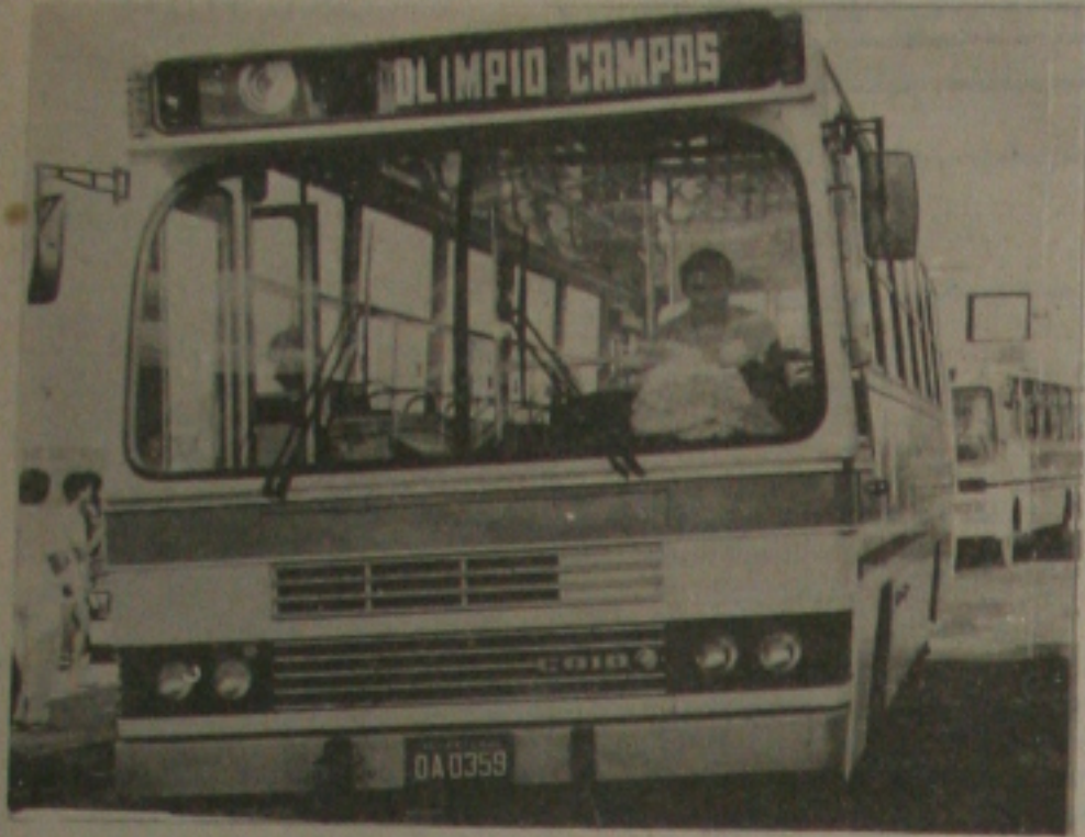
Os ônibus vão circular no dia da greve-geral.