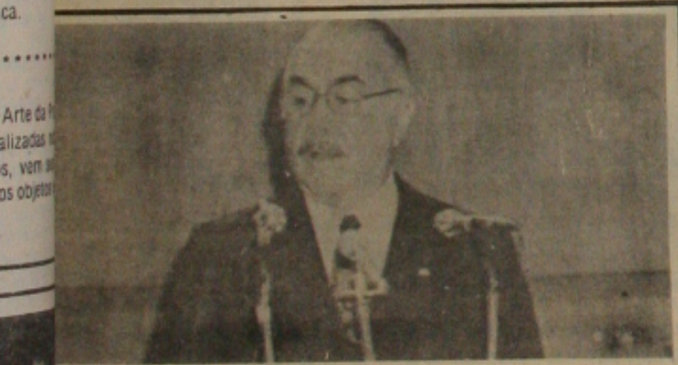
Presidente Sarney discursa no plenário da Comissão Permanente do Congresso Mexicano.

DE DO MÉXICO, (EBN - enviados especiais) - O Presidente José Sarney exortou os países latino-americanos a unirem-se com a finalidade de resolverem os seus problemas.