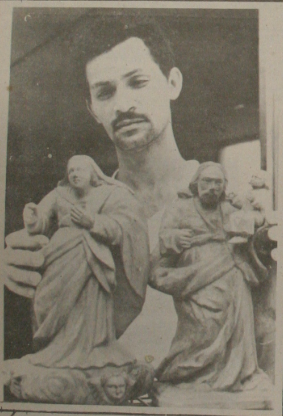
Pinto mostra seu brilhante trabalho de esculturas sacras até o dia 26 deste mês, na Galeria de Arte "Florival Santos", numa promoção da UFS.

para o coquetel de lançamento do Ceil Praia Hotel, a ser realizado no dia 19 (hoje) no stand do Estado de Sergipe na Feira da ABV - Associação Brasileira de Agentes de Gens, em Natal-RN.