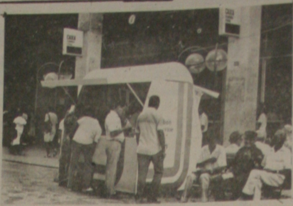
As vendas de sorvetes estão apresentando uma grande queda.