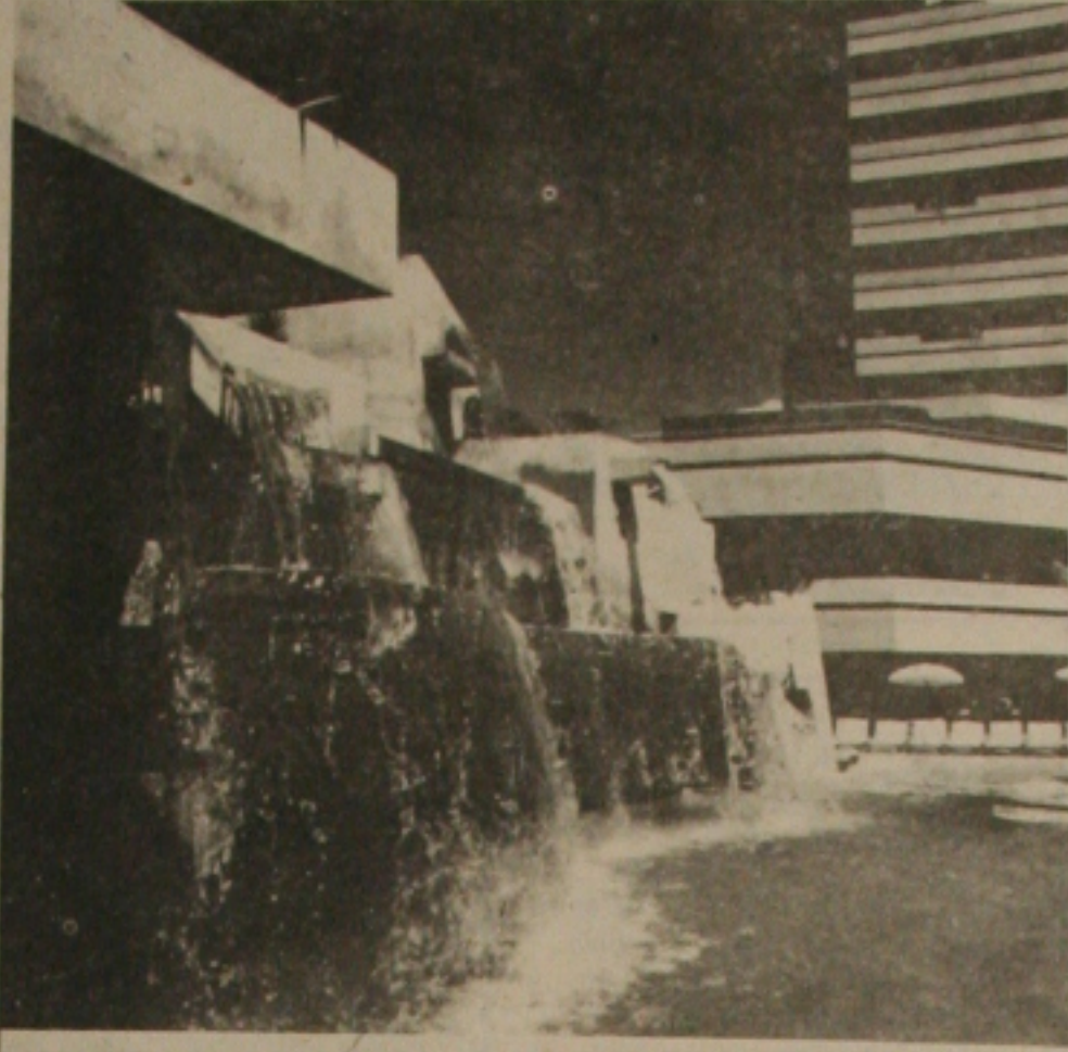
Mar Hotel, na Praia mais linda do Recife.

Para sustentar este Centro o Hotel dispõe de uma infraestrutura de preparação de alimentos perfeita, numa área específica, com toda higiene, e operada com equipamentos adequados, sendo a introdução do armazenamento de alimento à vácuo, em ambiente fechado, com ar condicionado, operando uma revolução de costumes no padrão nordestino e proporcionando um produto de confiabilidade assegurada, que corresponde à expectativa desse laser, sob a forma de cardápio bonitos, exóticos e requintados.