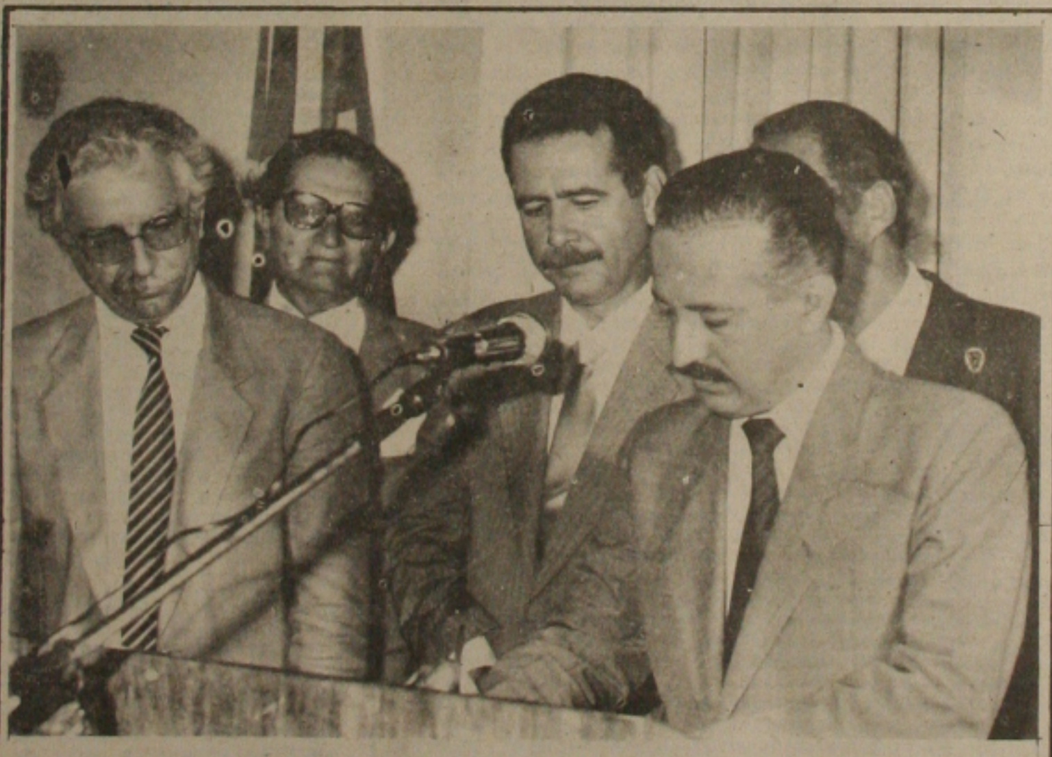
O Governador Antônio Carlos Valadares assina convênio com a FAE.

o positivo - foi como o celer Abreu Sodré qual- ontem o resultado da vile três dias do Presidente ay à cidade do México. isse esperar que a partir ora o comércio entre os países cresça substante. Sodré lembrou nos últimos cinco anos, o rcio Brasil x México vem luzindo a média anual de cento.