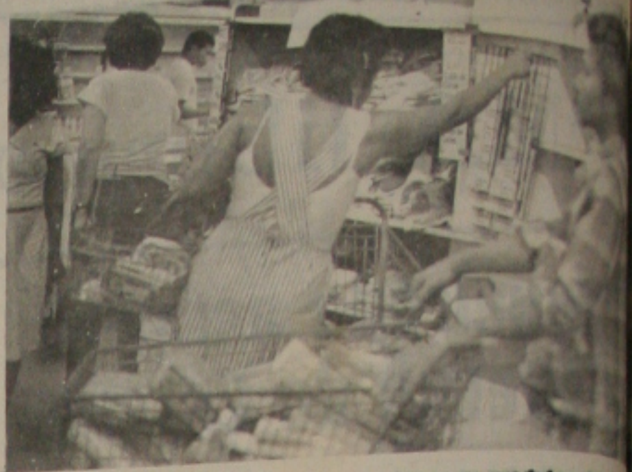
Para os donos de Supermercados o congelamento deve atingir apenas os produtos da cesta básica.