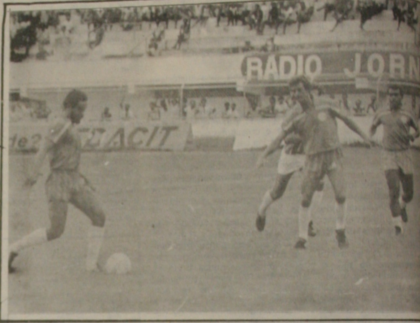
Nildo não enfrentará o Vasco.

Pelo que o time apresentou contra o Estanciano e por ser o Vasco um "fregues" do Confiância Ribeiro acredita que a partida será difícil mas o Confiância deixará o campo com a vitória assegurada. Ele conversou muito com o elenco durante a semana e ontem no coletivo do Batistão voltou a lembrar o que representa uma vitória amanhã a tarde contra o Vasco. Hoje após o coletivo será iniciado o regime de concentração no Hotel Palace. Existe muita motivação no elenco e os jogadores acreditam mesmo em uma vitória.