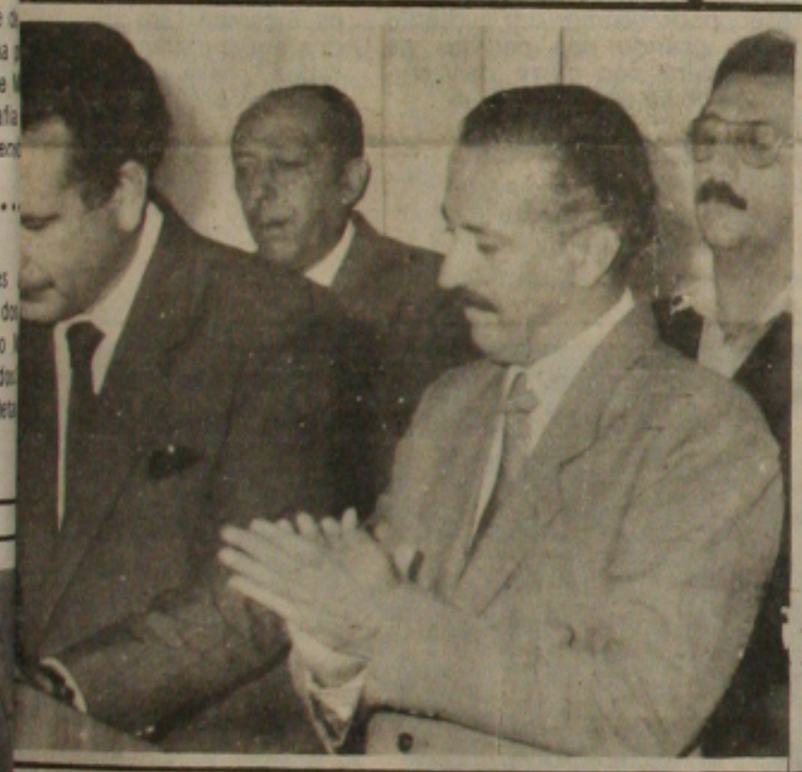
Benedito assumiu Governo do Estado.

A eleição presidencial em 1990 sob o parlamentarismo poderia esvaziar o movimento dos governadores contra a mudança de sistema. Para os governadores, 1989 seria uma péssima alternativa de eleição presidencial: a um ano do final do mandato, teriam suas lideranças testadas por uma eleição majoritária, com pequenas chances de recuperação de imagem, em caso de derrota. Eles ficariam tranquilizados também com a garantia de que o parlamentarismo nos estados fica para o mandato seguinte.