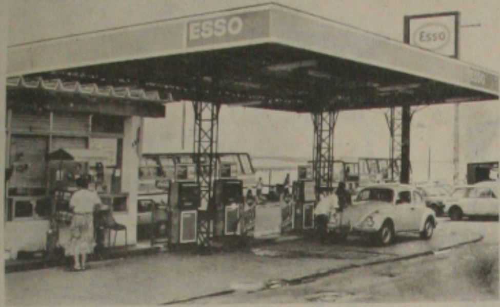
A redução nos preços da gasolina e do álcool agrada ao Sindicato dos Revendedores de Sergipe.

Em seu pronunciamento, feito no Hotel Glória, o Ministro informou que, tão logo sejam concluídos os estudos que vêm sendo feitos pela Petrobrás e pelo Conselho Nacional do Petróleo (CNP), o assunto será submetido aos ministros da área econômica