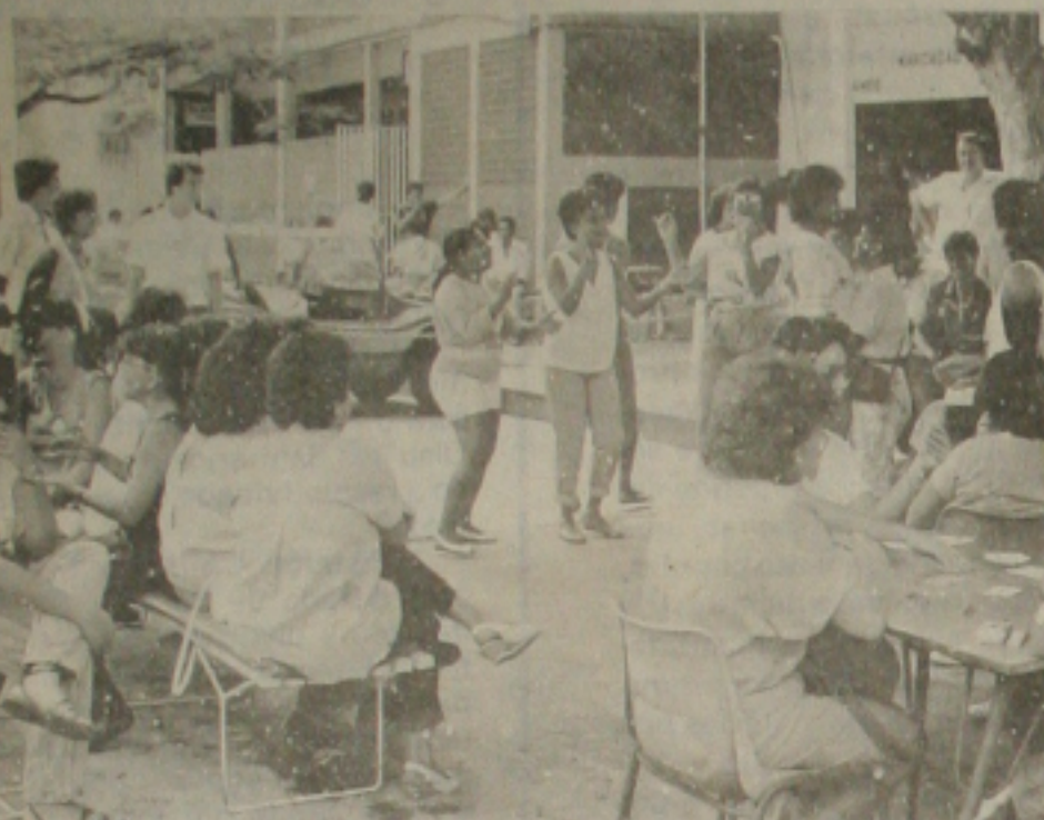
Na paralisação, os grevistas passaram o tempo se divertindo.

Os servidores do Instituto de Previdência do Estado de Sergipe (IPES) retornarão ao trabalho na próxima segunda-feira. A decisão foi tomada em Assembléia realizada na manhã de ontem, na sede do Instituto após a conclusão das negociações entre os servidores e os Secretários de Estado da Administração, Francisco Façanha, e do Trabalho, Wellington Paixão.