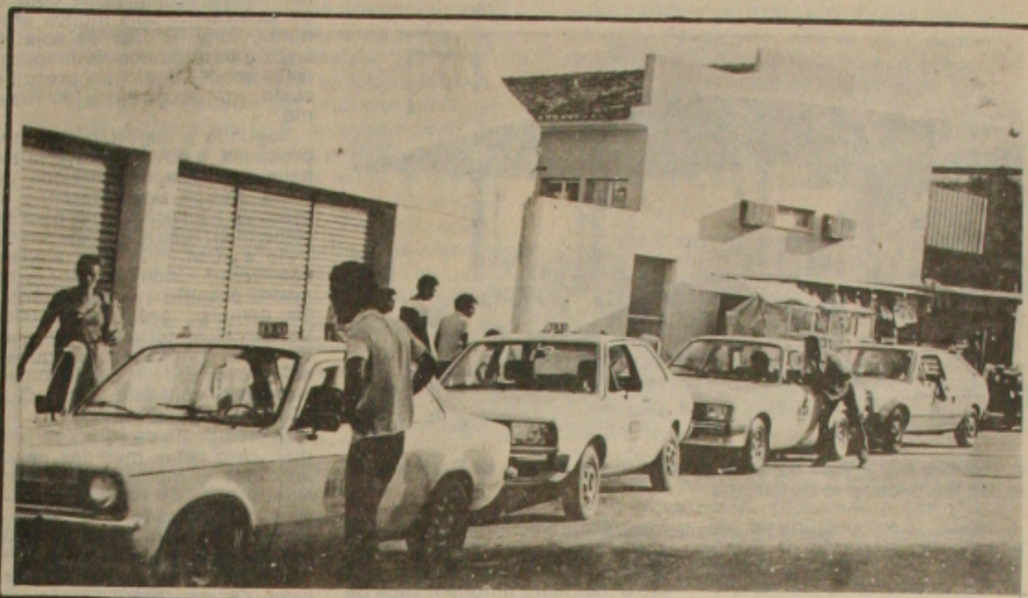
Táxis ficarão sem passageiros com o novo aumento.

A solenidade de transmissão do cargo de governador ao vice Benedito Figueiredo foi prestigiada pelo senador Lourival Batista, pelo deputado federal, José Queiroz, pelo prefeito de Aracaju, Jackson Barreto, do Vice Vianna de Assis, deputados estaduais, secretários de Estado, prefeitos municipais e diversas outras autoridades.