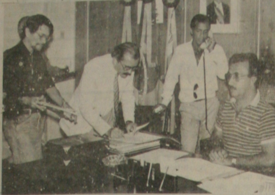
Um dos momentos da reunião que resultou na concessão do aumento nos preços das tarifas dos táxis.

Agora, a tarifa que era de Cz$ 19,60 passou para Cz$ 25,80 - um reajuste de aproximadamente 25 por cento. Na próxima quarta-feira, dia 26, a partir das 10 horas da manhã, na Secretaria de Transportes, os motoristas de táxi receberão a nova tabela e, só então, é que poderão cobrar dos passageiros os novos