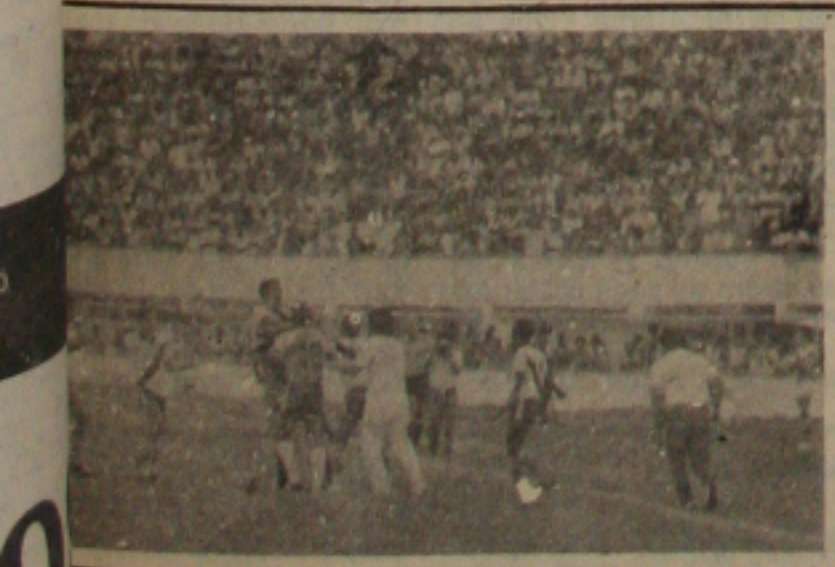
Muita vibração no primeiro gol vascano.