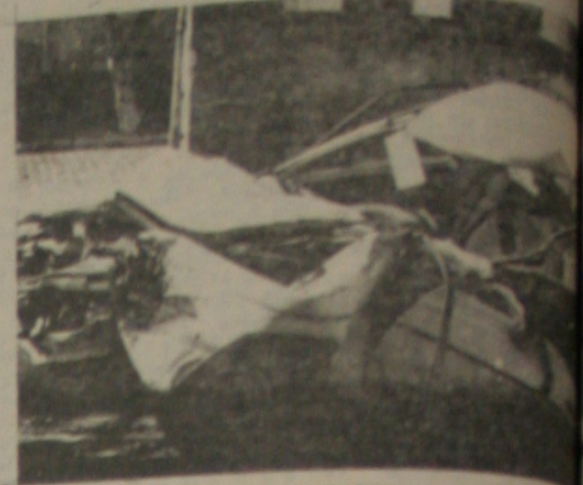
O carro da vítima ficou neste estado.