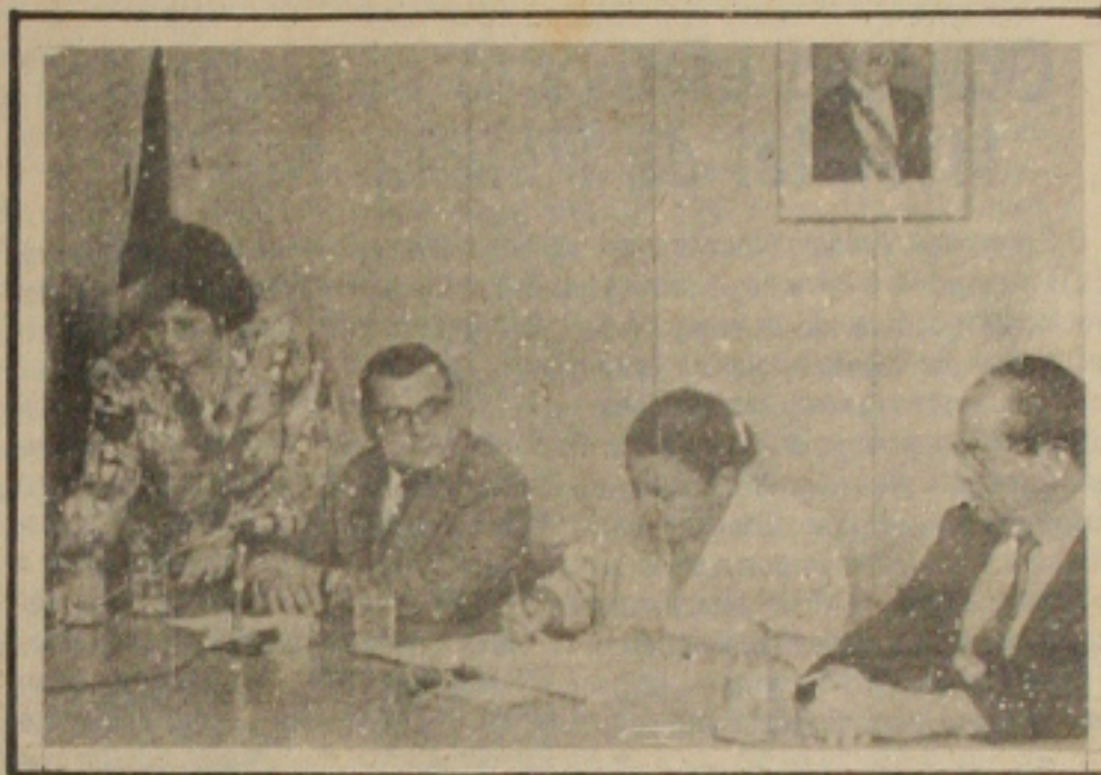
D. Marly Sarney, ladeada pelo presidente da LBA, Marcos Villaga, e pelo senador Jarbas Passarinho, na comemoração dos 45 anos da Legião Brasileira de Assistência.

"2 milhões e 71 mil crianças entre 0 a 6 anos foram incorporadas ao atendimento da LBA nos últimos 8 meses, totalizando assim 8 milhões de crianças atendidas". Disse ainda Dona Marly que "este ano a LBA viabilizou a implantação de 30 mil novas microempresas além de 1 milhão e 500 mil brasileiros que estão fazendo cursos profissionalizantes".