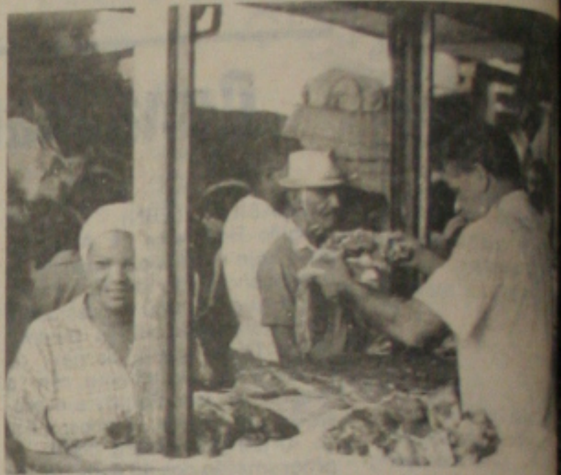
Carne bovina está sendo comercializada acima do preço tabelado.