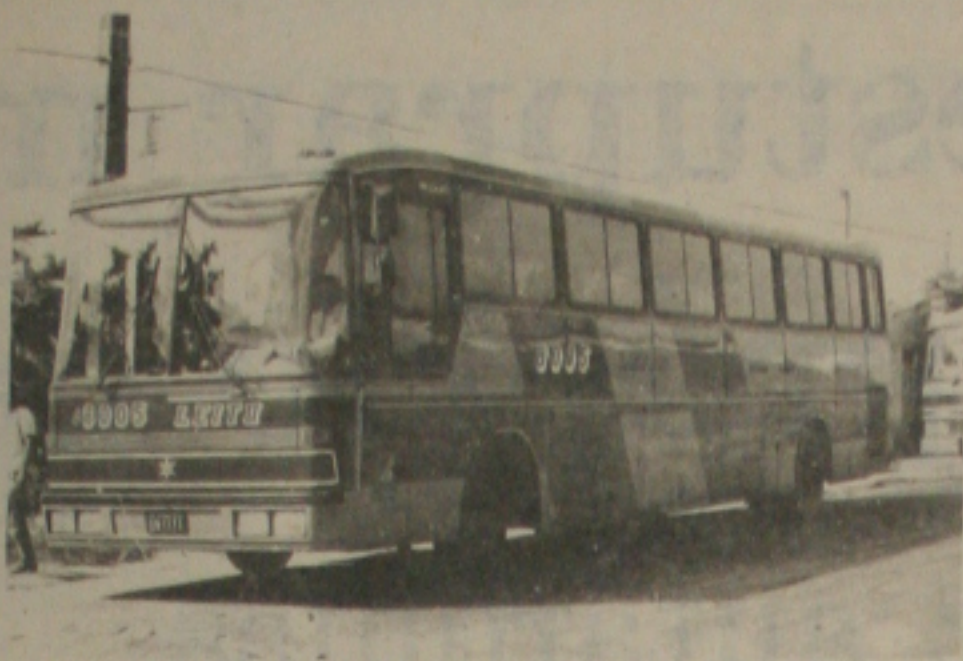
O aumento nas passagens dos ônibus interestaduais não agrada a ninguém.

Por outro lado, os usuários estão insatisfeitos com a majoração, por ser, na concepção de algumas pessoas, 19,6 por cento um percentual elevado. O aumento nas passagens vigorou desde zero hora do último domingo. A passagem mais barata Aracaju/Macelo, que custava CZ$ 129,31, passou para CZ$ 155,04, enquanto que a mais cara, pela empresa Senhor do Bonfim Aracaju/Salvador no carro leito, passou de CZ$ 284,67 para 341,32.