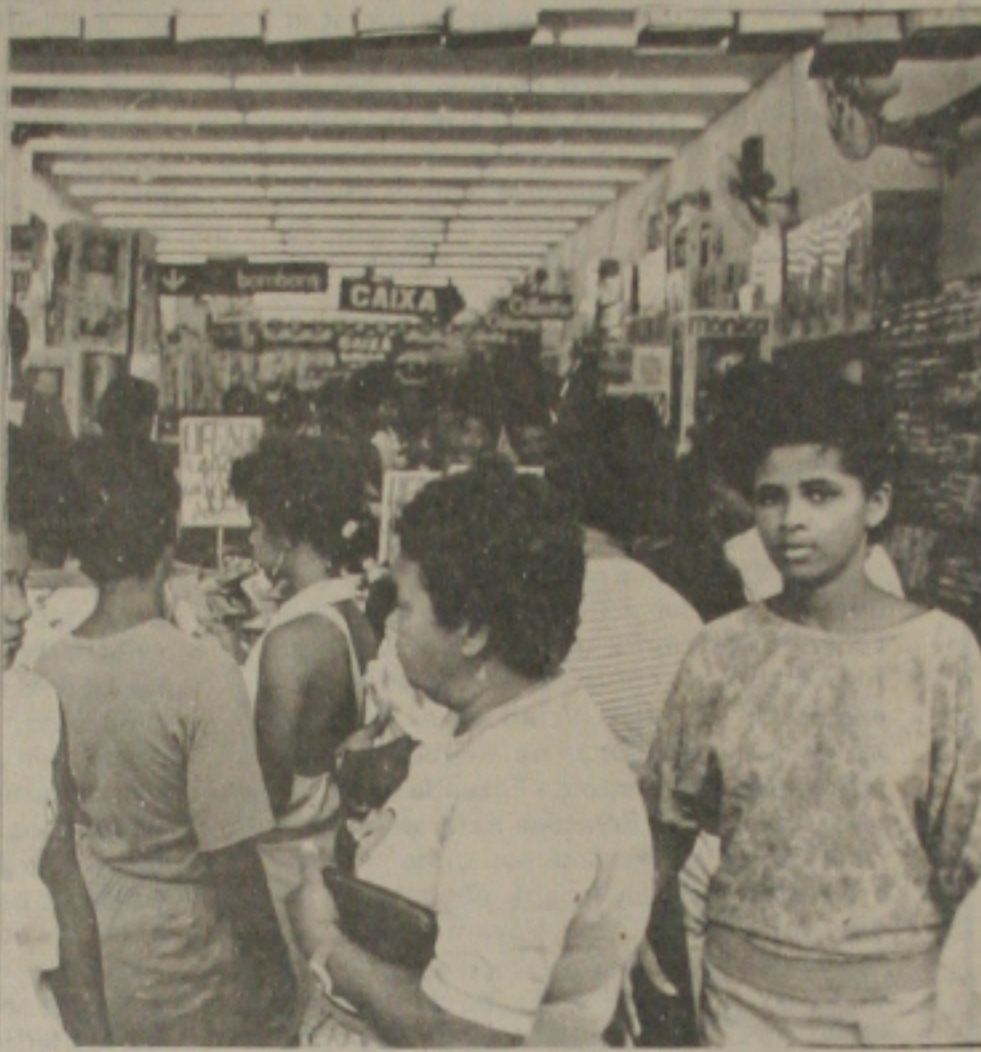
O comércio apresenta boa recuperação e o desemprego diminui.