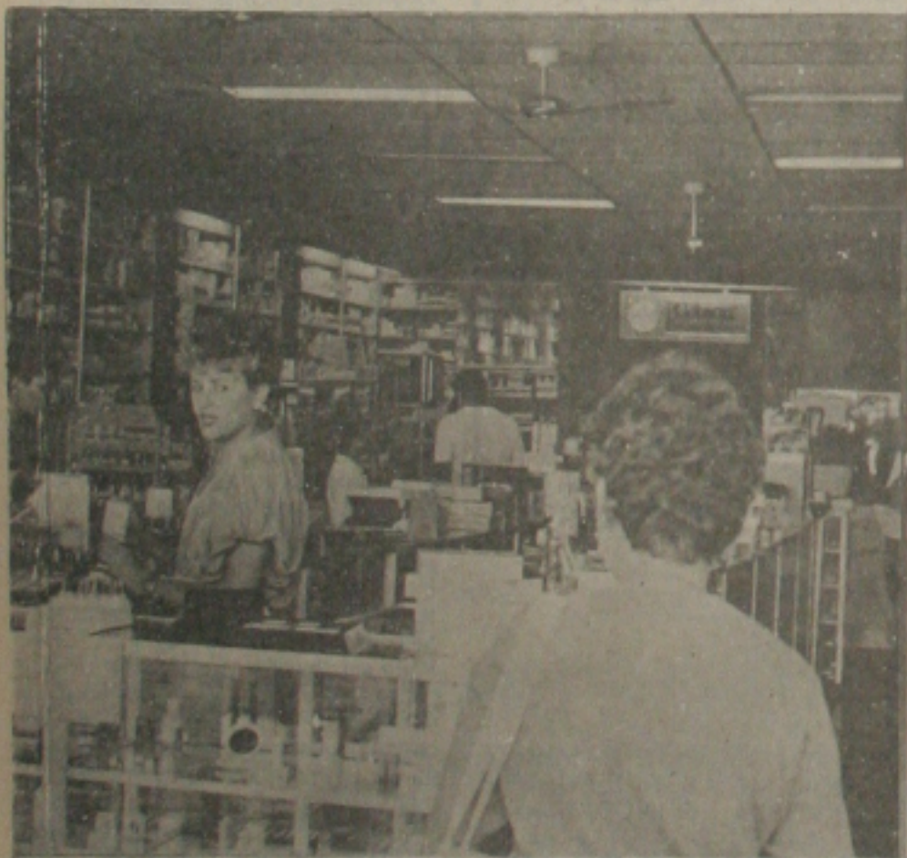
A crise no abastecimento de remédios é preocupante.