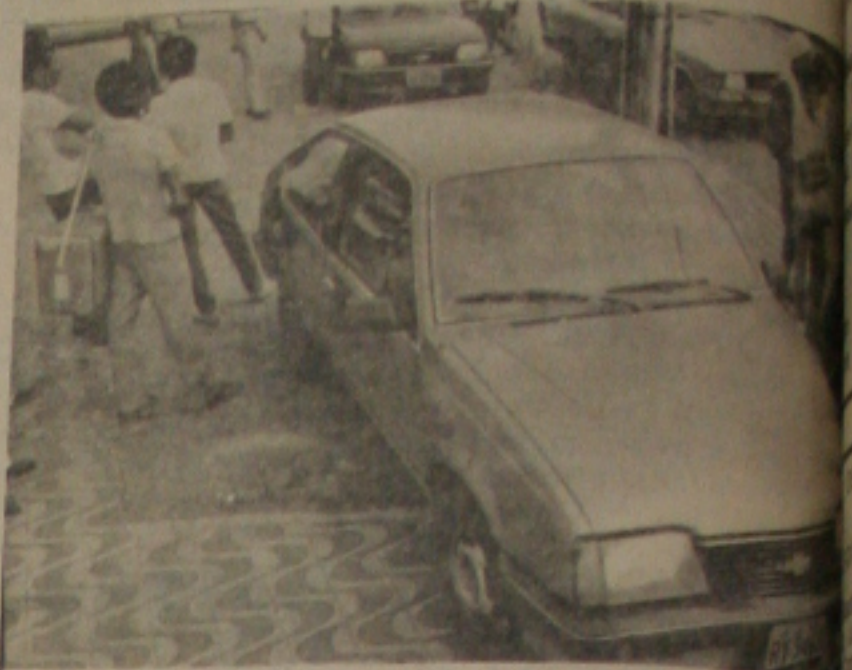
O dinheiro estava no porta-mala desse Monza