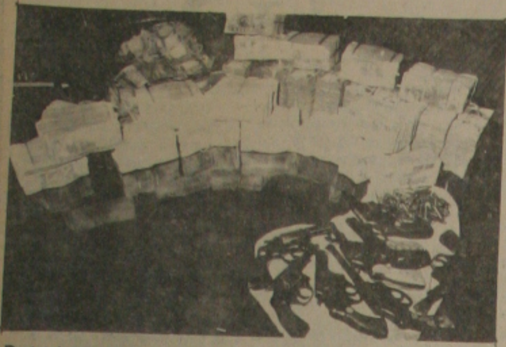
Do total desse dinheiro apreendido, parte dele sumiu no trajeto do local em que estava ao prédio da SSP.