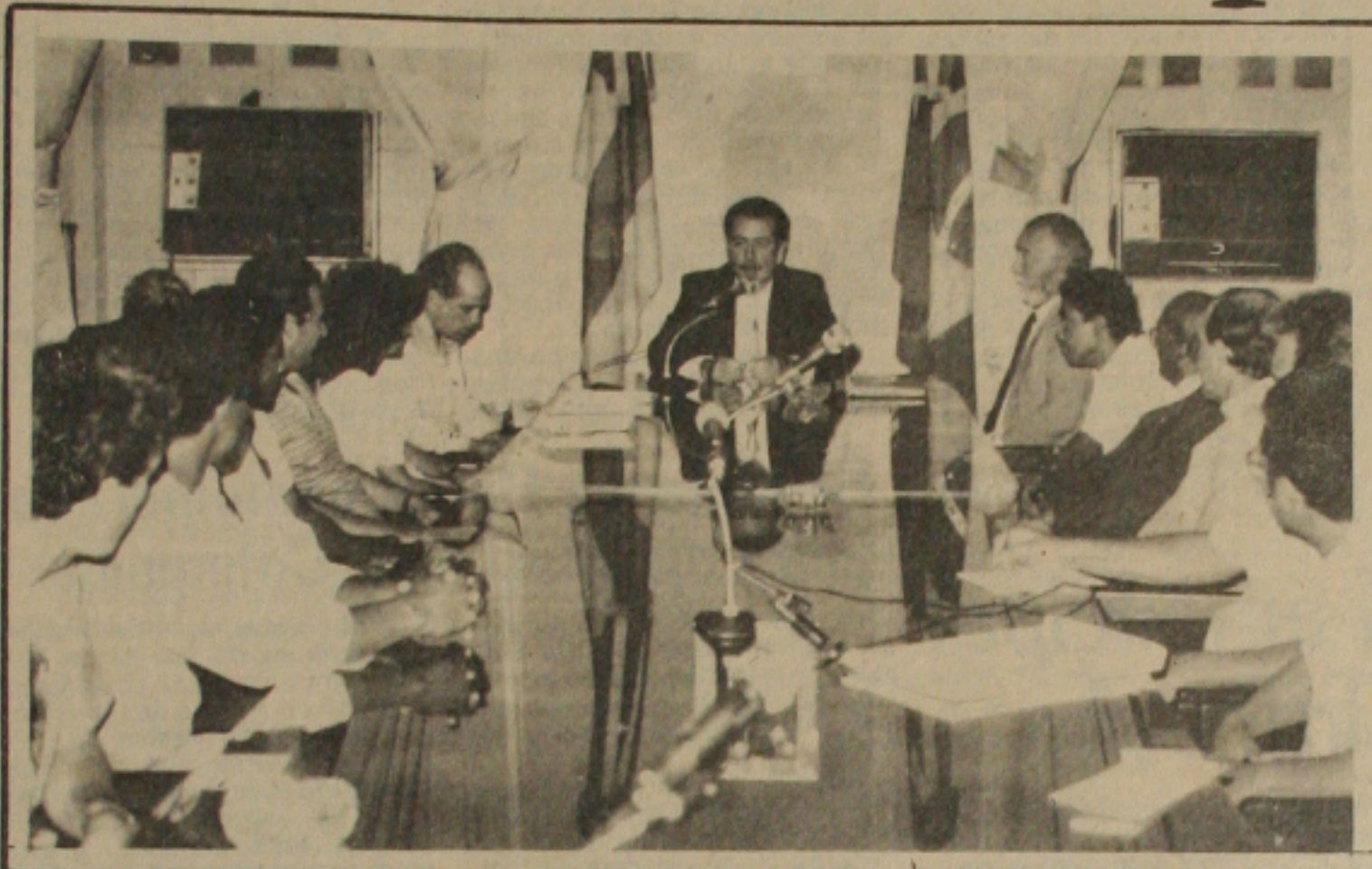
O Governador recebe representantes das autarquias