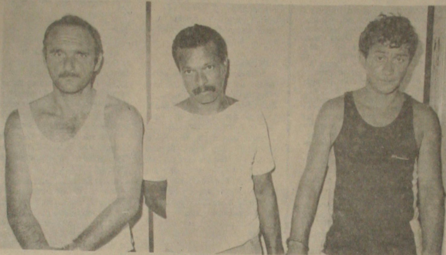
Os assaltantes disseram que só gastaram Cz$ 150,00