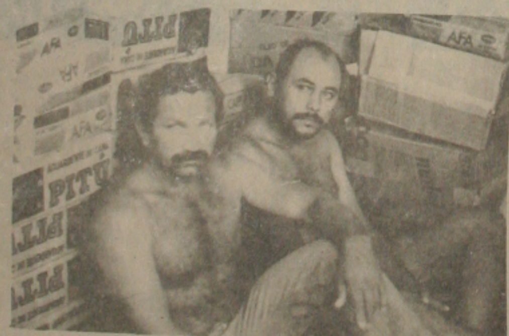
Os estelionatários e as mercadorias que trouxeram para Aracaju.

Com base no levantamento feito pelo policial Vieira Sarmiento, a dupla emitiu um cheque no valor de Cz$ 150 mil na distribuidora Cerma, um outro cheque de Cz$ 198 mil na distribuidora Brahma. Ambas em Maceló. Ainda na capital alagoana, os pernambucanos emitiram cheques nos valores de Cz$