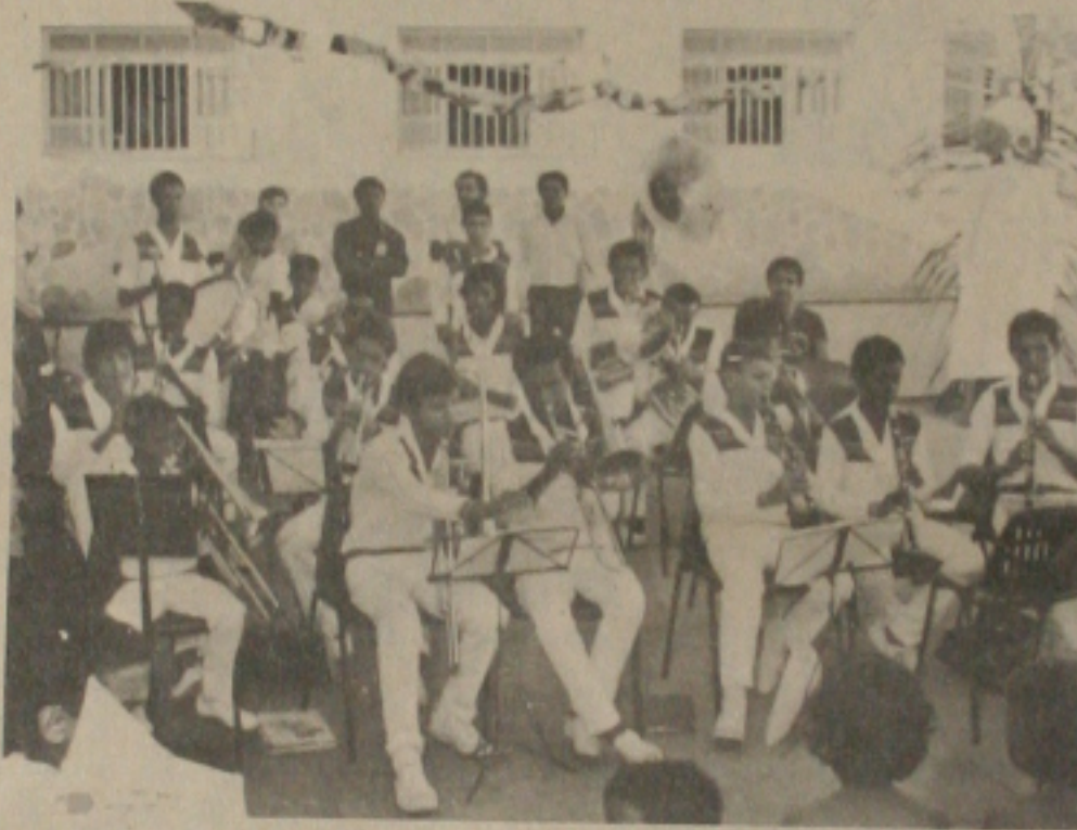
A Banda de Música formada por alunos do Instituto Lourival Fontes.

Com uma vasta programação, a ser cumprida de hoje até domingo, o Instituto Lourival Fontes vai comemorar 20 anos de fundação. Contando com o apoio da Fundação Estadual de Cultura o programa inclui missa, inaugurações, concerto sinfônico, apresentação do Grupo Stúdiom Danças, competições esportivas, recreação e debate sobre a questão do menor. Estas atividades serão desenvolvidas nas dependências do Instituto e no Teatro Atheneu Sergipense.