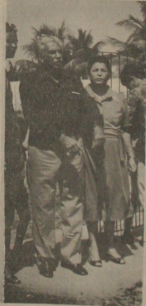
A presidente Hildete Falcão Baptista ao lado do esposo, senador Lourival Baptista.

No sábado pela manhã, nas dependências do Instituto, acontecerão competições esportivas, recreação infantil - a cargo da Fundesc -, e mesa redonda sobre "o menor institucionalizado e a sociedade". Já no período da tarde, também no Instituto Lourival Fontes, será apresentado a peça "A história da Linhazinha" pelo Teatro da Casa do Centro de Criatividade. Finalmente para o domingo estão previstas competições esportivas, apresentações do Grupo de Capoeira "Os Moias", do Grupo de Flauta Doce do Centro de Criatividade e da Banda de Música do Instituto Lourival Fontes.