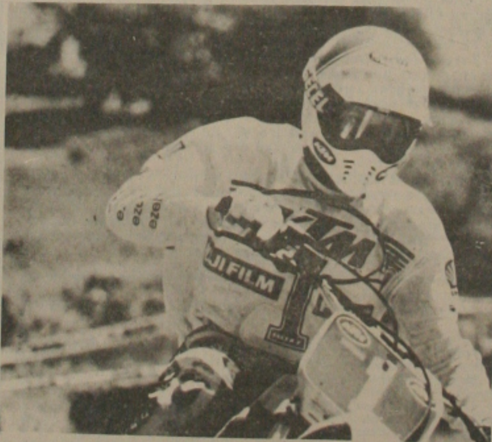
Motocross 2ª etapa amanhã.

As transmissões serão permitidas se acontecerem em horários compatíveis com os demais jogos.