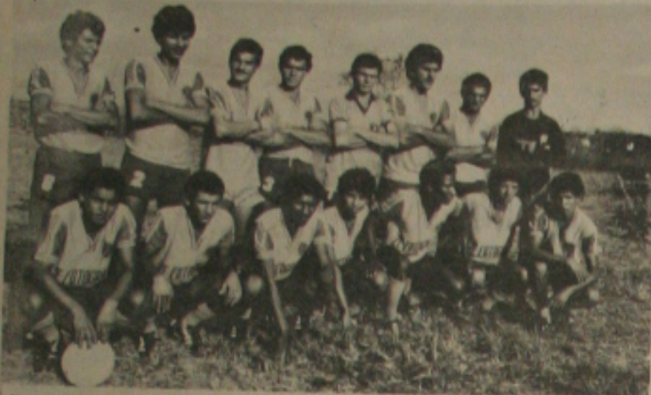
SÃO MIGUEL BRILHANDO

Na foto, o quadro do Esporte Clube São Miguel do Aleixo da cidade que lhe empresta o nome que vem sendo denominada o "terror" do interior sergipano. O São Miguel em seus domínios, este ano, não sabe dizer o que é uma derrota. (foto - Zé Fotógrafo).