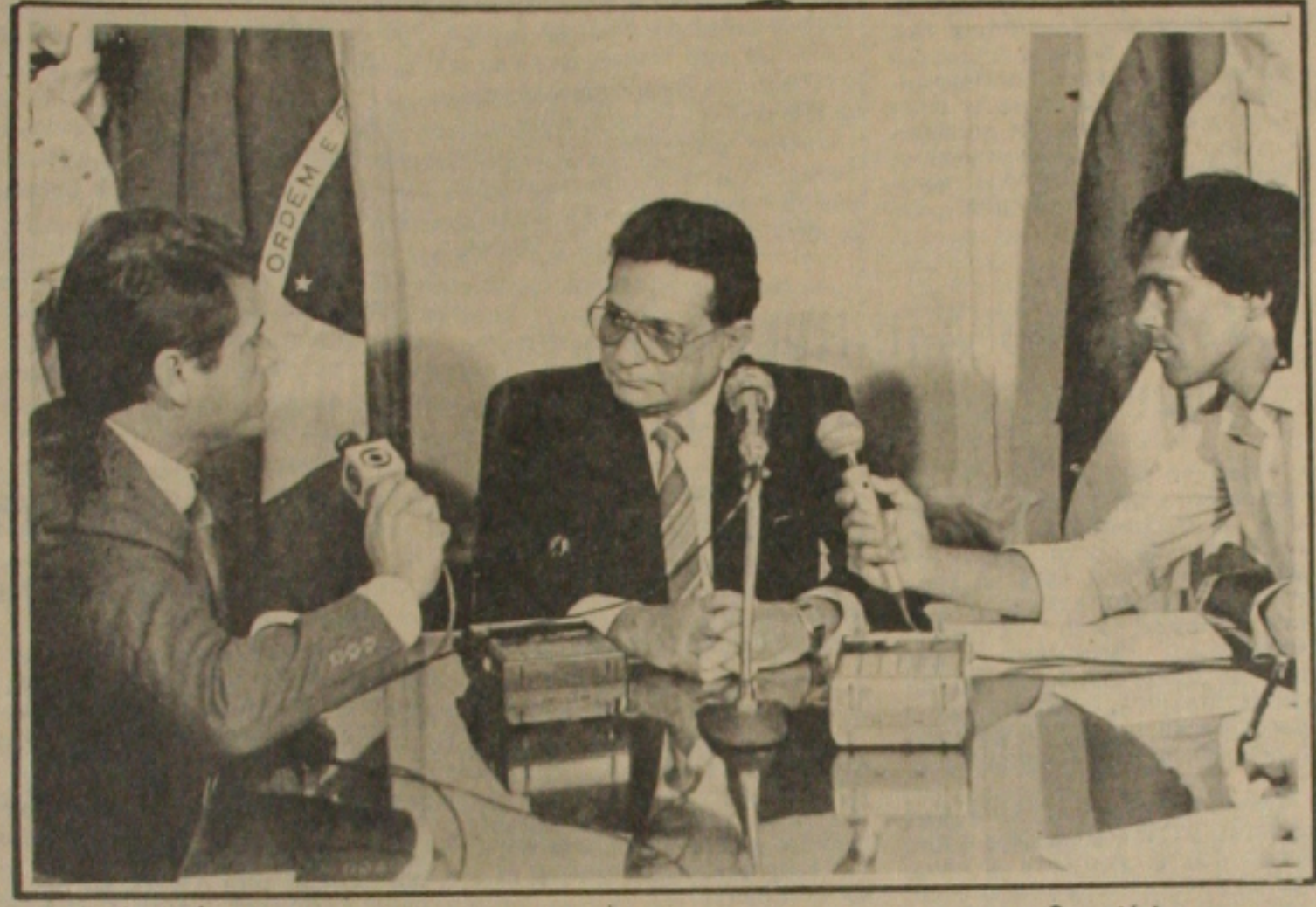
Luciano Prado anuncia aos jornalistas, que Valadares pediu os cargos aos seus Secretários.

Insatisfeito com o funcionamento da máquina administrativa nos primeiros 180 dias de governo, o Governador Antônio Carlos Valadares reuniu ontem, em caráter de emergência, todos os seus secretários, para pedir que colocassem seus cargos a disposição. O pedido foi aceito coletivamente, mas nenhum secretário foi afastado, porque Valadares só pretende iniciar as substituições nos próximos dez dias.