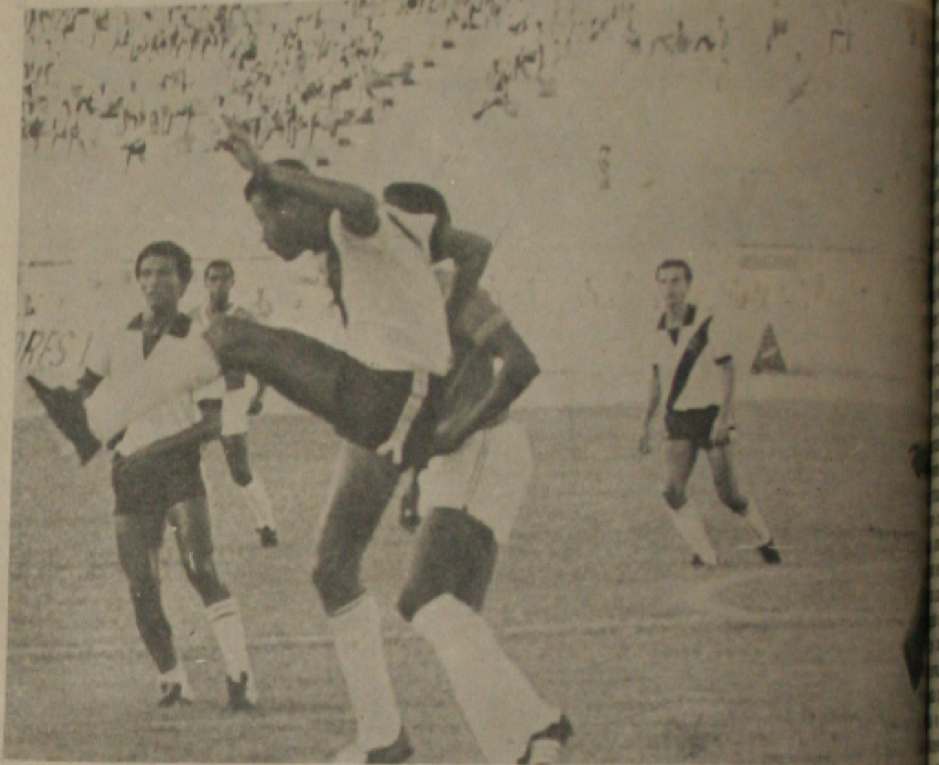
Vasco: time está pronto para o amistoso