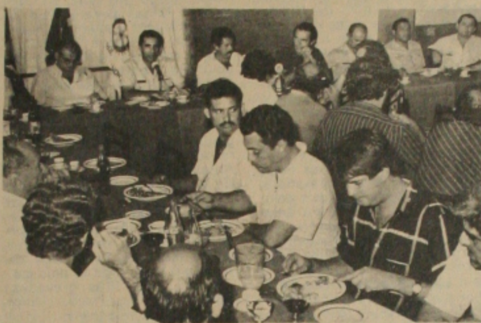
Comandante fala na reunião do CDL.