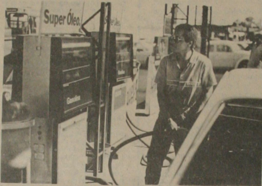
O movimento dos postos de combustíveis não foi alterado.