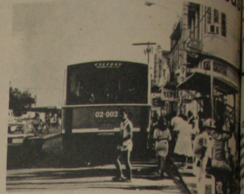
Os aumentos nas passagens dos ônibus dependem dos estudos sendo feitos.